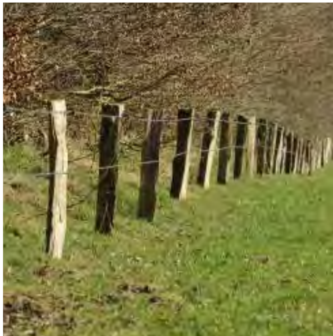
eenvoudig raster langs houtsingel