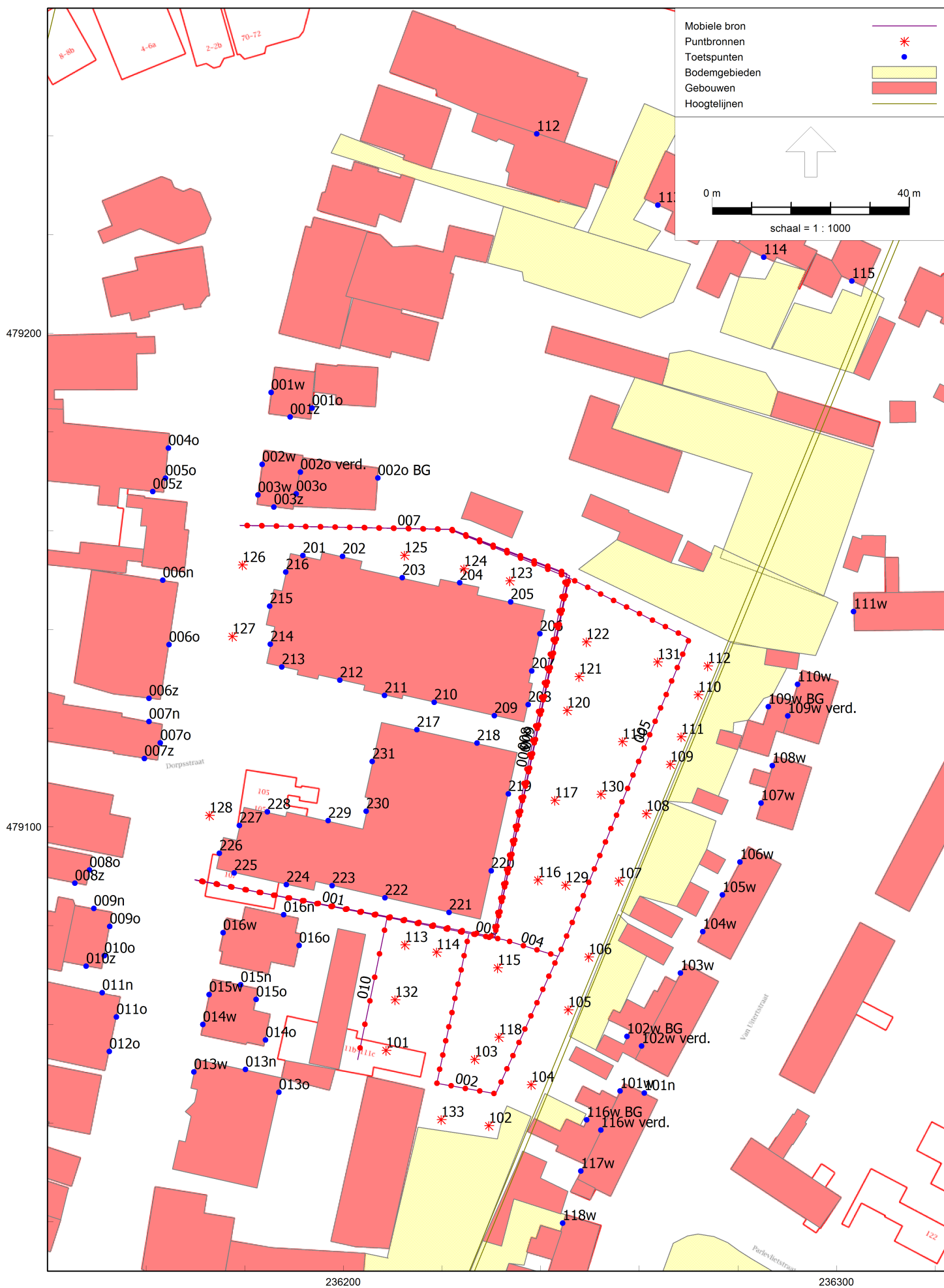
Figuur 2 Overzicht rekenmodel parkeerterrein