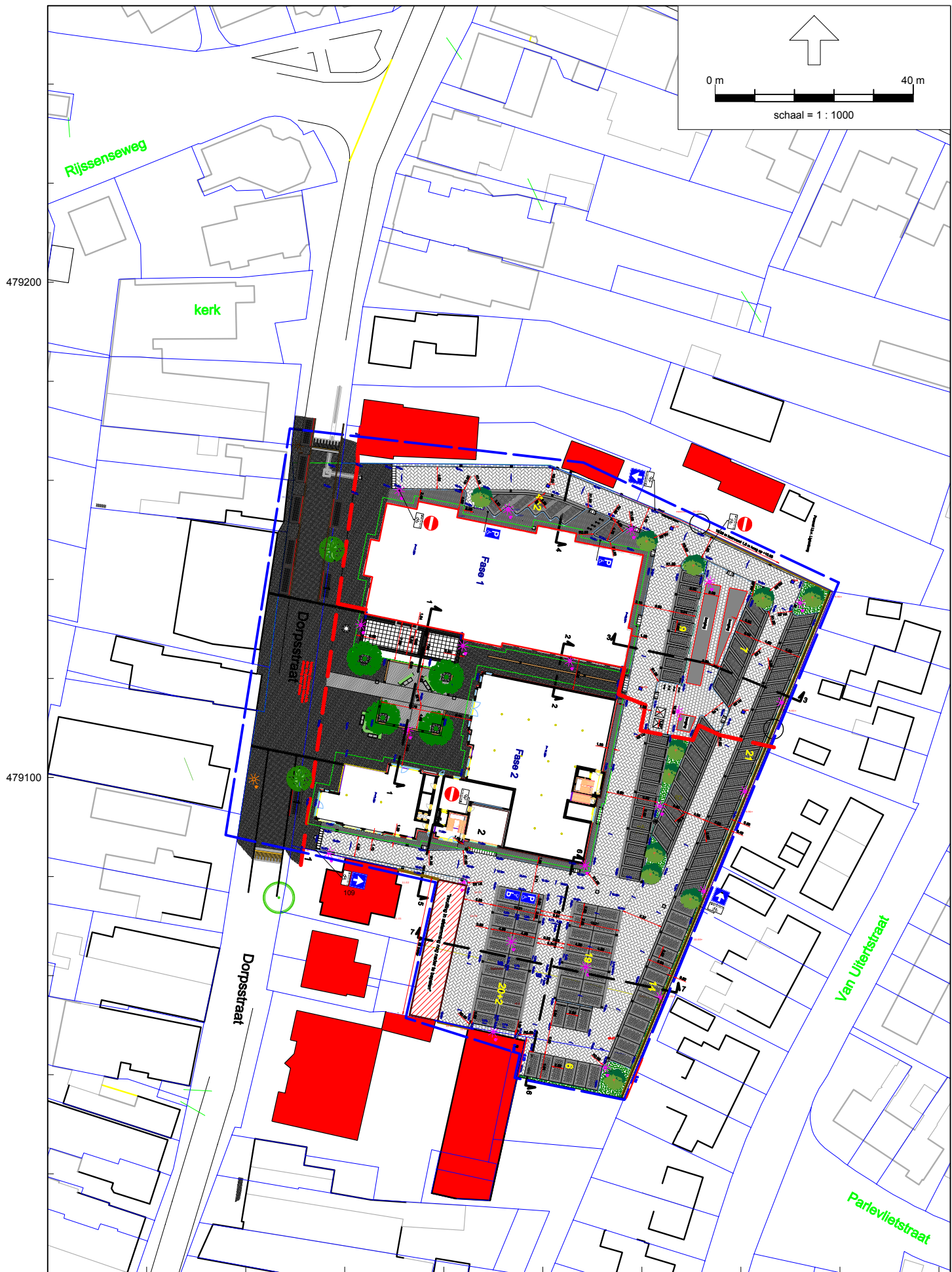
Figuur 1 Situatietekening