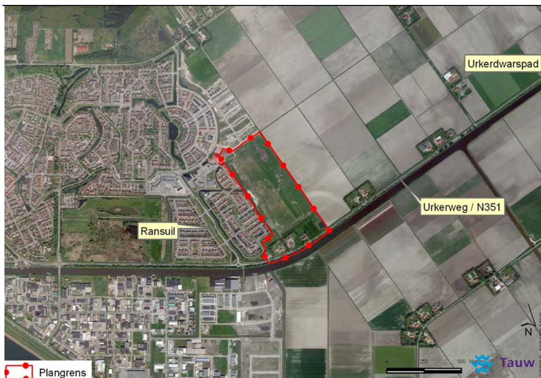
Figuur 1.1 Ligging plangebied Waterwijk in Urk

Het plangebied van het nieuw te ontwikkelen wijk in Urk is opgenomen in figuur 1.1. Waterwijk wordt gerealiseerd ten oosten van Urk aan de Urkerweg.