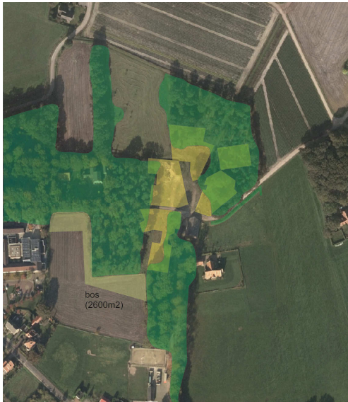
Verbeelding van de wenselijke nieuwe situatie met de bouwkvavels en nieuw bos.

De voorgenomen activiteit bestaat uit het bouwen van enkele woningen en om de bouw mogelijk te maken moeten enkele bomen en struiken gerooid worden. Ter compensatie daarvan wordt nieuw bos aangelegd op een agrarisch perceel aansluitend aan een perceel bestaand bos. De bestaande bebouwing in het plangebied blijft in takt. Op onderstaande afbeelding wordt de nieuwe wenselijke situatie weergegeven. Met de gele vlakken worden de bouwpercelen aangeduid en met de lichtgroene kleur wordt de boscompensatie aangeduid.