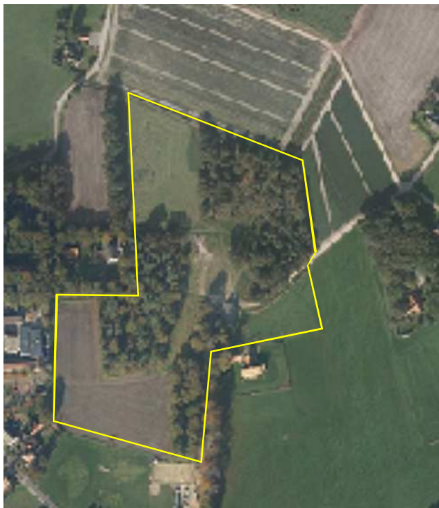
Detailopname van het plangebied.

Het plangebied bestaat uit gemengd naaldbos, agrarische cultuurgrond, zandwegen en een woonerf. Het bos bestaat uit gemengd naaldbos met grove dan, berk, zomereik met een vrij schaarse ondergroei. De agrarische cultuurgrond bestaat deels uit grasland en deels uit akkerland. In de noordwesthoek ligt een extensief beheerde weide met daarin enkele jonge solitaire bomen. In het plangebied ligt aan oude woonboerderij. Deze is gebouwd met bakstenen en is gedekt met gebakken dakpannen. Op onderstaande afbeelding wordt het plangebied meer in detail weergegeven.