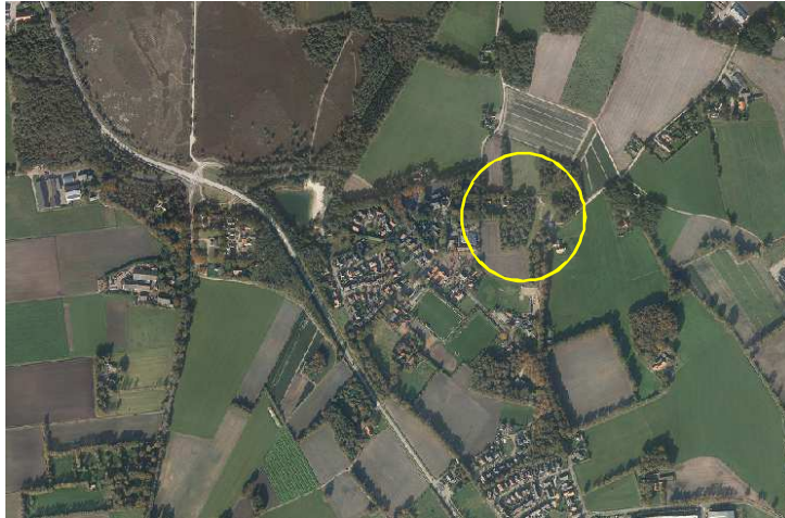
Globale ligging van het plangebied; deze wordt op bovenstaande afbeelding met de cirkel aangeduid.

Het plangebied is gesitueerd aan de Pasboersweg (ongenummerd) in Langeveen. Het ligt in het buitengebied, iets ten oosten van de kern van Langeveen. Op onderstaande afbeelding wordt de globale ligging van het plangebied weergegeven.