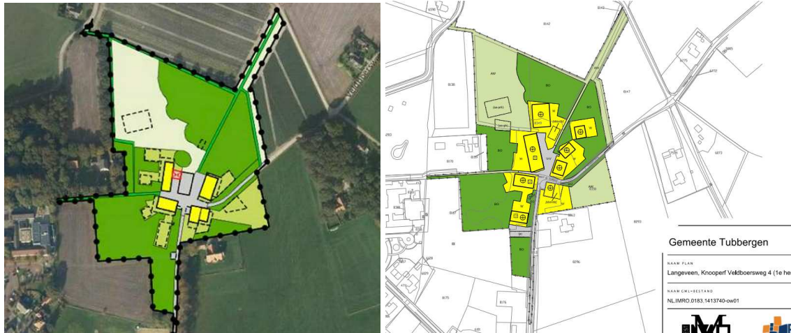
Oude (links) en nieuwe plankaart (rechts).

Op onderstaande kaart zijn de bouwkvavels geprojecteerd op de aanwezige beplanting. Hierdoor wordt inzichtelijk welk oppervlakte beplanting moet wijken om de wenselijke ontwikkeling mogelijk te maken.