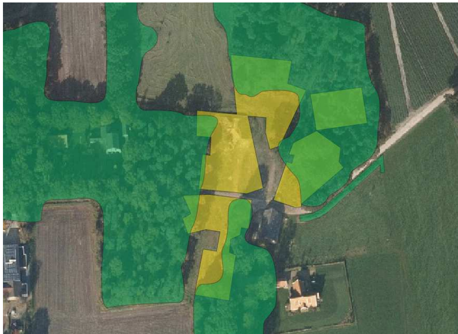
Projectie van bouwkvavels op de aanwezige beplanting.

Op onderstaande kaart zijn de bouwkvavels geprojecteerd op de aanwezige beplanting. Hierdoor wordt inzichtelijk welk oppervlakte beplanting moet wijken om de wenselijke ontwikkeling mogelijk te maken.