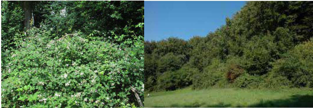
Voorbeeld van een fraaie bosmantel met o.a. bloeiende braam.