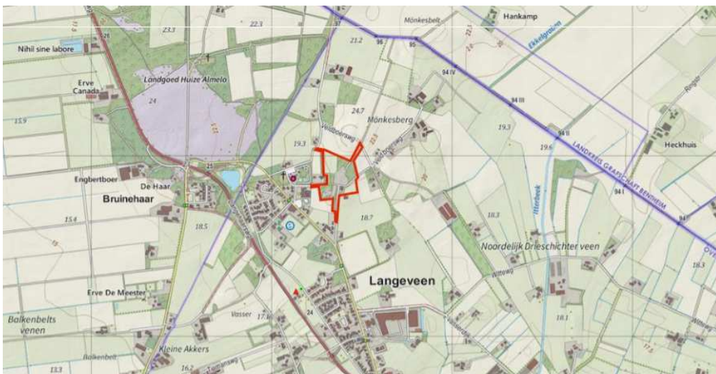
Ligging van het plangebied ten opzichte van Langeveen en de directe omgeving (Bron: Opentopo)

Het plangebied is gelegen aan de Veldboersweg 4 te Langeveen, in de dorpsrand van Langeveen op de overgang naar het landelijk gebied. Op onderstaande afbeelding wordt de globale ligging van het plangebied ten opzichte van Langeveen en de directe omgeving weergegeven (Bron: Opentopo).