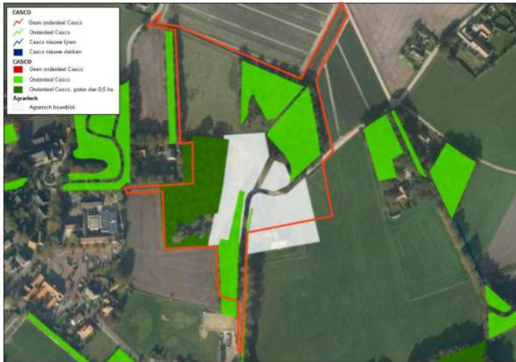
Uitsnede Cascokaart.