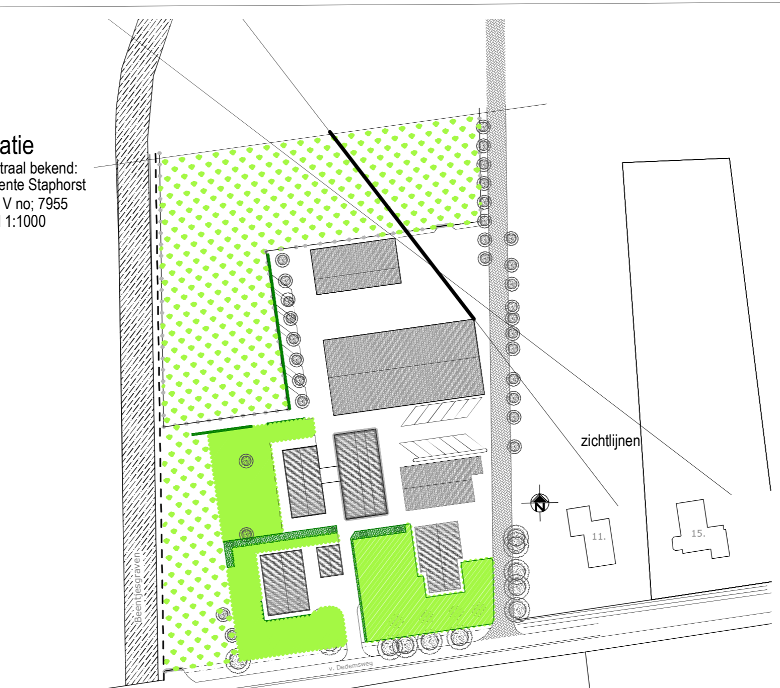
Aangepaste situatie en zichtlijn naar het open veld van Dedemsweg 11 en 15. Nieuwe positie nieuw te bouwen stal aanhouden ter verbetering van de zichtlijnen. Tevens wijziging inrit en parkeerplaatsen groepsaccommodatie. Aanvullende haag westzijde schuren en verlengde rij-aanplant noordzijde weg.