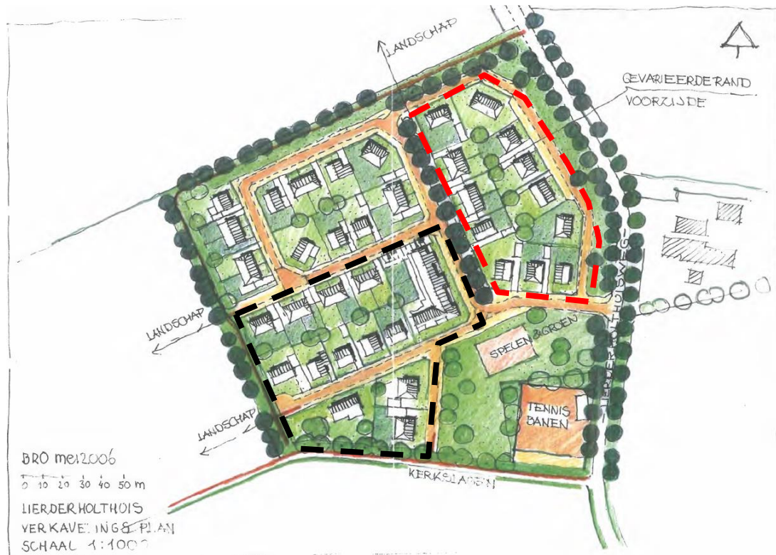
Figuur 1: Oorspronkelijk verkavelingsplan (zwarte streeplijn is Fase 1; rode streeplijn is oorspronkelijke Fase 2)

De stedenbouwkundige hoofdopzet van de uitbreiding in Lierderholthuis bestaat uit 4 woonvlekken, waarvan er nu 2 gerealiseerd zijn. Deze waren in het bestemmingsplan Lierderholthuis 2006 uitgewerkt op basis van onderstaand verkavelingsplan.