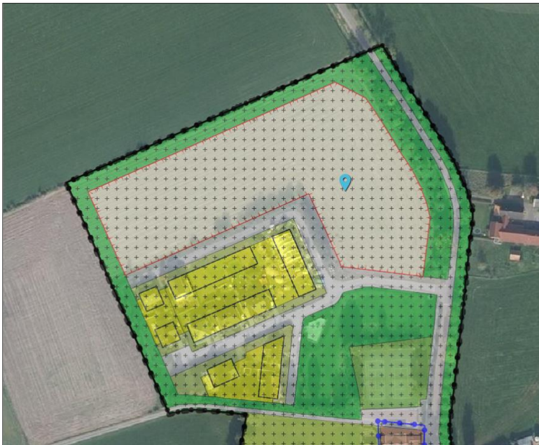
Figuur 3: Geldend bestemmingsplan Lierderholthuis (zie figuur 2 voor huidige verkaveling en verkopen)