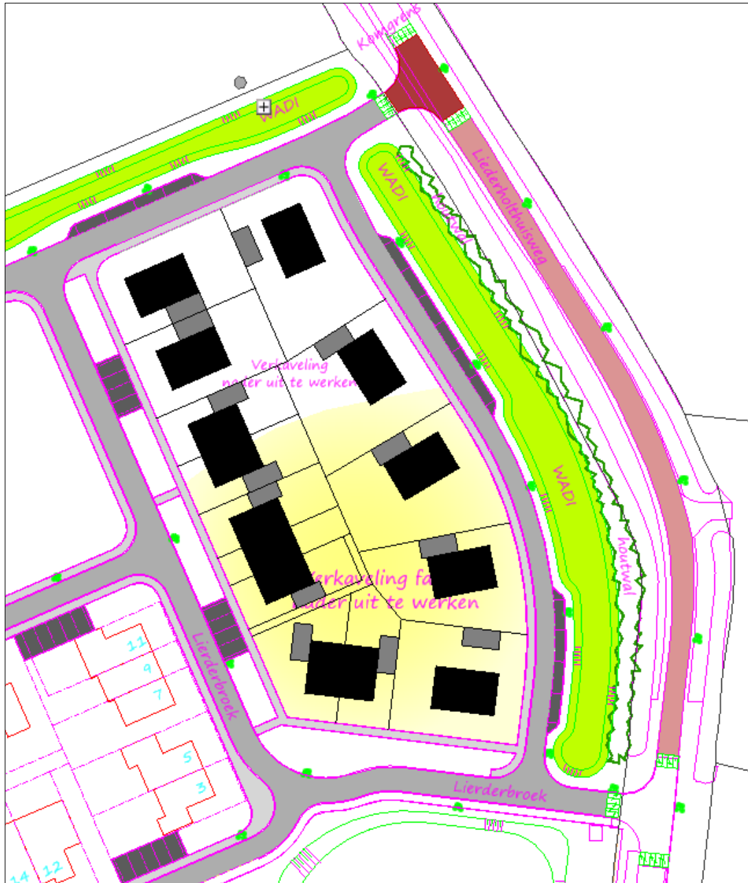
Figuur 4: Verkavelingsplan Fase 2 met aangepast inrichtingsplan (extra aanpassing in de bovenhoek)