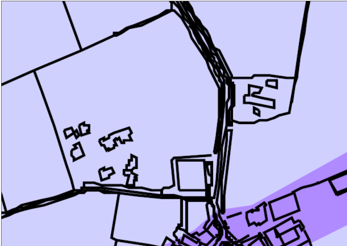
Figuur 6: Archeologische beleidsadvieskaart

Op gemeentelijk niveau is de Beleidsnota archeologie vastgesteld met een archeologische verwachtingskaart. Op de archeologische verwachtingskaart van de gemeente Raalte (zie Figuur 6 ) is te zien dat de uitbreiding is aan te merken als een gebied met een lage archeologische verwachtingswaarde.