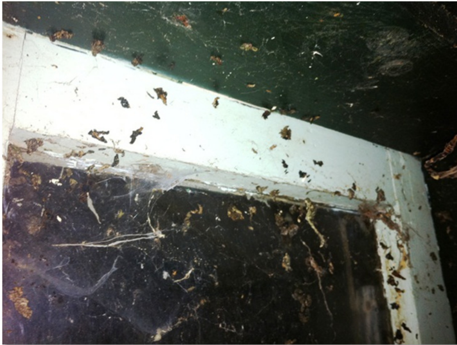
Mest, afkomstig van vleermuizen. Deze verblijfplaats is ontstaan door het afsluiten van de ramen en de deur door twee houten vensters om inbraak in het tuinhuisje te voorkomen. Door het openen van de vensters is deze verblijfplaats verloren gegaan.