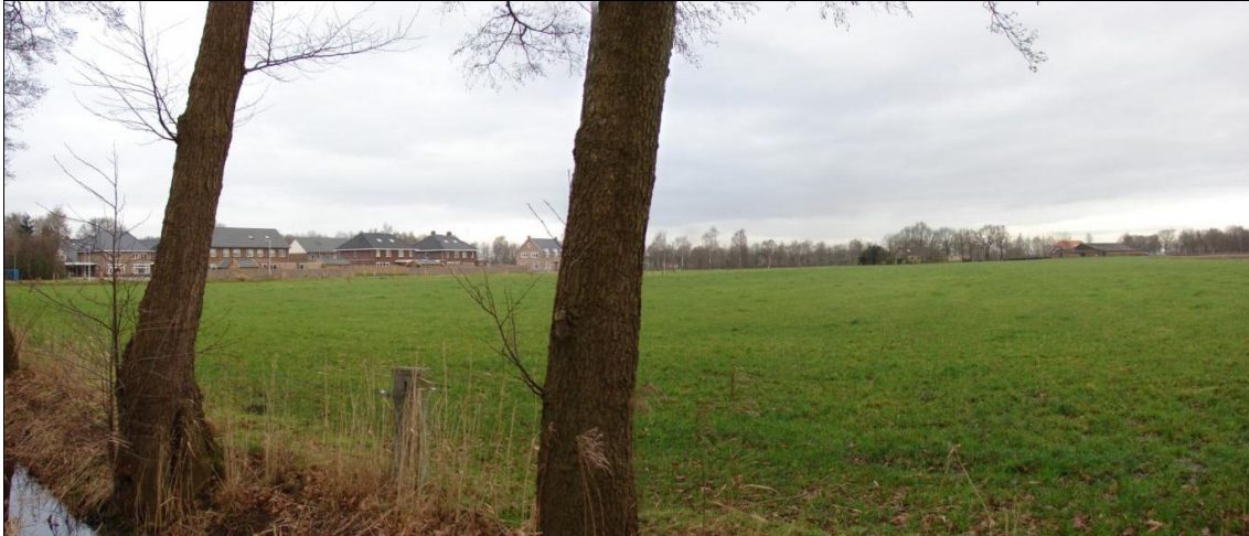
Plangebied vanuit het zuidoosten met op de achtergrond het in fase 1 ontwikkelde gebied