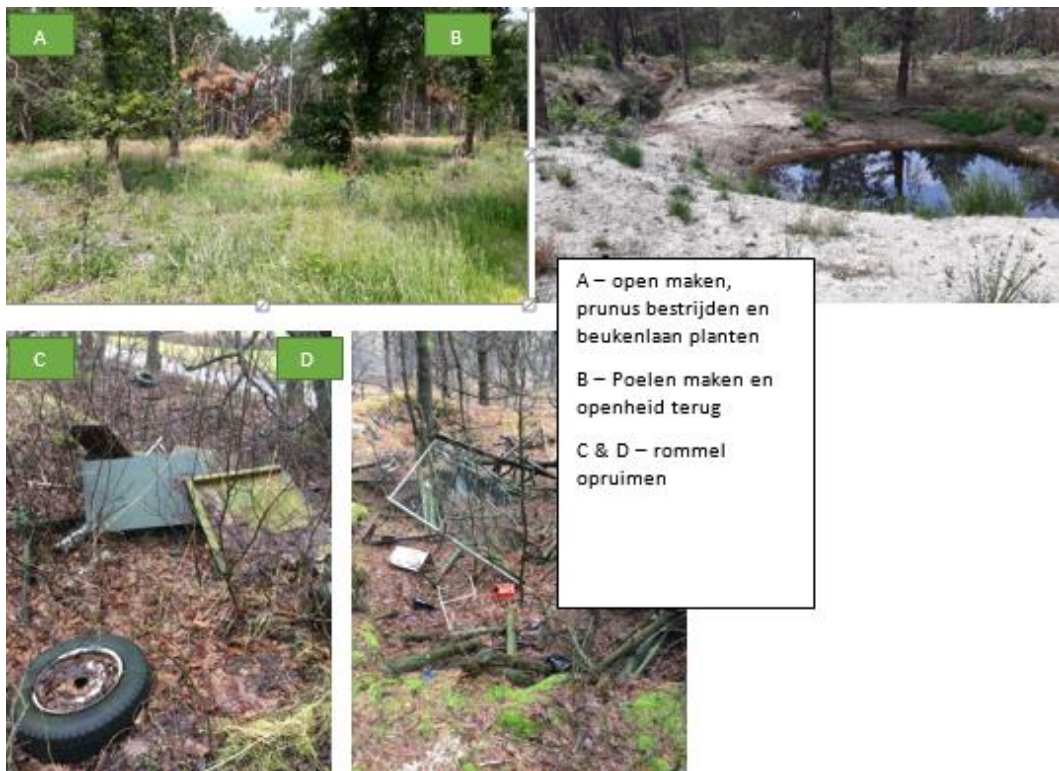
Afbeelding 3: Diverse kwaliteitsinvesteringen in plangebied

De eenmalige investeringen in ruimtelijke kwaliteit zijn geraamd op € 106.872,- inclusief btw. De beheerkosten gedurende de eerste 10 jaar zijn geraamd op € 43.451,- inclusief btw. De totale investeringen in ruimtelijke kwaliteit binnen het plangebied zijn daarmee geraamd op € 150.323,-.