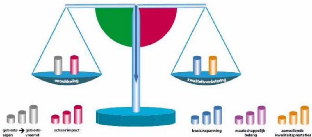
Afbeelding 1: Weegschaal KGO-ontwikkeling

Deze afweging laat zich vatten in een balans zoals op onderstaande afbeelding getoond.