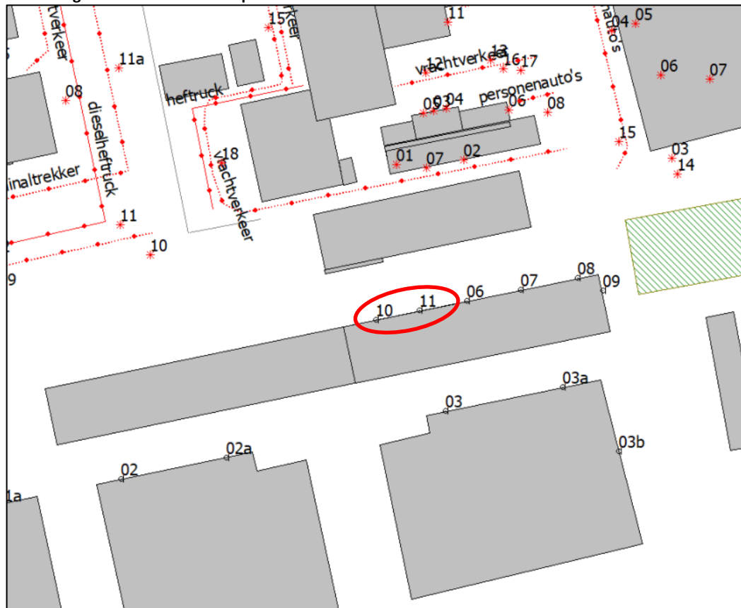
Afbeelding 1: Posities extra rekenpunten 10 en 11

Omdat in de loods over een groter deel geluidgevoelige functies worden gerealiseerd, is in de nu voorliggende notitie deze situatie nader beschouwd. Hierbij de geluidbelasting op twee extra rekenpunten 10 en 11 berekend en nader geanalyseerd.