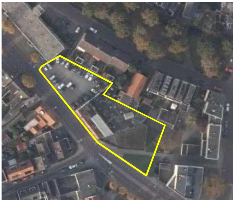
Detailopname van het plangebied. Het plangebied wordt met de rode lijn aangeduid.

Het plangebied bestaat uit een voormalig garagebedrijf, erfverharding en voor een klein gedeelte uit gazon. Het grootste deel van de bebouwing bestaat uit laagbouw met plat dak. Het noordelijke deel van de bebouwing bestaat uit een voormalige woning met schuin dak welke gedekt is met gebakken pannen. De gebouwen staan geruime tijd leeg en zijn op sommige plekken in verval geraakt. Op sommige plaatsen zijn windveren en andere betimmeringen weggebroken en in het dakvlak van de voormalige woning zijn gaten zichtbaar. Op onderstaande afbeelding wordt het plangebied in detail weergegeven.