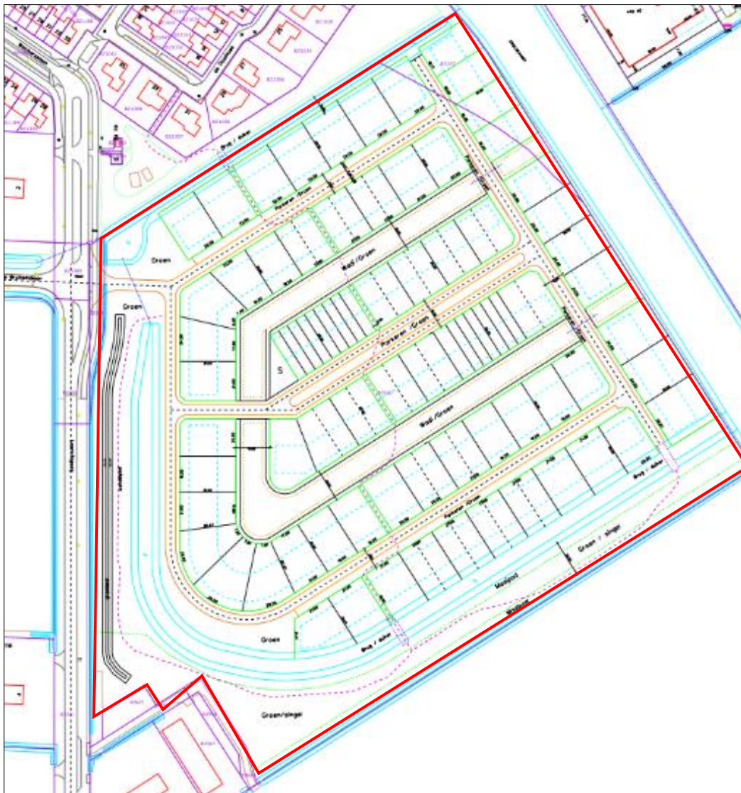
Plattegrond van het wenselijk eindbeeld, begrenzing wordt met de rode lijn aangeduid

Het voornemen bestaat om het plangebied in te richten als woonwijk met 100-120 woningen. Deze woningen worden ontsloten via aan te leggen wegen naar de Leemringweg. Ten noorden en ten zuiden van de uitbreidingswijk worden duikers/bruggen en parkeerplaatsen aangelegd. In het plangebied worden groenstroken aangelegd en centraal in het plangebied worden wadi's aangelegd. Op onderstaande afbeelding wordt een plattegrond van het wenselijk eindbeeld weergegeven.