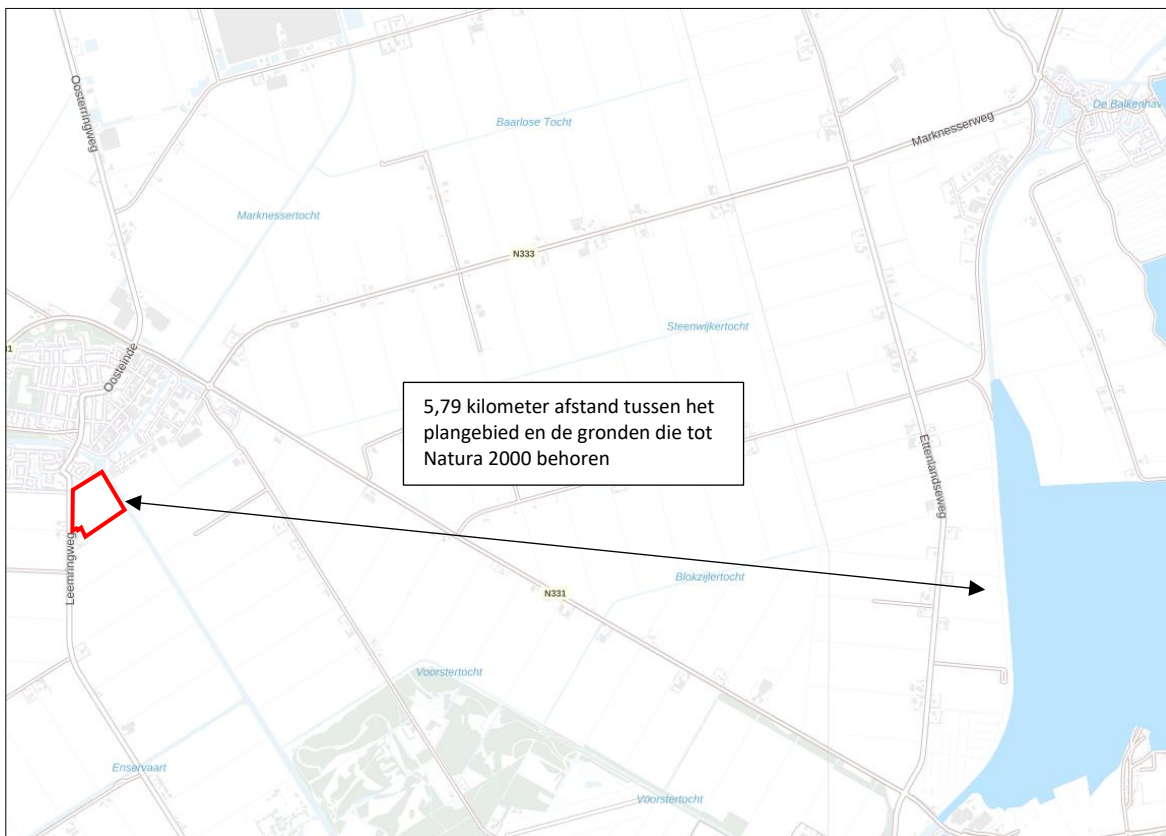
Ligging van Natura 2000-gebied in de omgeving van het plangebied. De ligging van het plangebied wordt met de rode lijn aangeduid. Gronden die tot Natura 2000 behoren worden met de lichtblauwe kleur aangeduid.

Het plangebied ligt op minimaal 5,79 kilometer afstand van Natura 2000-gebied. Het meest nabij gelegen Natura 2000-gebied, is De Wieden. Op onderstaande afbeelding wordt de ligging van het Natura 2000-gebied in de omgeving van het plangebied weergegeven.