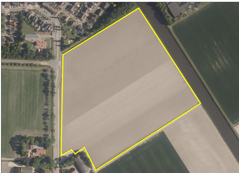
Begrenzing van het plangebied; deze wordt met de gele lijn aangeduid.