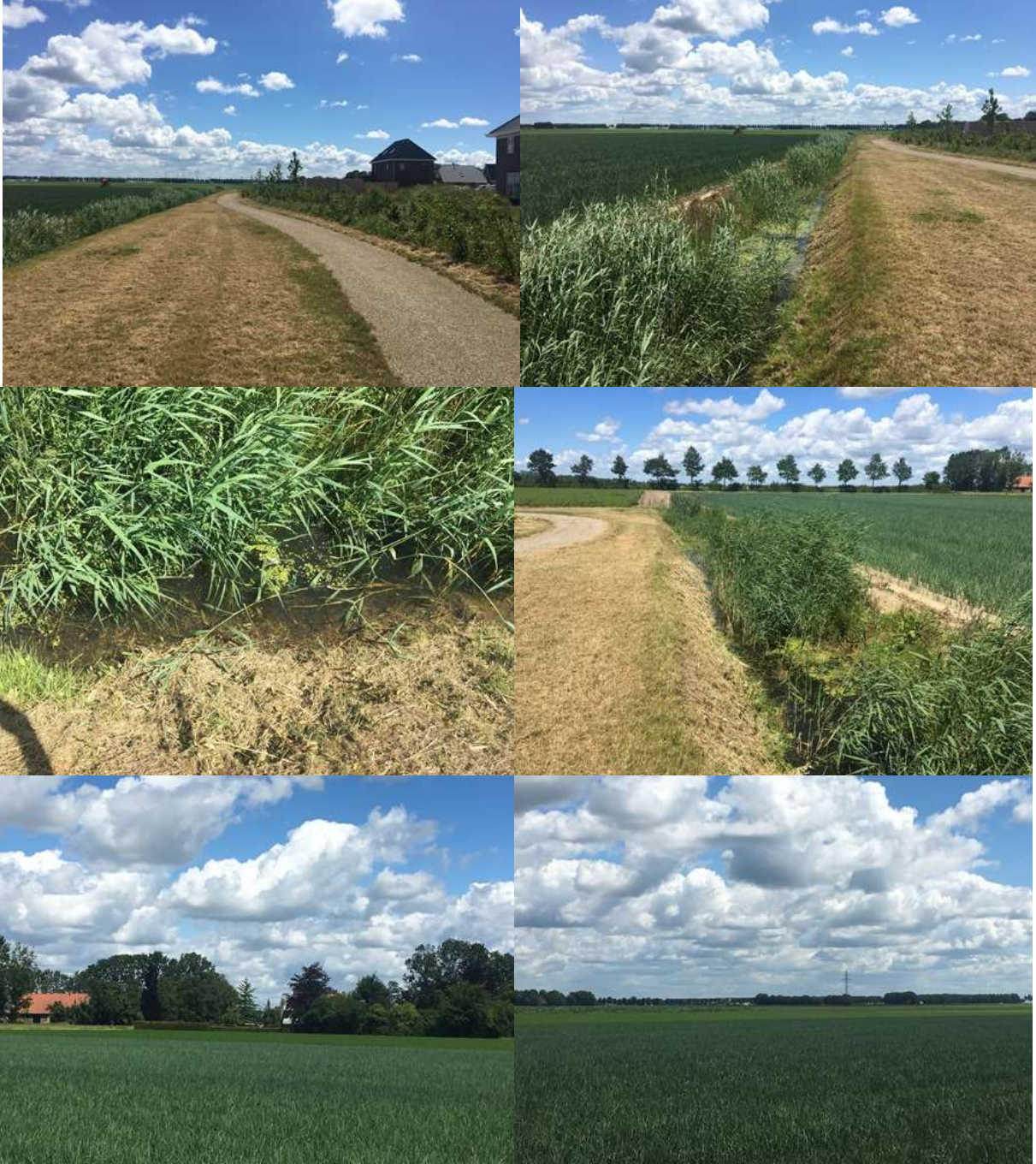
Bijlage 3. Fotobijlage. Impressie van het plangebied en de directe omgeving.