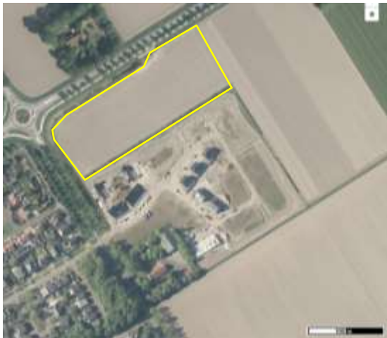
Detailopname en begrenzing van het plangebied. De begrenzing wordt met de gele lijn weergegeven.

Het plangebied bestaat uit agrarische cultuurgrond en kavelgrenssloot. De agrarische cultuurgrond was tijdens het veldbezoek in 2019 in gebruik als akker. De kavelgrenssloot bevatte open water en was plaatselijk dichtgegroeid met riet. De zuidoever van de sloot was gemaaid. Bebouwing of andere bouwwerken ontbreken in het plangebied. Voor een verbeelding van het plangebied wordt naar de fotobijlage verwezen.