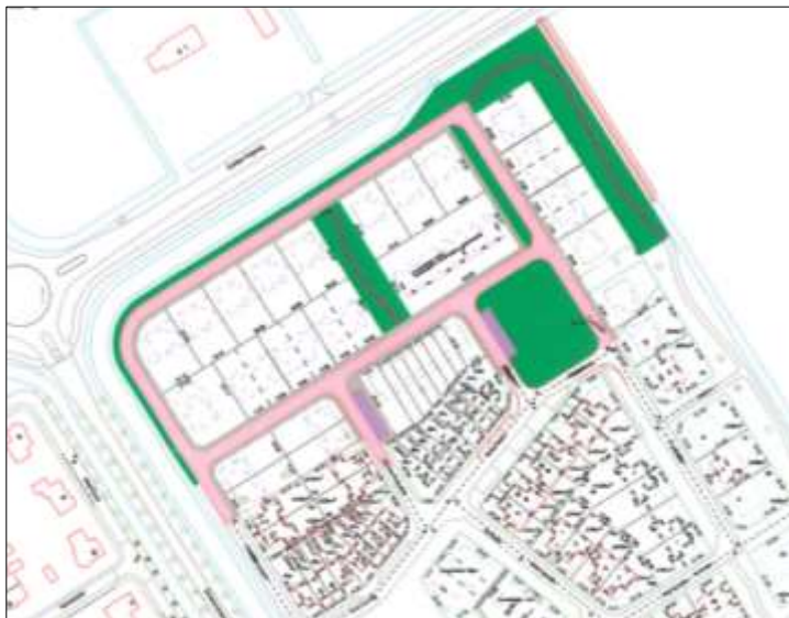
Verbeelding van het wenselijke eindbeeld (bron: BJZ.NU).

Het voornemen is om het plangebied te ontwikkelen als woonwijk, inclusief ontsluitingswegen en (openbaar groen). De nieuwe wijk wordt ontsloten via Anemoon op de Drietorensweg. Om ontwikkeling van de wijk mogelijk te maken moet een bestaande kavelgrenssloot gedempt worden. Op onderstaande afbeelding wordt het wenselijke eindbeeld weergegeven.