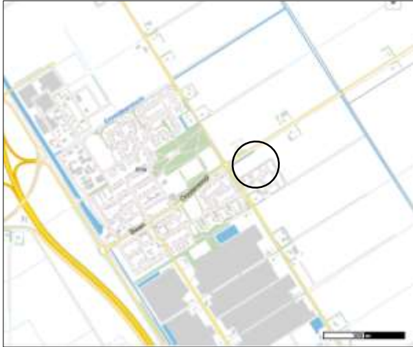
Globale ligging van het plangebied. De ligging van het plangebied wordt met de zwarte cirkel aangeduid.

Het plangebied is gesitueerd ten oosten van de woonkern Ens en ligt in het oksel van de Zuiderringweg en de Drietorensweg. Op onderstaande topografische kaart wordt de globale ligging van het plangebied weergegeven.