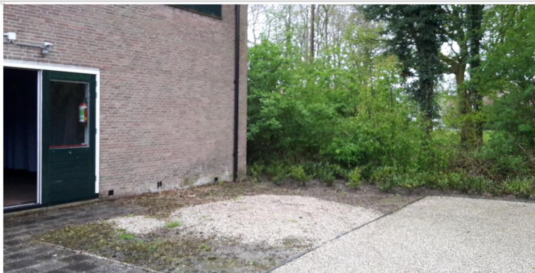
Figuur 2: Locatie garage