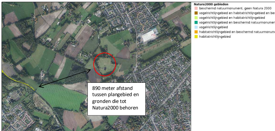
Ligging van Natura2000-gebied in de omgeving van het plangebied. De ligging van het plangebied wordt met de rode cirkel aangegeven. Gronden die tot Natura2000 behoren worden met de okergele kleur aangeduid.