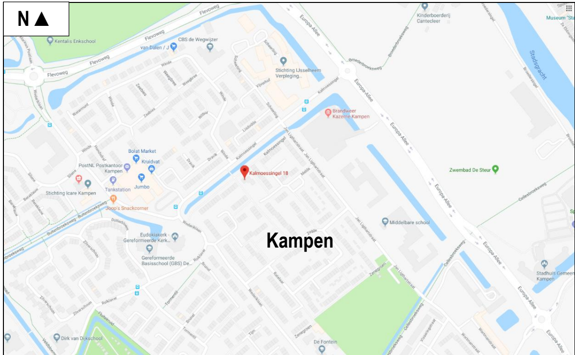
Figuur 1. Globale ligging van het plangebied aan Kalmoessingel 18 te Kampen.

Het plangebied is gelegen aan Kalmoessingel 18 te Kampen (zie figuur 1 en bijlage 1 voor de exacte ligging en begrenzing). Dit gebied bestaat uit een leegstaande voormalige school / kinderdagverblijf. Het voornemen is om de bebouwing te slopen, opgaande groen te rooien, het gebied bouwrijp te maken en om in het gebied woningbouw te kunnen realiseren. Met de realisatie van de plannen wordt geen oppervlaktewater beïnvloed. In figuur 2 wordt een beeld gegeven van het plangebied op dinsdag 10 juli 2018 en in figuur 3 wordt een beeld gegeven van de plannen.