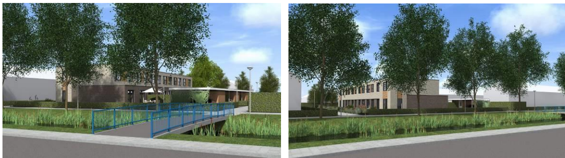
Figuur 3. Impressie van de plannen van Kalmoessingel 18 te Kampen.