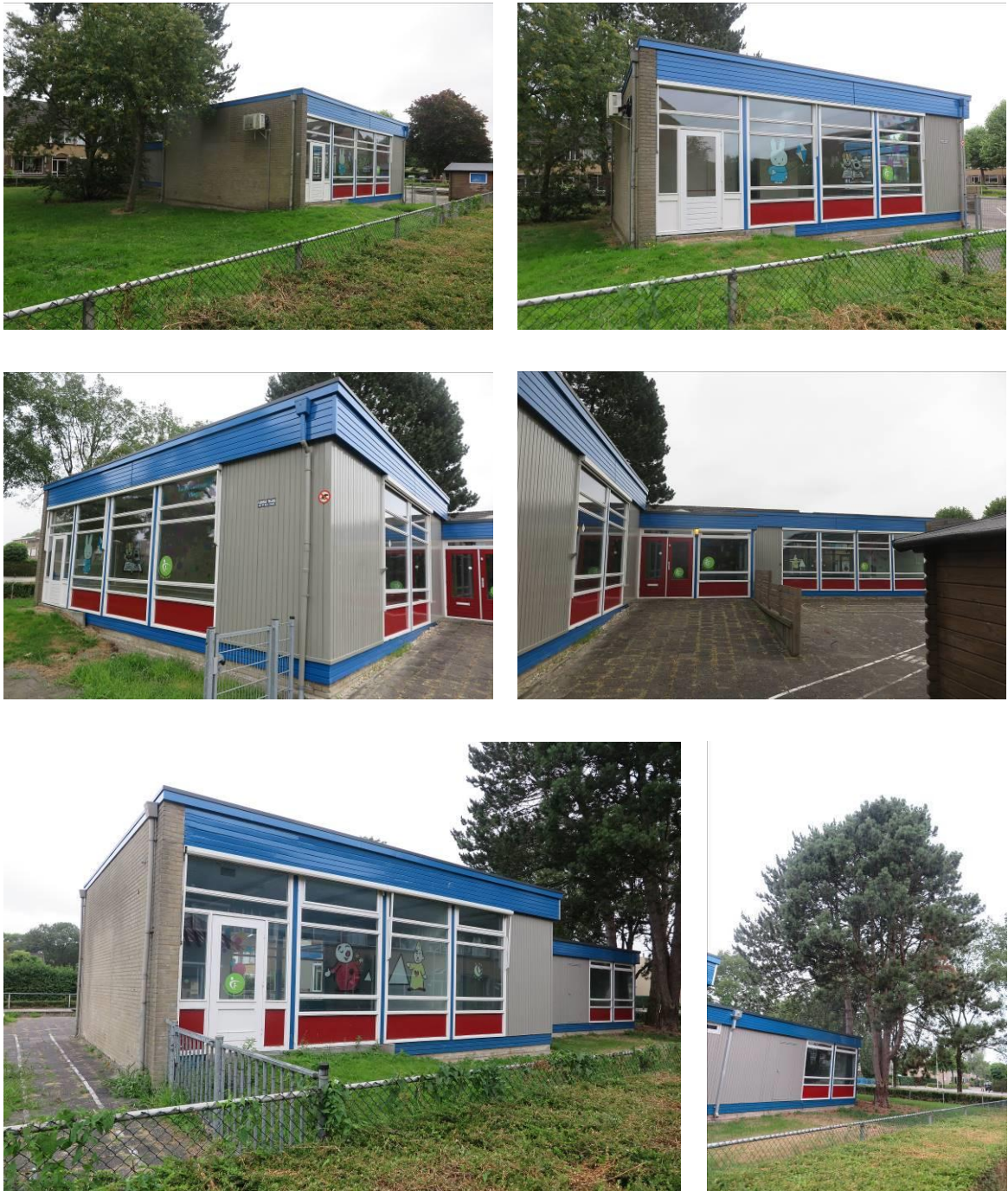
Figuur 2. Foto-impresie van het plangebied aan Kalmoessingel 18 te Kampen.