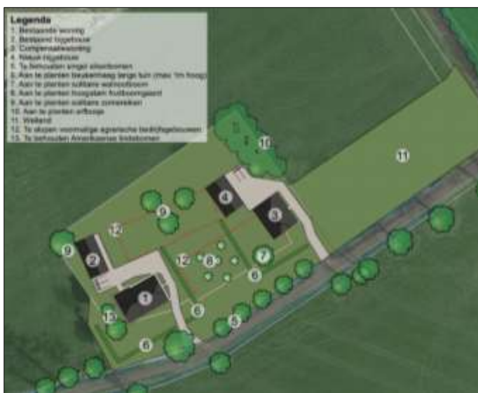
Verbeelding van het wenselijk eindbeeld.

Er zijn plannen om agrarische bebouwing in het plangebied te slopen en een nieuwe woning met bijgebouw te realiseren. De huidige bedrijfswoning blijft gehandhaafd. De woning met bijgebouw worden gerealiseerd in het noordelijke- en centraal gelegen deel van het plangebied (deels op het grasland) en worden d.m.v. een nieuw aan te leggen (verharde) inrit in verbinding gebracht met de Hallerweg. Tevens wordt de bestaande woning met bijgebouw, ten westen van het plangebied, ook d.m.v. een nieuw aan te leggen (verharde) inrit in verbinding gebracht met de Hallerweg. Aangenomen wordt dat alle beplanting behouden blijft en dat een deel van de bestaande erfverharding verwijderd wordt. Centraal in het plangebied wordt een fruitboomgaard aangelegd bestaande uit enkele hoogstam fruitbomen. Tevens worden er solitaire walnootbomen, zomereiken en een erfbosje geplant rondom de nieuw te bouwen woning met bijgebouw. In het zuidwesten van het plangebied wordt een beukenhaag aangelegd. Op onderstaande afbeelding wordt een plattegrond van het wenselijk eindbeeld weergegeven.