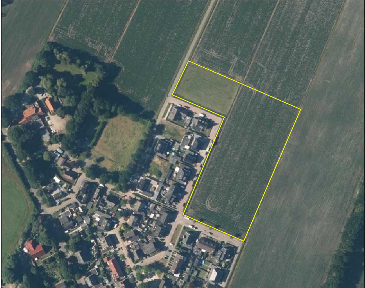
Begrenzing van het plangebied; deze wordt met de gele lijn aangeduid.

Het plangebied bestaat uit een perceel met gras en akker waar een gewas wordt verbouwd. Het plangebied wordt omgeven door zowel woningen als landelijk gebied. Op onderstaande luchtfoto is de begrenzing van het plangebied aangegeven. Voor een verbeelding van de huidige situatie wordt verwezen naar de fotobijlage.