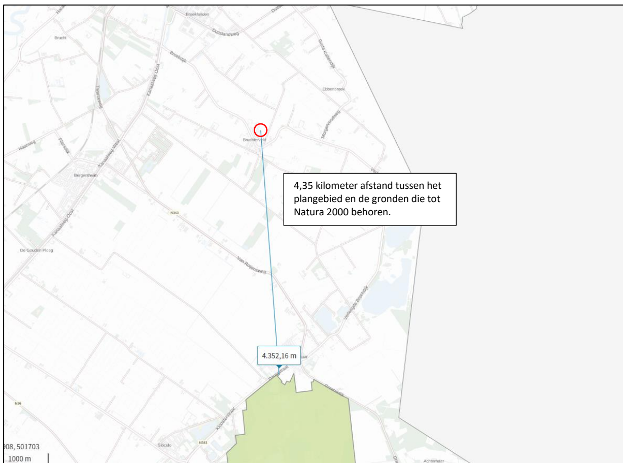
Ligging van Natura 2000-gebied in de omgeving van het plangebied. De ligging van het plangebied wordt met de rode cirkel aangeduid. Gronden die tot Natura 2000 behoren worden met de lichtgroene kleur aangeduid.

Het plangebied ligt op minimaal 4,35 kilometer afstand van Natura 2000-gebied. Het meest nabij gelegen Natura 2000-gebied, is Engbertsdijkvenen. Op onderstaande afbeelding wordt de ligging van het Natura 2000-gebied in de omgeving van het plangebied weergegeven.