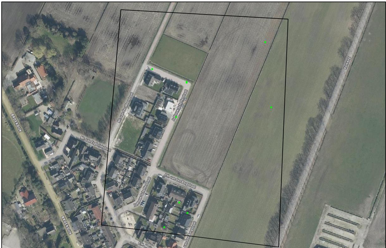
Verspreiding van alle bekende records in het plangebied.

Op 10 september 2023 is de NDFF geraadpleegd en is gekeken of waarnemingen van beschermde planten en dieren aanwezig zijn in de databank. In een ruime begrenzing van het zoekgebied rondom het plangebied, zijn 11 verschillende waarnemingen bekend in de NDFF. Voor de verspreiding van de waarnemingen, zie luchtfoto onder.