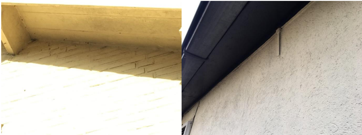
De betimmering van het dakoverstek sluit naadloos aan op de buitengevels van de bebouwing.

Er zijn tijdens het veldbezoek geen vleermuizen waargenomen en er zijn geen aanwijzingen gevonden dat vleermuizen een rust- of voortplantingsplaats in het plangebied bezetten. De bebouwing beschikt weliswaar gedeeltelijk over luchtspouw maar er zijn geen invliegopeningen zoals open stootvoegen of ventilatieopeningen aangetroffen die vleermuizen de kans bieden een verblijfplaats te bezetten. Tevens bestaat de buitengevel van de woning hoofdzakelijk uit kozijnen met glas. Ook sluit de betimmering van het dak overstek naadloos aan op de buitengevels van de bebouwing. De schuur is voor een gedeelte open en toegankelijk voor vleermuizen, maar er zijn geen aanwijzingen gevonden dat vleermuizen er een rustplaats bezetten. Rustplaatsen van vleermuizen in gebouwen zijn doorgaans eenvoudig vast te stellen aan de hand van uitwerpselen onder de hangplek. Verder zijn in het plangebied geen potentiële verblijfplaatsen van vleermuizen waargenomen, zoals een holle ruimte achter een boeiboord, windveer, loodslab, vensterluik, zonnewering of gevelbetimmering aangetroffen. Er zijn geen holenbomen in het plangebied aanwezig.