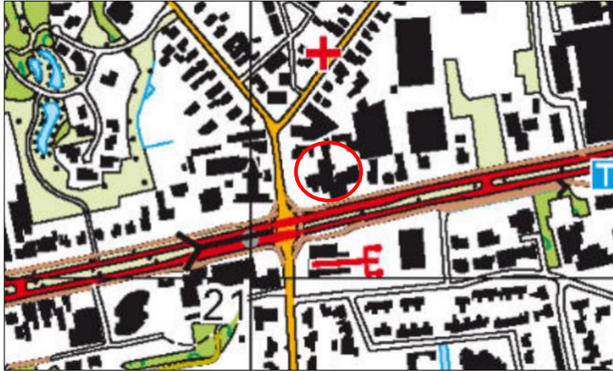
Globale ligging van het plangebied. De ligging van het plangebied wordt met de rode cirkel aangeduid.

Het plangebied is gesitueerd aan de Coevorderweg 2-4 Balkbrug, gemeente Hardenberg. Het ligt centraal gelegen in de woonkern Balkbrug en wordt omgeven door stedelijk gebied. Op onderstaande afbeelding wordt de globale ligging van het plangebied weergegeven op een topografische kaart.