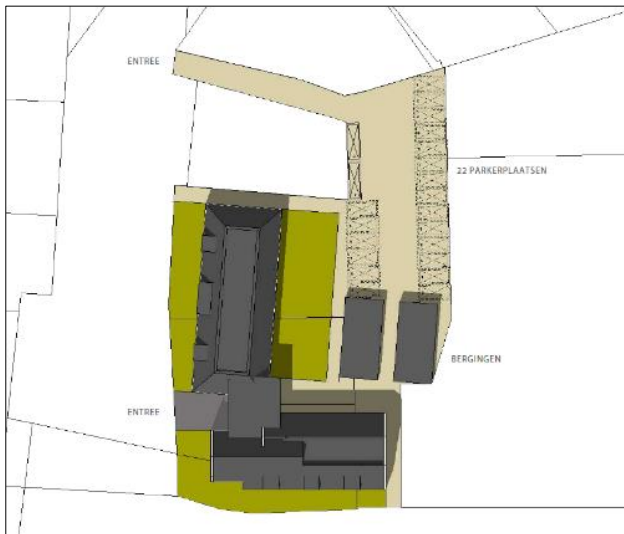
Verbeelding van het wenselijk eindbeeld (bron: Building Design Architectuur)

Het voornemen bestaat om 25 woningen (16 zorgwoningen en 9 appartementen) in het plangebied te realiseren. Deze nieuwe woningen worden d.m.v. een verharde inrit en entree in verbinding gebracht met de westelijk gelegen Meppelerweg. Om deze nieuwbouw te realiseren dient de bestaande bebouwing gesloopt te worden. In het oostelijke deel van het plangebied worden 22 parkeerplaatsen en twee bergingen gerealiseerd. Aangenomen wordt dat de aanwezige beplanting verwijderd wordt. Tevens wordt aangenomen dat een deel van de bestaande erfverharding verwijderd en vervangen wordt en dat er nieuwe erfverharding wordt aangelegd. Rondom de nieuwe bebouwing worden groenstroken aangelegd. Op onderstaande afbeelding wordt een plattegrond van het wenselijk eindbeeld weergegeven.