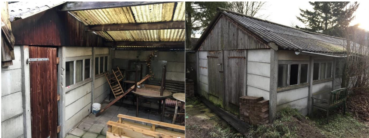
Amfibieën kunnen een (winter)rustplaats bezetten onder opgeslagen spullen/materialen verspreid in de binnen- en buitenruimte.

Tijdens het veldbezoek zijn geen amfibieën waargenomen, maar gelet op de inrichting en het gevoerde beheer, wordt het plangebied als functioneel leefgebied voor sommige algemene en weinig kritische amfibieënsoorten beschouwd. Amfibieën als bruine kikker en gewone pad benutten het plangebied als foerageergebied en mogelijk bezetten ze er een (winter)rustplaats. Deze soorten kunnen een rust- en voortplantingsplaats bezetten in holen en gaten in de grond, onder strooisel en bladeren en onder opgeslagen spullen/materialen verspreid in de binnen- en buitenruimte. De schuur is voor amfibieën toegankelijk en geschikt om een (winter)rustplaats in te bezetten. De overige bebouwing is voor amfibieën niet toegankelijk en daardoor niet geschikt om een (winter)rustplaats in te bezetten. Het plangebied wordt niet als functioneel leefgebied van zeldzame amfibieënsoorten als kamsalamander, rugstreeppad of poelkikker beschouwd. Geschikt voortplantingsbiotoop ontbreekt in het plangebied.