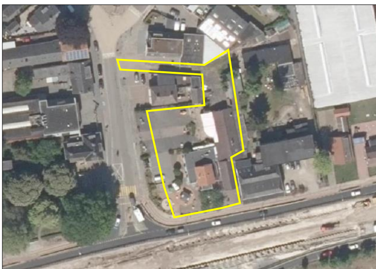
Begrenzing van het plangebied wordt met de gele lijn aangeduid.

Het plangebied bestaat uit bebouwing, beplanting en erfverharding. De bebouwing vormt een horecabedrijf, waar de bedrijfsvoering al enige tijd geleden gestaakt is. De bebouwing bestaat uit bedrijfsgebouwen met aanbouw, een woning en een schuur. De bedrijfsgebouwen beschikken over gemetselde buitengevels zonder luchtspouw en een deel van deze buitengevels zijn gepleisterd. De aanbouw is volledig van hout en de buitengevels bestaan hoofdzakelijk uit kozijnen met glas. De aanbouw beschikt over een plat dak en de bedrijfsgebouwen beschikken over een dakpannen gedekt zadeldak. De woning beschikt over gemetselde buitengevels met luchtspouw en over een dakpannen gedekt zadeldak. De buitengevels van de woning bestaan voor een gedeelte uit kozijnen met glas. De schuur beschikt over buitenmuren van betonelementen en is gedekt met golfplaten. De schuur is voor een gedeelte open en er staan spullen/materialen (o.a. tuinmeubels, pallets en planken) in opgeslagen. In de buitenruimte liggen bakstenen opgestapeld en ligt oud ijzer verspreid. De beplanting bestaat uit vier dakplatanen, bamboe, een laurierstruik en siergras. Op onderstaande afbeelding wordt de begrenzing van het plangebied weergegeven. Voor een verbeelding van de huidige situatie wordt verwezen naar de fotobijlage.