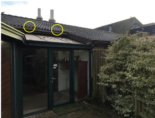
De ruimtes tussen de dakpannen en de dakgoot vormen een potentiële nestplaats voor huismussen.

Het plangebied behoort tot functioneel leefgebied van verschillende vogelsoorten. Vogels benutten het plangebied als foerageergebied en vermoedelijk nestelen er jaarlijks vogels in het plangebied. Vogels kunnen een nestlocatie bezetten in de beplanting, in de toegankelijke bebouwing en onder de dakpannen. Vogelsoorten die mogelijk in het plangebied nestelen zijn merel, roodborst, vink, zwartkop, houtduif en huismus. Er zijn in het plangebied huismussen waargenomen en de dakpannen van de woning lopen niet goed door tot de dakgoot waardoor er ruimtes ontstaan. Deze ruimtes vormen potentiële nestplaatsen voor huismussen. De dakvlakken worden niet als potentiële nestplaats voor gierzwaluwen beschouwd. De nok- en dakpannen sluiten allemaal nauw aan op elkaar zonder kieren of openingen en kapotte dakpannen ontbreken. De schuur is voor een gedeelte open en geschikt voor vogels om er een nestplaats in te bezetten. De overige bebouwing is voor vogels niet toegankelijk.