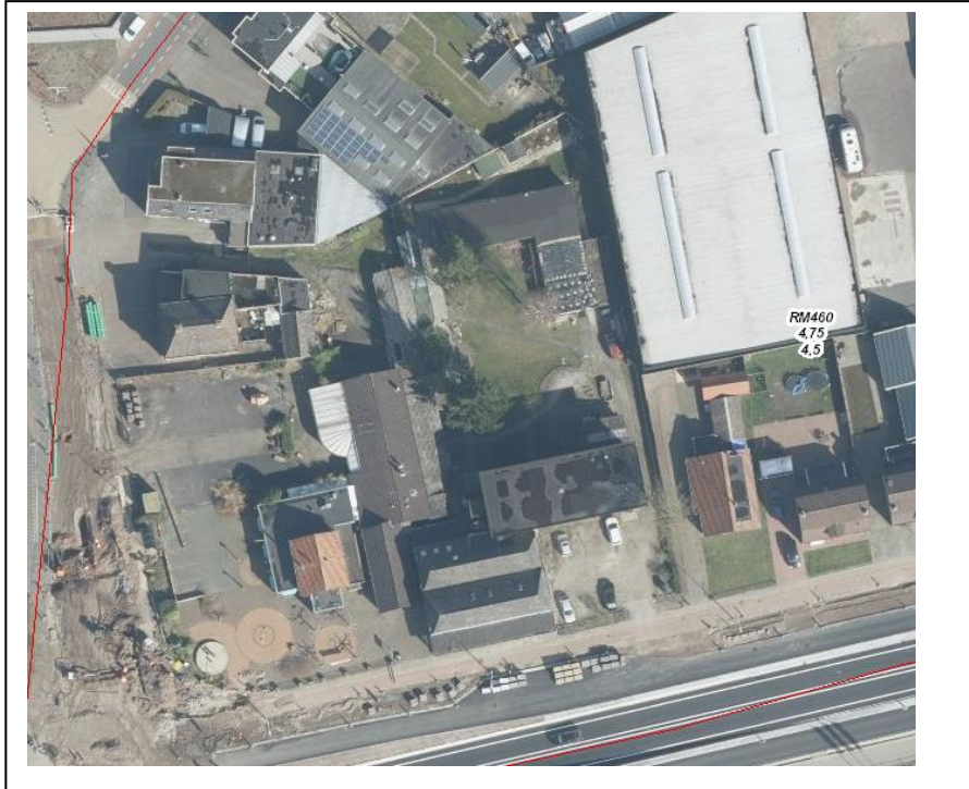
Figuur 1 Kaartbeeld bestaande waterhuishouding rond het plangebied.

Het plan ligt in het stroomgebied de Reest. Rond het plangebied liggen geen PRIMAIRE A WATERGANGEN / SECUNDAIRE B WATERGANGEN die in het beheer van het waterschap zijn. Het peilgebied heeft een maximumpeil van NAP 4.75 m. Dit peil is de instelhoogte van het kunstwerk. Lokaal kunnen er verschillen optreden in het peil afhankelijk van de afstand tot de instelhoogte.