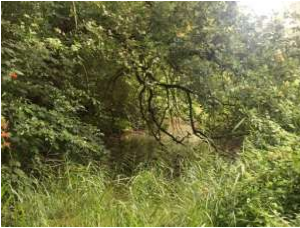
Zicht op de sloot in het plangebied; deze wordt overschaduwd door bomen en struiken.

Tijdens het veldbezoek zijn geen amfibieën waargenomen, maar gelet op de inrichting en het gevoerde beheer, wordt het plangebied als functioneel leefgebied voor sommige algemene en weinig kritische amfibieënsoorten beschouwd. Amfibieën als bruine kikker, gewone pad en kleine watersalamander benutten het plangebied als foerageergebied en mogelijk bezetten ze er een (winter)rustplaats. Deze soorten kunnen een (winter)rustplaats bezetten in holen en gaten in de grond en onder strooisel en bladeren. Het plangebied wordt niet als functioneel leefgebied van zeldzame amfibieënsoorten als kamsalamander, rugstreppad of poelkikker beschouwd. De aanwezige sloot in het plangebied wordt niet als geschikt voortplantingsbiotoop voor amfibieën beschouwd. De sloot wordt overschaduwd door bomen, struiken en ruigte langs de oevers.