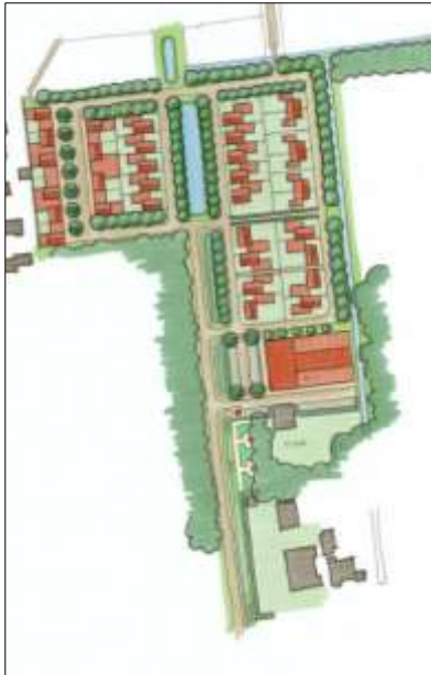
Verbeelding van het wenselijk eindbeeld.

Er zijn plannen om alle aanwezige bebouwing te slopen en nieuwbouw van 34 woningen met parkeerplaatsen te realiseren. Er worden verharde wegen en waterpartijen aangelegd. Aangenomen wordt dat alle aanwezige beplanting en bestaande erfverharding verwijderd worden en dat de sloot gedempt wordt. Tevens wordt aangenomen dat er nieuwe erfverharding wordt aangelegd. Het plangebied wordt landschappelijk ingepast d.m.v. aanplant van erfbeplanting. Op onderstaande afbeelding wordt een plattegrond van het wenselijk eindbeeld weergegeven.