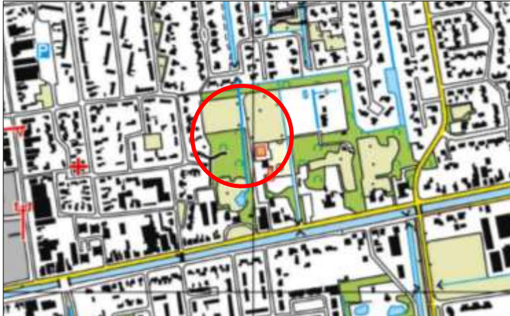
Globale ligging van het plangebied. De ligging van het plangebied wordt met de rode cirkel aangeduid.

Het plangebied is gesitueerd aan de Moerheimstraat (ongenummerd) te Dedemsvaart, gemeente Hardenberg. Het ligt in het centrale deel van de woonkern Dedemsvaart en wordt omgeven door stedelijk gebied. Op onderstaande afbeelding wordt de globale ligging van het plangebied weergegeven op een topografische kaart.