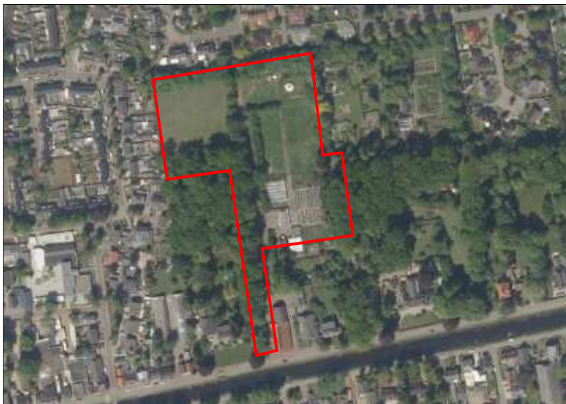
Begrenzing van het onderzoeksgebied; deze wordt met de rode lijnen aangeduid.

Om het effect van de voorgenomen activiteiten volledig in beeld te kunnen brengen, is een strook van 10 meter in de aangrenzende bospercelen (zowel oost- als westzijde) meegenomen in het onderzoek. Indien in dit rapport gesproken wordt over plangebied, wordt onderstaand onderzoeksgebied bedoeld.