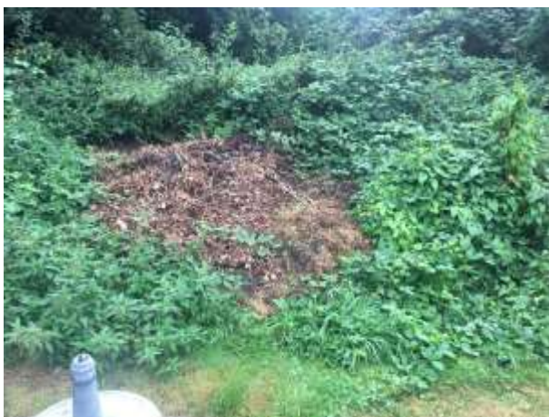
Een bult groenafval biedt egels een potentiële rust- en voortplantingsplaats.

Er zijn in het plangebied geen beschermde grondgebonden zoogdieren waargenomen, maar het plangebied behoort vermoedelijk tot functioneel leefgebied van verschillende algemene- en weinig kritische grondgebonden zoogdiersoorten als huisspitsmuis, aardmuis, gewone bosspitsmuis, bosmuis, eekhoorn, bunzing, steenmarter en egel. Voorgenoemde soorten benutten het plangebied hoofdzakelijk als foerageergebied, maar mogelijk bezetten huisspitsmuizen, aardmuizen, gewone bosspitsmuizen, bosmuizen en egels er een vaste rust- en voortplantingsplaats. Muizen kunnen een rust- en voortplantingsplaats bezetten in hopen en gaten in de grond en onder (groen)afval, rommel en opgeslagen (bouw)materialen. Mogelijk bezetten egels een rust- en/of voortplantingsplaats onder (groen)afval, zoals een takkenbos. De bebouwing in het plangebied is goed afgesloten en is daardoor niet toegankelijk voor grondgebonden zoogdieren om te betreden. Ook zijn geen (blader)nesten van eekhoorns in het plangebied vastgesteld.