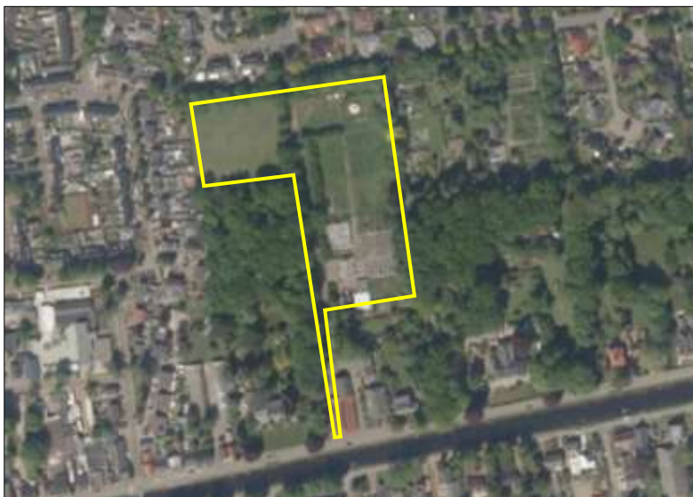
Begrenzing van het plangebied; deze wordt met de gele lijnen aangeduid.

Het plangebied bestaat uit bebouwing, beplanting, grasland, erfverharding en een sloot. De bebouwing bestaat uit enkele kassen en schuren die bij een tuincentrum horen. De bedrijfsactiviteiten van dit tuincentrum zijn al enige tijd geleden gestaakt. Een deel van het plangebied is ingericht als recreatieverblijf met een Mongoolse yurt en een tuin. In het plangebied staat één schuur welke volledig van hout is. Deze schuur is betimmerd met houten planken (schaaldelen) en is gedekt met golfplaten. De andere schuur beschikt over bakstenen buitengevels met luchstbouw en is gedekt met dakpannen. De beplanting vormt bomenrijen en bossches die bestaan uit loofbomen, struiken en ruigte. Het grasland vormt voor een deel weiland dat bestaat uit een soortenarme vegetatie en intensief wordt beheerd. Op onderstaande luchtfoto is de begrenzing van het plangebied aangegeven. Voor een impressie van het plangebied wordt verwezen naar de fotobijlage.