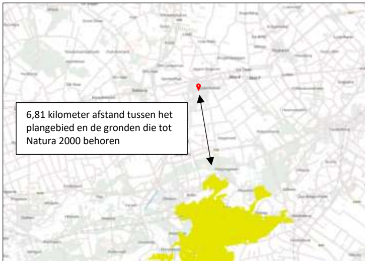
Ligging van Natura 2000-gebied in de omgeving van het plangebied. De ligging van het plangebied wordt met de rode marker aangeduid. Gronden die tot Natura 2000 behoren worden met de okergele kleur aangeduid.

Het plangebied ligt op minimaal 6,81 kilometer afstand van Natura 2000-gebied. Het meest nabij gelegen Natura 2000-gebied, is Vecht- en Beneden- Reggegebied. Op onderstaande afbeelding wordt de ligging van het Natura 2000-gebied in de omgeving van het plangebied weergegeven.