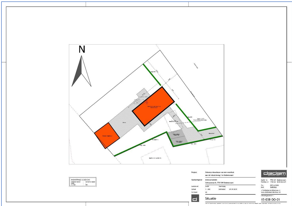
Figuur 6: Overzicht van de gewenste situatie.