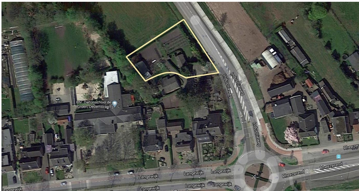
Figuur 5: Overzicht van onderzochte locatie (in geel kader).

Voor een overzicht van de beoogde plannen, zie figuur 6 op pagina 18.