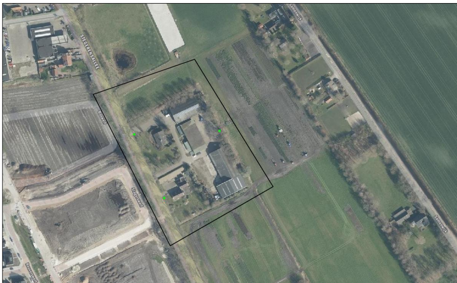
Verspreiding van alle bekende records (groene stip) in het plangebied.

Op 6 april 2023 is de NDFP geraadpleegd en is gekeken of waarnemingen van beschermde planten en dieren aanwezig zijn in de databank. Er zijn drie waarnemingen vastgesteld in de directe omgeving van het plangebied. Dit betreffen de waarnemingen van een gekraagde roodstaart, bijvoet en gewone berenklauw. Er zijn geen waarnemingen uit de NDFP naar voren gekomen die relevant zijn voor voorliggende studie.