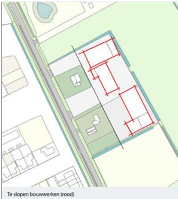
Overzicht van de te slopen bedrijfsgebouwen.

Begrenzing van het plangebied; deze wordt met de gele lijn aangeduid.