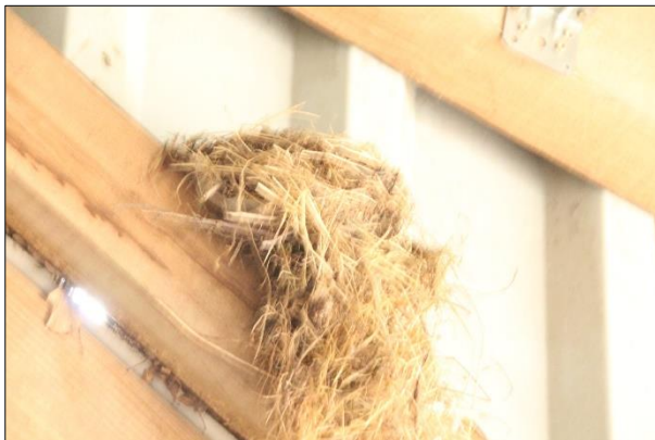
Oud merelnest aangetroffen in een te slopen bedrijfshal.

Het plangebied behoort tot functioneel leefgebied van verschillende vogelsoorten. Vogels benutten het plangebied als foerageergebied en mogelijk nestelen er jaarlijks vogels in het plangebied. Vogels kunnen een nestlocatie bezetten in de toegankelijke bedrijfsgebouwen. Vogels die mogelijk in het plangebied nestelen zijn roodborst, winterkoning, witte kwikstaart, holenduif en merel. Er zijn tijdens het bezoek geen huismussen in het plangebied aangetroffen en er zijn geen geschikte nestlocaties voor deze soort aanwezig in de te slopen bebouwing. De bedrijfsgebouwen zijn bedekt met golfplaten en beschikken niet over een dakbeschot. Er zijn geen oude of potentiële nesten van roofvogels of uilen in de bebouwing of in beplanting in de omgeving van het plangebied waargenomen. Deze nesten zijn doorgaans gemakkelijk te vinden aan de hand van schijfsporen en braakballen.