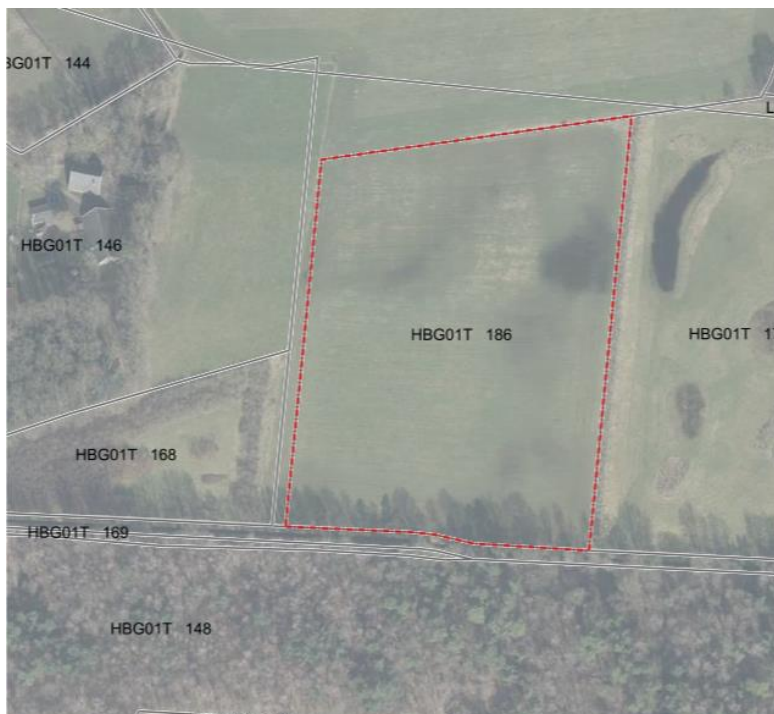
Figuur 4.3 Buurserhege noord

In de Buurserhege Noord wordt bos geplant. Er vindt grondverzet binnen het perceel plaats om een verdwenen houtwal te herstellen en nieuwe wal te maken aan de rand van het perceel. De verwachting is dat binnen 20 jaar hier leefgebied ontstaat voor o.a. 10 soorten broedvogels, waaronder Fitis, Tuinfluiter en Zwartkop. Het gebied zal van betekenis worden voor aantal soorten zoogdieren als Egel, Ree en meerdere soorten muizen. In het nieuwe bos wordt vak Schietwilg geplant, waar na 20 jaar boomholten ontstaan door spechten, die van betekenis kunnen worden als verblijfplaats voor vleermuizen (mogelijk Ruige dwergvleermuis).