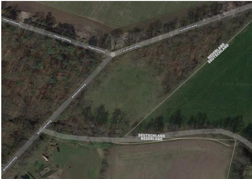
Figuur 3.4. Ligging van gebied tussen Hegebeek, Witteveenweg, Twistveenweg en de Nederlands-Duitse grens.

In BuurserHege oost wordt het hele grasland perceel afgeschaapt en grond gebruikt om een houtwal op te werpen en bestaande houtwal te verbreden. Het gebied is te klein om groot effect op de natuur te verwachten. Na aanplant zal hier de Fitis verschijnen, bij ouder worden ook Tuinfluiter en Zwartkop. Er ontstaat in jonge bos ook extra leefgebied voor kleine zoogdieren, waaronder de Egel.