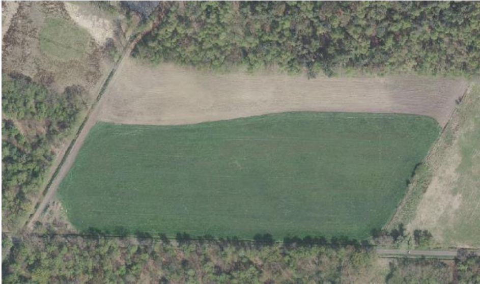
Figuur 3.2. BuursHege midden in 2019 met Engels raaigras en strook mais langs bosrand

In BuurserHege midden wordt bos aangeplant, een kleine speelweide aangelegd en bosweg met ontwikkeling van struweelrijke bosranden. Hier vindt beperkt verplaatsing van grond plaats voor de ontwikkeling van laagten en wallen. Deze werkzaamheden vindt binnen het perceel plaats. Buiten het perceel zijn geen werkzaamheden of ingrepen voorzien. De verwachting is dat binnen 20 jaar hier leefgebied ontstaat voor o.a. 10 soorten broedvogels.