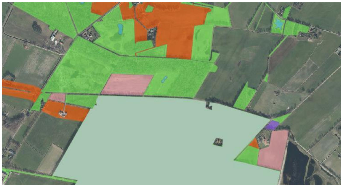
Figuur 1.2. N2000 en NNN met zoen ONW (Ondernemen met Natuur en Water, oranje), ontwikkelopgave (roze, aangepast), idem paars.

Voor BuurserHege noord geldt dat niet kan worden uitgesloten dat hier de Kievit tot broeden komt, maar gezien ontbreken van enige indicatie in maart en mei tijdens veldbezoeken lijkt die kans heel klein. Bosaanplant vindt hier bij voorkeur niet in het broedseizoen plaats.