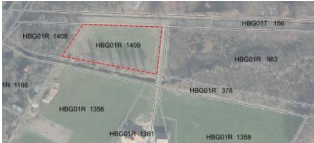
Figuur 3.1. Ligging van het perceel

In BuurserHege west is sprake van een maisakker. Hier vindt grondverzet plaats binnen de akker, waarmee een houtwal wordt gemaakt, waarna zich een spontaan bos mag ontwikkelen. Buiten de akker zijn geen werkzaamheden of ingrepen voorzien.