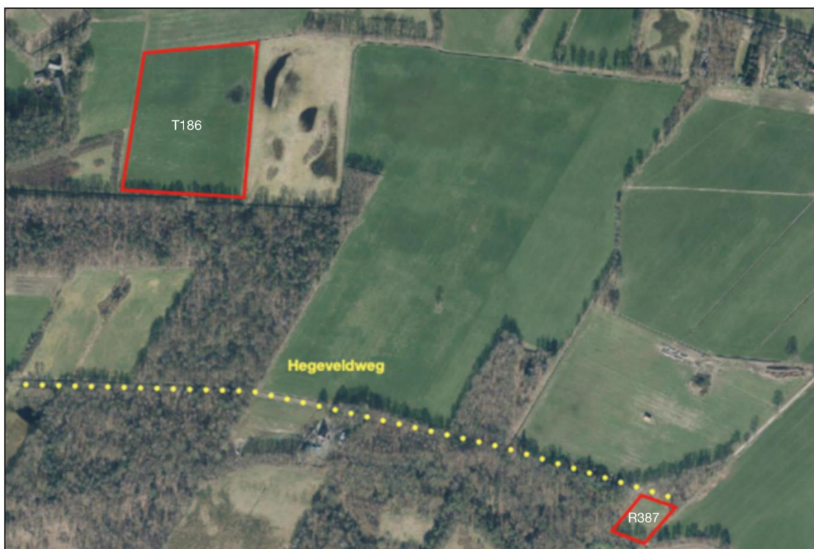
Afbeelding 1.1 Locatie percelen aan de Hegeveldweg

Het plangebied bestaat uit twee percelen rondom de Hegeveldweg in het buitengebied van Haaksbergen. Hieronder in afbeelding 1.1 is met rood de ligging van de percelen weergegeven. De Hegeveldweg is hier tevens ook weergegeven met de gele stippellijn.