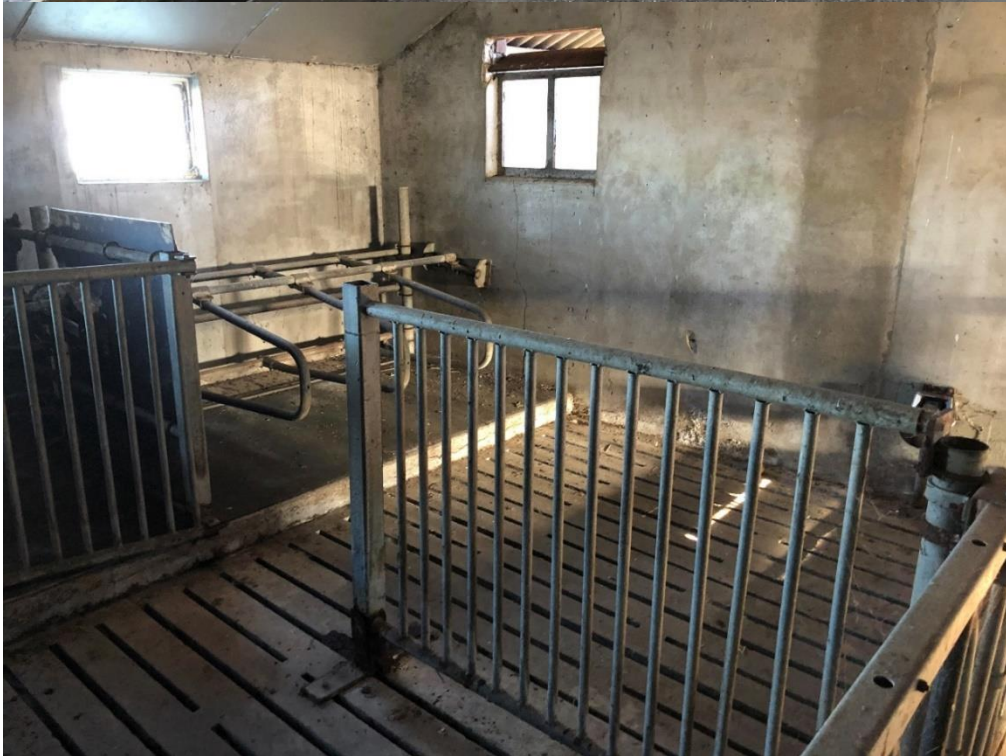
Interieur rundveestal en jongveestal