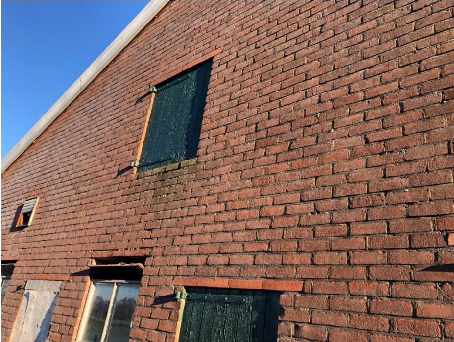
Zijgevel en buitenzijde rundveestal