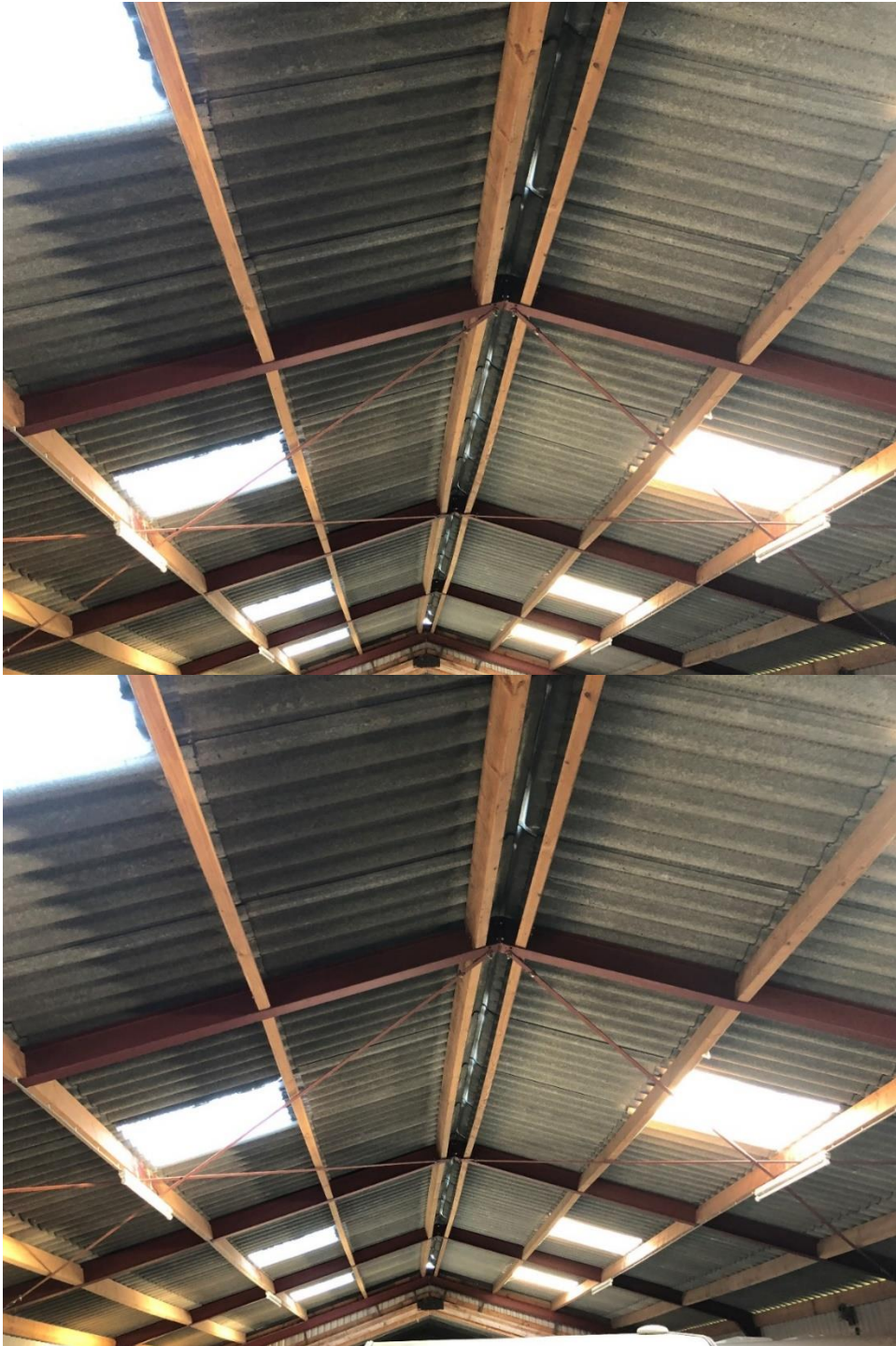
Onderaanzicht binnen damwandschuur