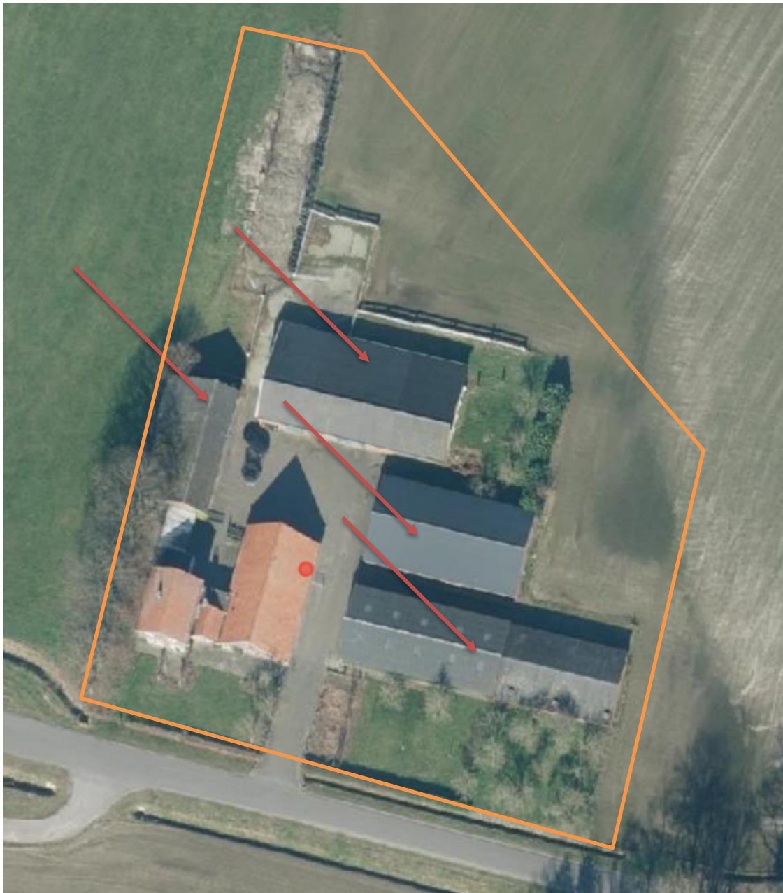
Grens onderzoekslocatie en te slopen gebouwen.

De werkzaamheden kunnen worden aangemerkt als werkzaamheden in het kader van ruimtelijke inrichting of ontwikkeling.