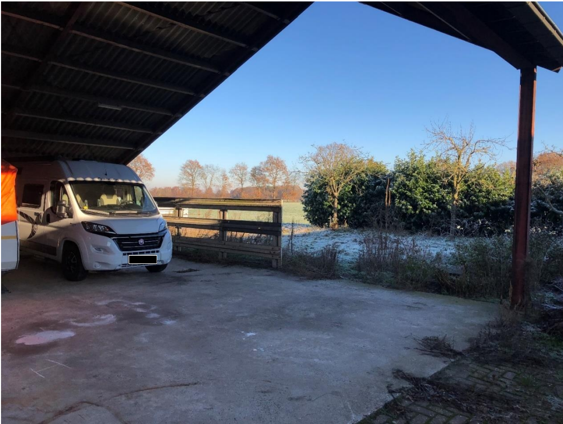
Overkapping naast jongveestal