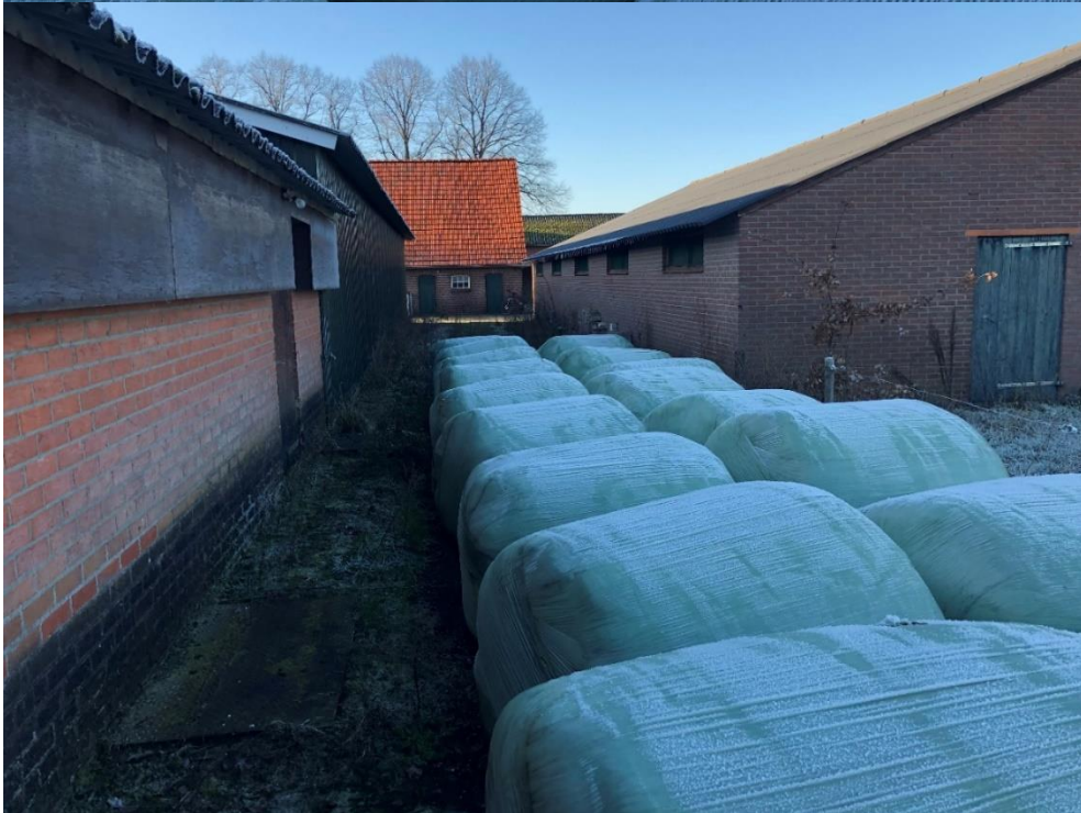
Balenopslag tussen de te slopen bebouwing