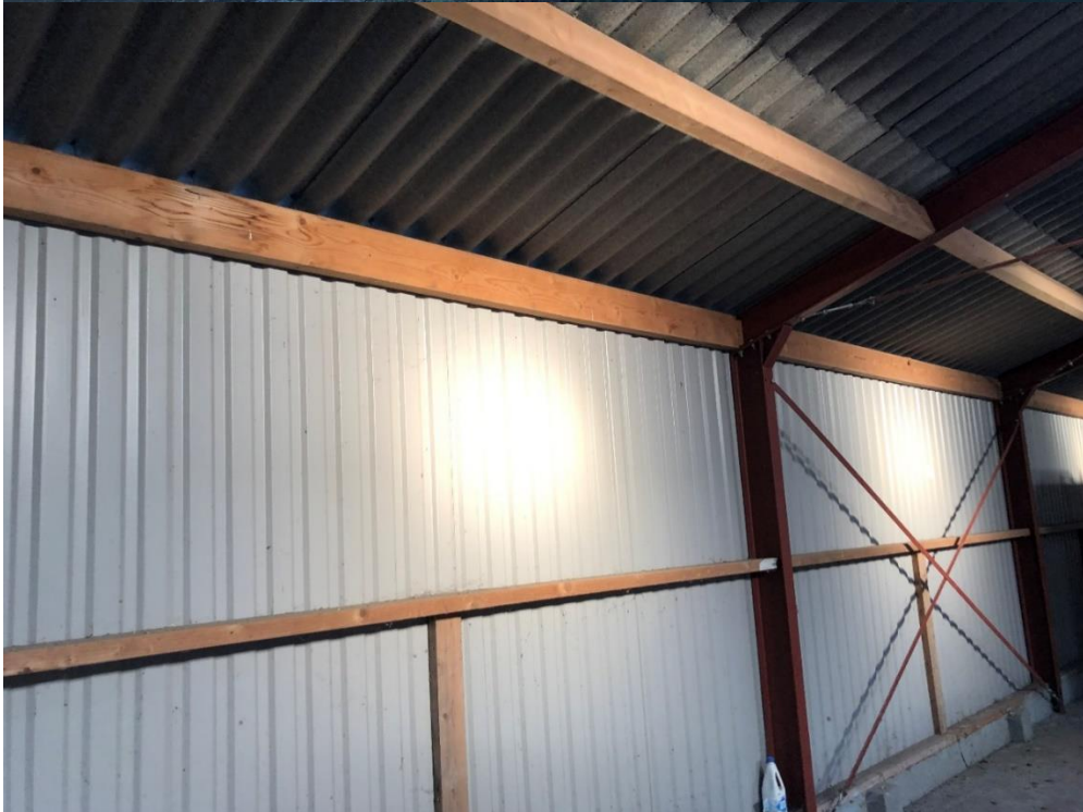
Zijgevel en binnenzijde damwandschuur