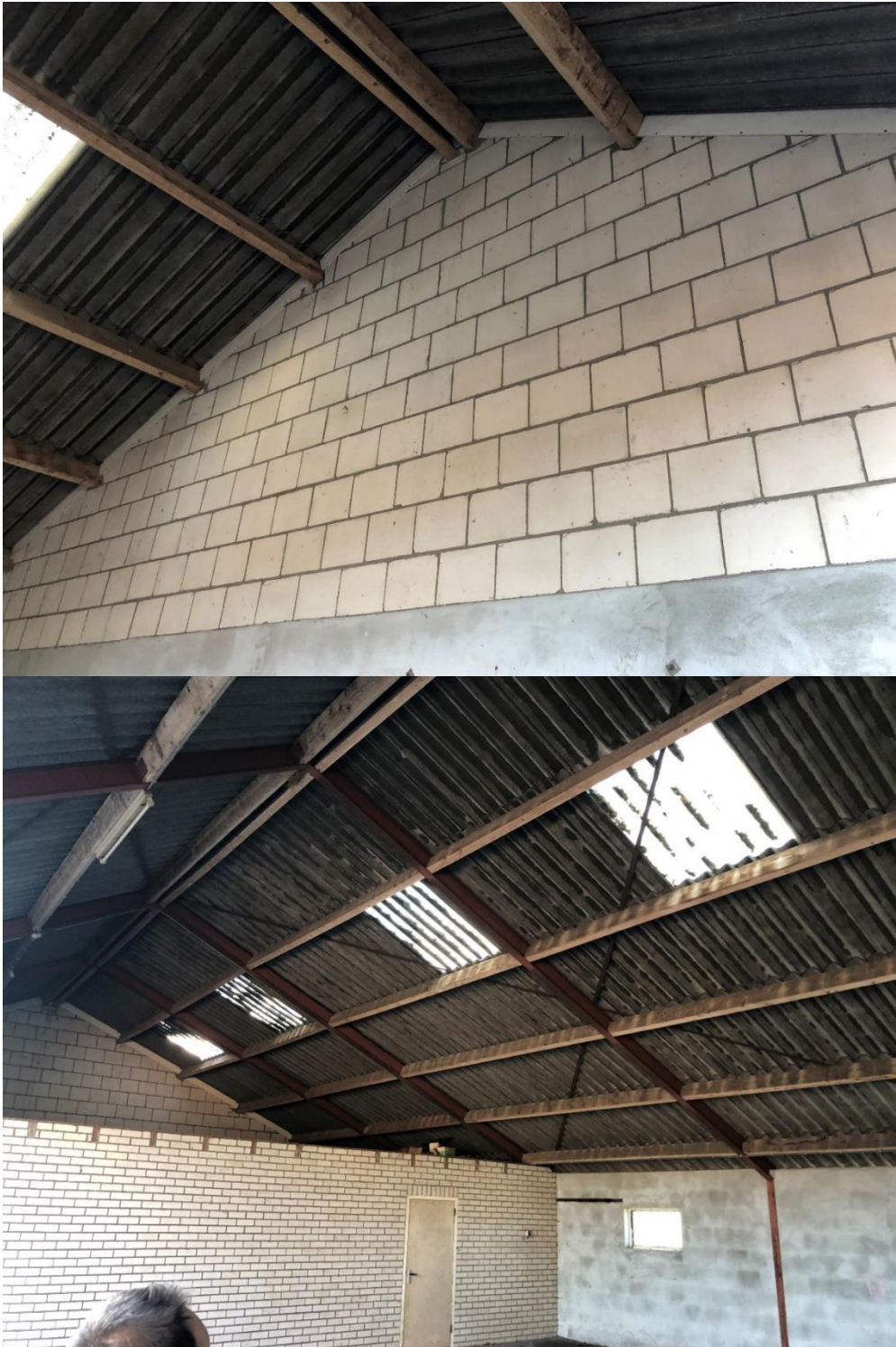
Gevel en binnenzijde kapschuur