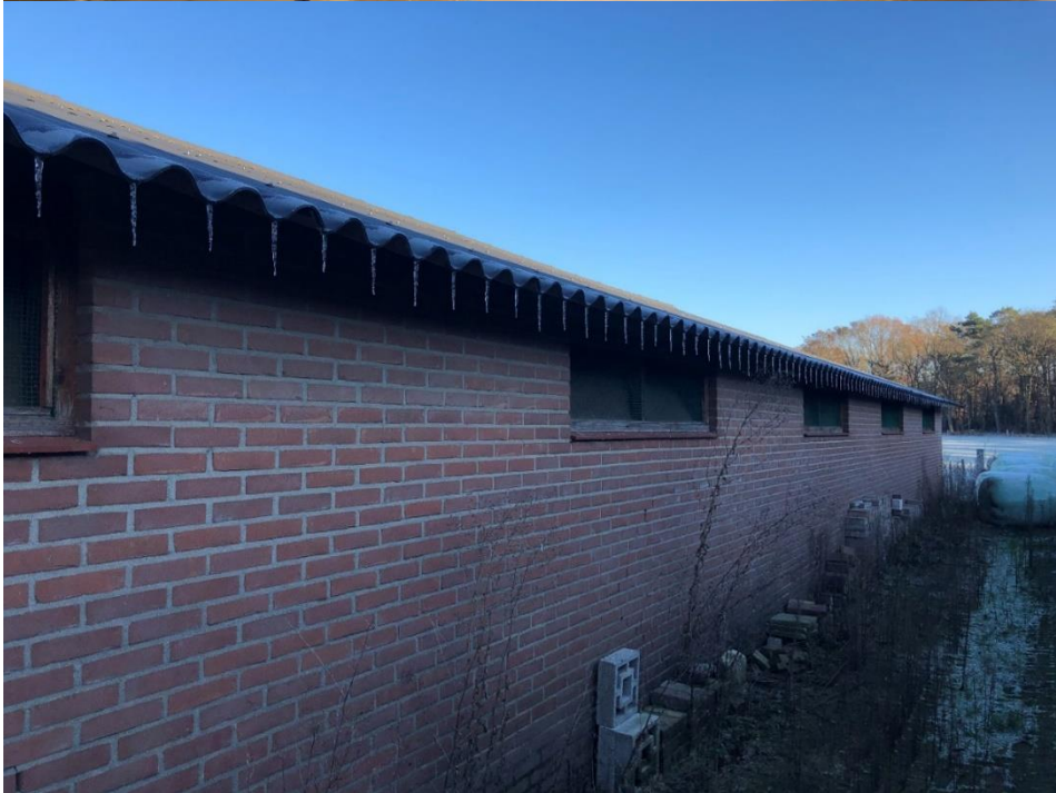
Interieur en zijgevel te slopen schuur