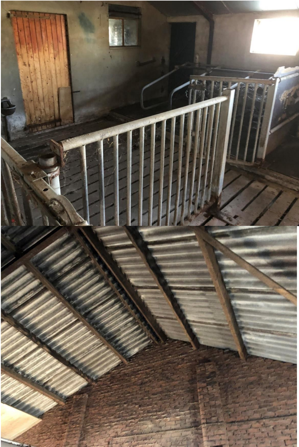
Interieur jongveestal en onderzijde kap jongveestal