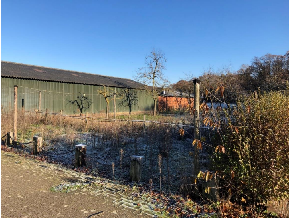
Erf aan straatzijde en appelhof