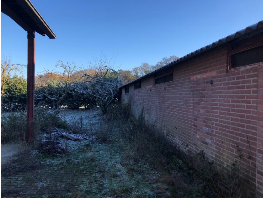
Overkapping en zijgevel schuur