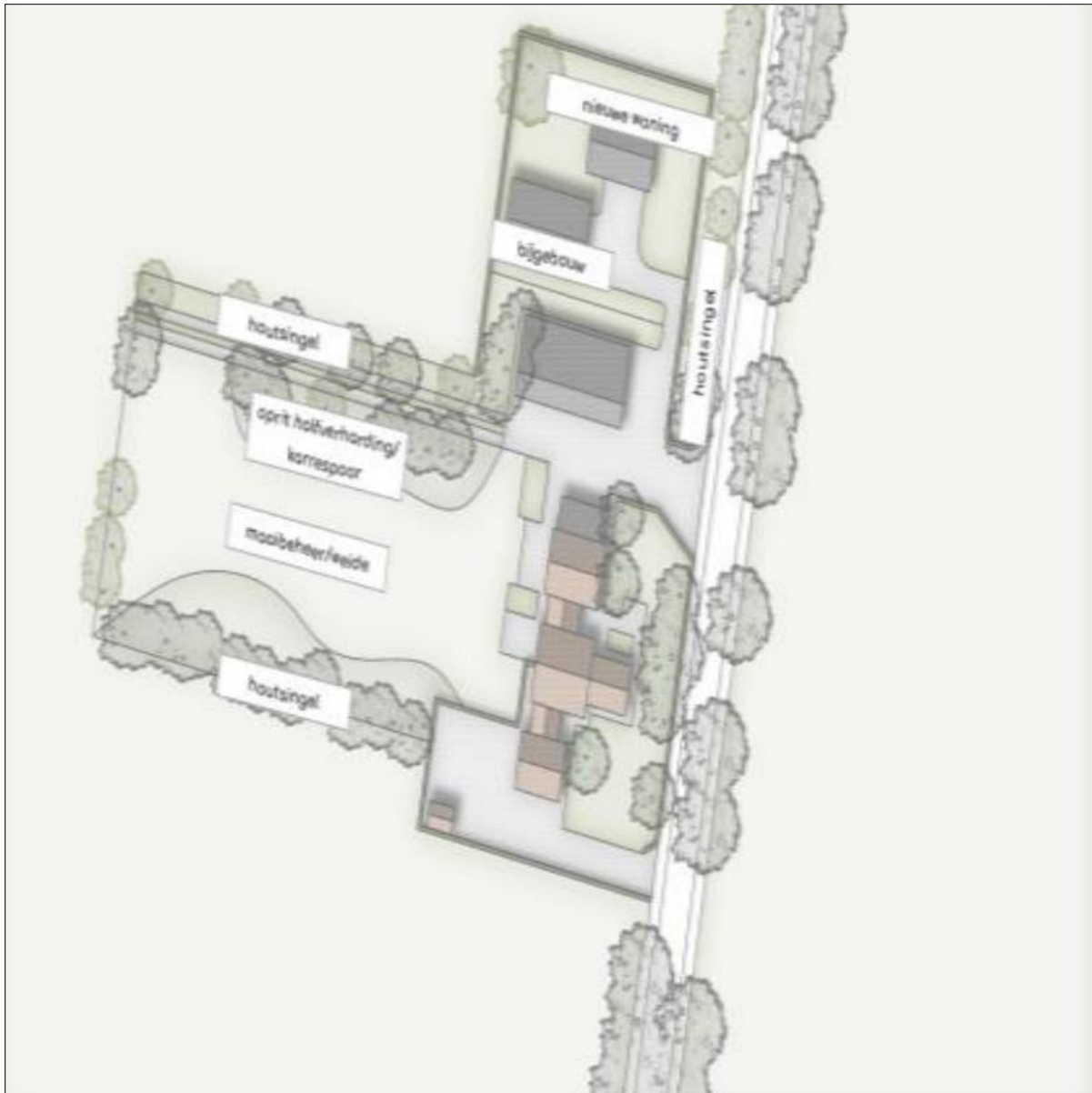
Plattegrond van de beoogde situatie

De volgende activiteiten worden getoetst op relevantie t.a.v. de Wet natuurbescherming: