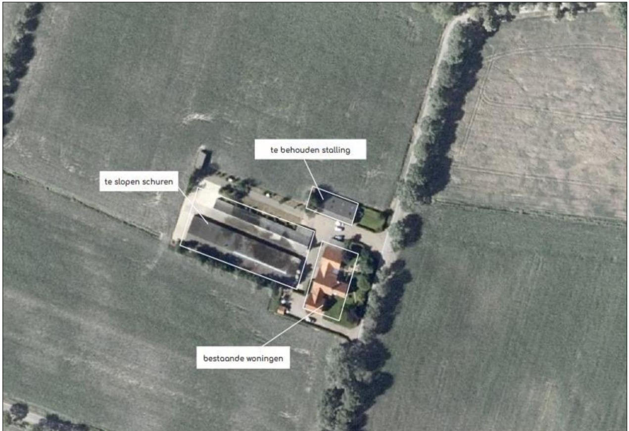
Luchtfoto van de bestaande situatie.

Op de het adres Kortenoerlefsweg 2 in Haaksbergen zijn er plannen om alle agrarische opstallen waaronder twee kippenstallen, erfverharding, voedersilo's en een kapschuur te slopen. Daarnaast wordt een deel van de beplanting rondom de stallen gerooid. De vrijgekomen plek wordt ingericht als weide en de nieuwe woning met bijgebouw wordt op het perceel aan de noordkant van het erf gebouwd.