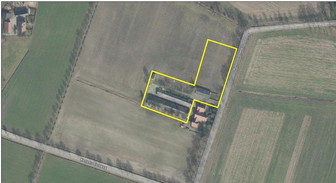
Luchtfoto en begrenzing van het plangebied (gele lijn).

Het plangebied bestaat uit een pluimveehouderij met twee stallen voor legkippen, een werktuigenberging en een houten kapschuur aan de noordwestkant van het erf. De twee pluimveestallen hebben dezelfde bouwstijl met een golfplatendak, muren van baksteen en een zijgevel van damwandplaten en houten betimmering. In de gevels van beide stallen zijn geen openingen aanwezig en de betimmering van het dakoverstekken sluiten nauw aan op de gevels. Rondom de stallen zijn er bomen aangeplant zoals fijnspar, lijsterbes, berk en eik. Het grootste deel vana het erf bestaat uit erfverharding maar met achterste deel van het erf is onverhard en begroeid met pioniersplanten. Achter op de noordwestkant van het erf staat een houten kapschuur met een golfplatendak waarin palets en rioolbuizen zijn opgeslagen.