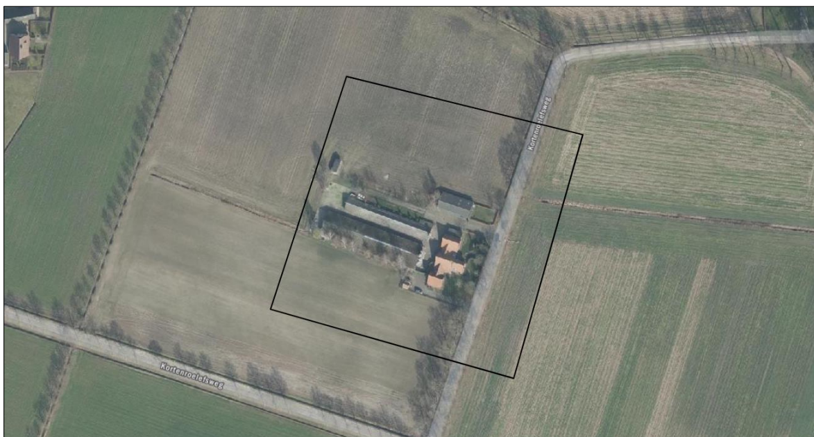
Met de zwarte lijn wordt het zoekgebied weergegeven, er zijn geen waarnemingen in het plangebied.

Op 18 juli 2023 is de NDFF geraadpleegd en is gekeken of waarnemingen van beschermde planten en dieren aanwezig zijn in de databank. In de NDFF zijn geen waarnemingen vastgesteld in de directe omgeving van het plangebied. Op de onderstaande afbeelding staat het zoekgebied in de NDFF weergegeven.