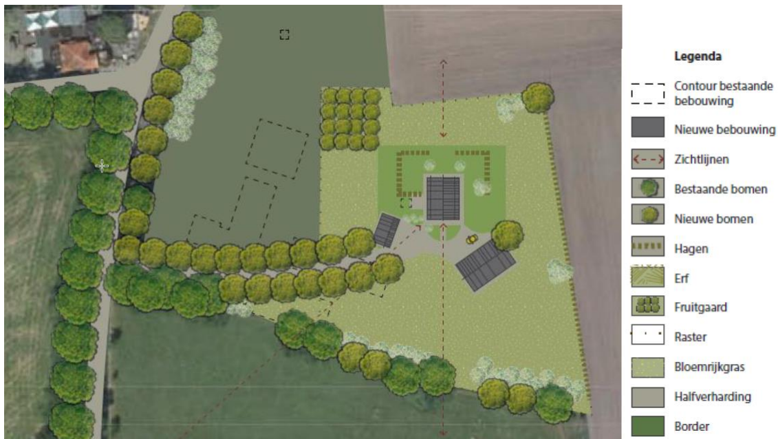
Afbeelding 5: Inrichtingsschets.