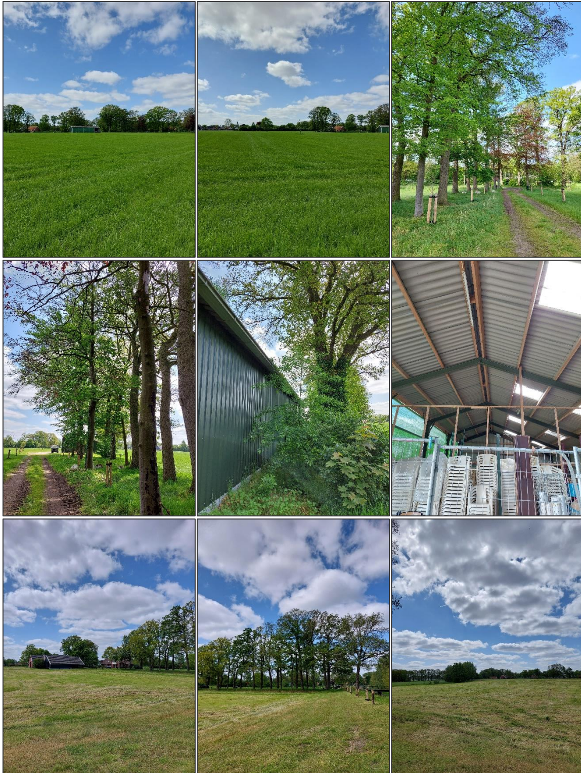
Afbeelding 3. Impressie plangebied, situatie op 17 mei 2023.