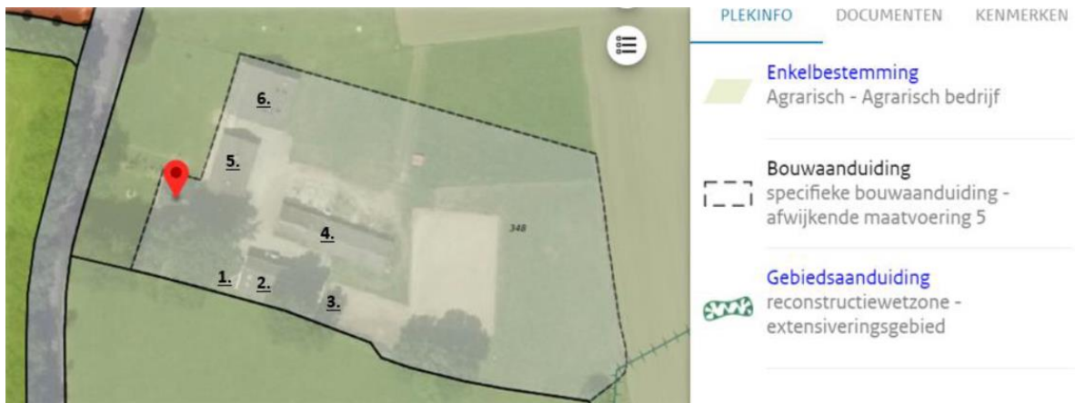
Afbeelding 4. Weergave van de schuren die gesloopt zijn of nog worden.