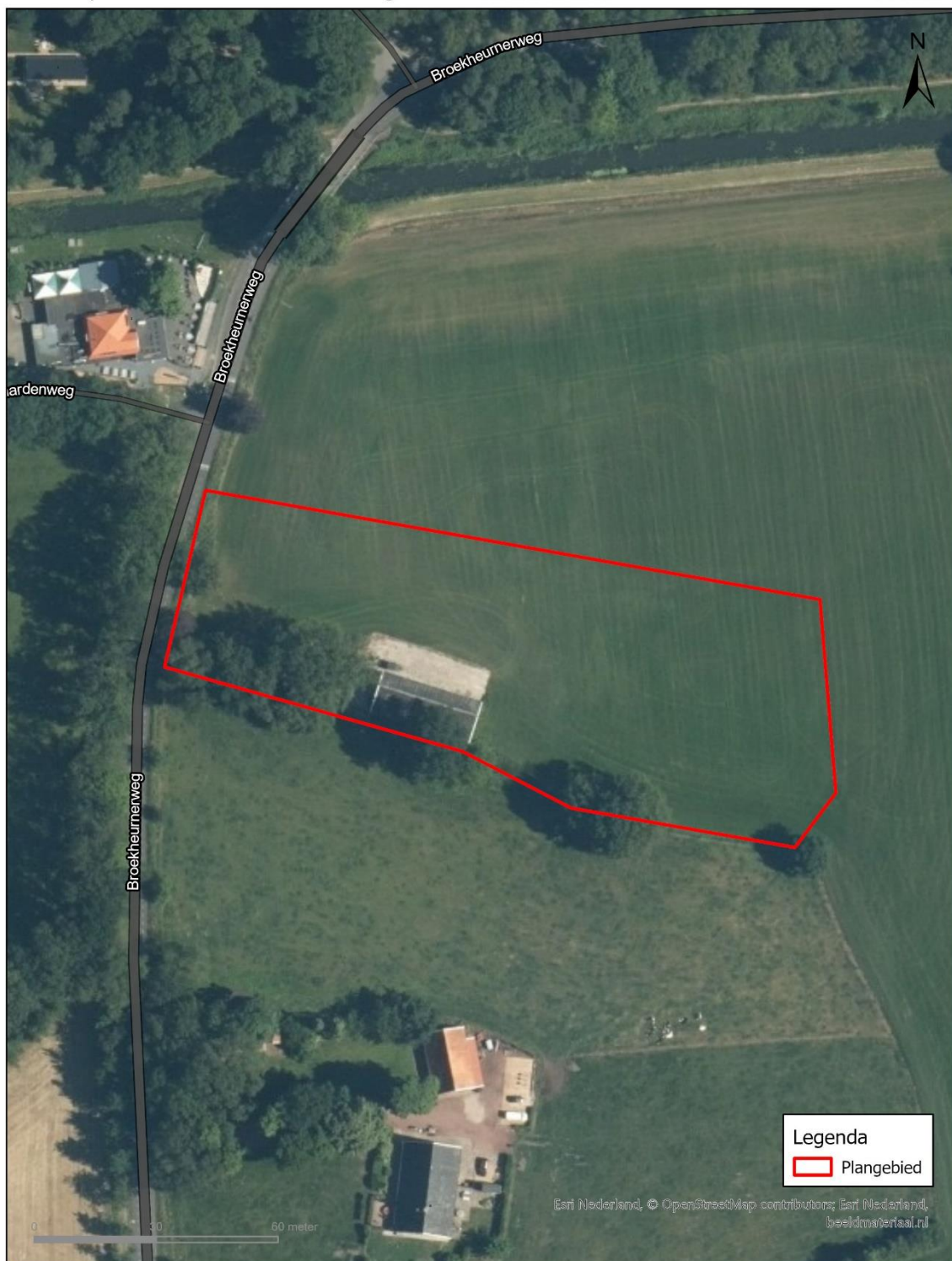
Afbeelding 2. Luchtfoto plangebied (ESRI, 2023).