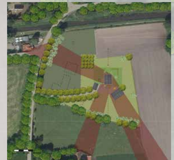
Afbeelding 8. Inrichtingsschets met zichtlijnen die privacy en overlast zouden kunnen veroorzaken geblokkeerd