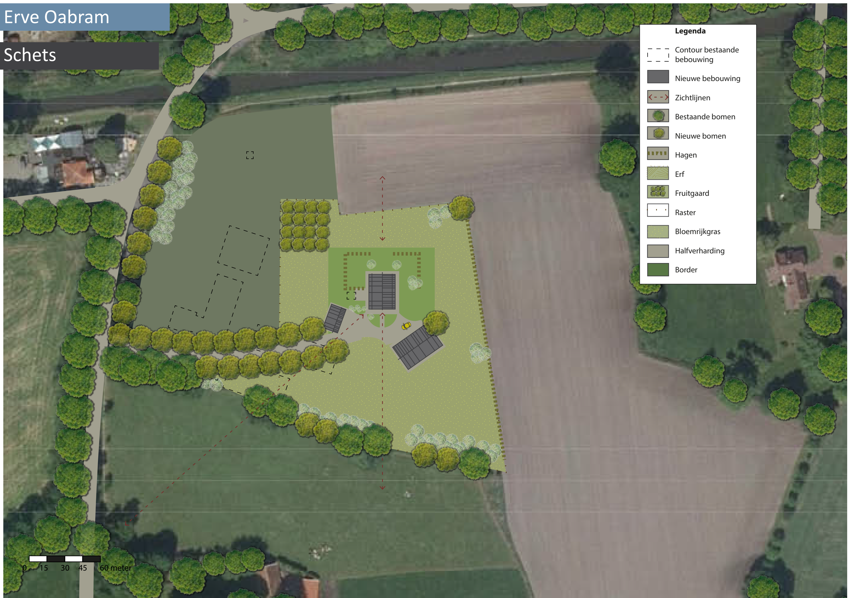
Afbeelding 6. Inrichtingsschets