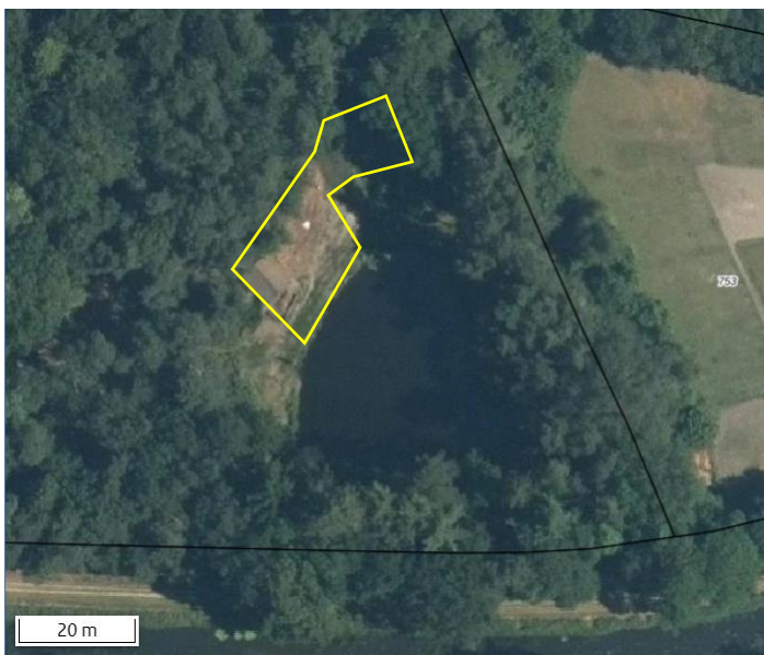
Luchtfoto van het erf.

Het plangebied vormt een deel van een tuin en bestaat uit grasland, tuinplanten en bebouwing. Het grenst aan de noord- en oostzijde aan bos, aan de zuidzijde aan een zwemvijver en aan de westzijde aan grasland. In het plangebied staat een houten recreatiewoning. Dit betreft een eenvoudig houten recreatiewoning met houten gevels (gepotdekseld) en een bitumen dak. De staat van onderhoud van het schuurtje is goed; het is wind- en waterdicht. Het grasland bestaat grotendeels uit een intensief gemaaid gazon met 'speelgras'. Ten oosten van de recreatiewoning staan wat sierplanten in een border. Voor een verbeelding van de huidige situatie wordt verwezen naar de fotobijlage.