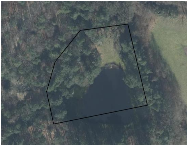
Zoekgebied waarbinnen gezocht is naar flora- en faunawaarnemingen in de NDFF.

Op 14 mei is de NDFF geraadpleegd en is gekeken of waarnemingen van beschermde planten en dieren aanwezig zijn in de databank (periode 2018-2023). In de NDFF zijn geen flora- of faunawaarnemingen opgenomen welke betrekking hebben op het plangebied. Hieronder wordt het zoekgebied weergegeven waarbinnen de NDFF is geraadpleegd.