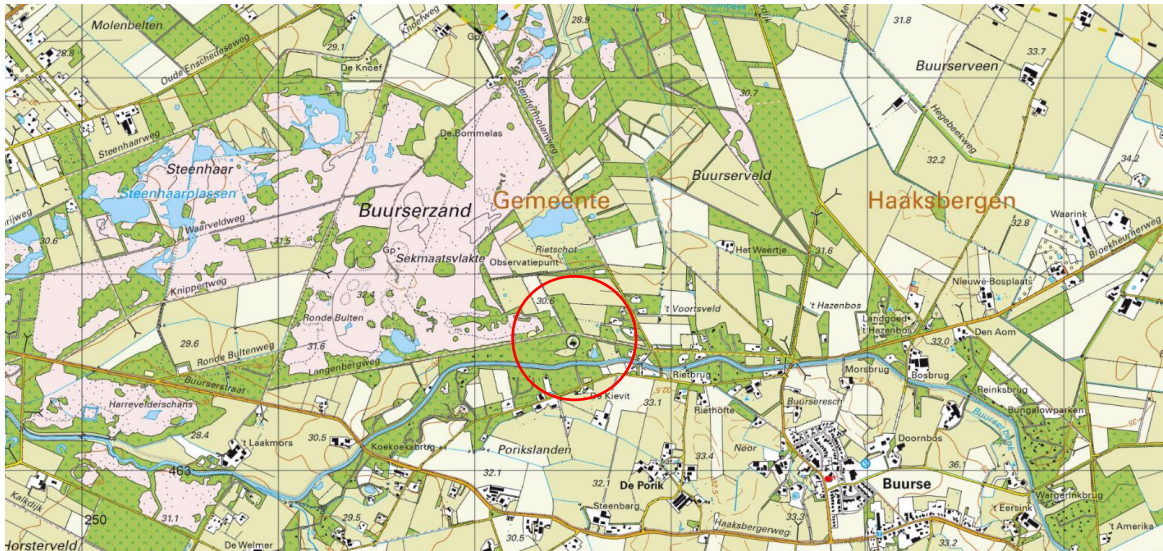
Ligging van het plangebied op de topografische kaart. Het plangebied wordt aangeduid met de cirkel.

Het plangebied is gesitueerd aan de Langenbergweg 6 te Haaksbergen. Het ligt in het buitengebied en wordt omgeven door landelijk gebied. Op onderstaande topografische kaart wordt de ligging van het plangebied weergegeven.