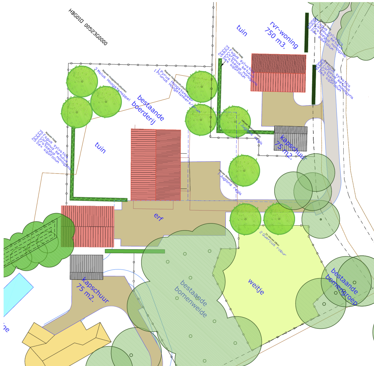
Het huidige Rood voor Rood-plan

Door de nieuwe kavel op de plek van de huidige opslag te plaatsen (naar de bosrand), ontstaat er meer ruimte voor landschappelijke elementen en sterkere groenstructuren. Daarnaast blijft er zicht op het achterliggende landschap bestaan. De nieuwe woning komt in het huidige plan beschutter te liggen, voor de bosrand. Hierdoor ligt er minder aandacht op de nieuwe woning, en blijft de karakteristieke boerderij het punt van aandacht.