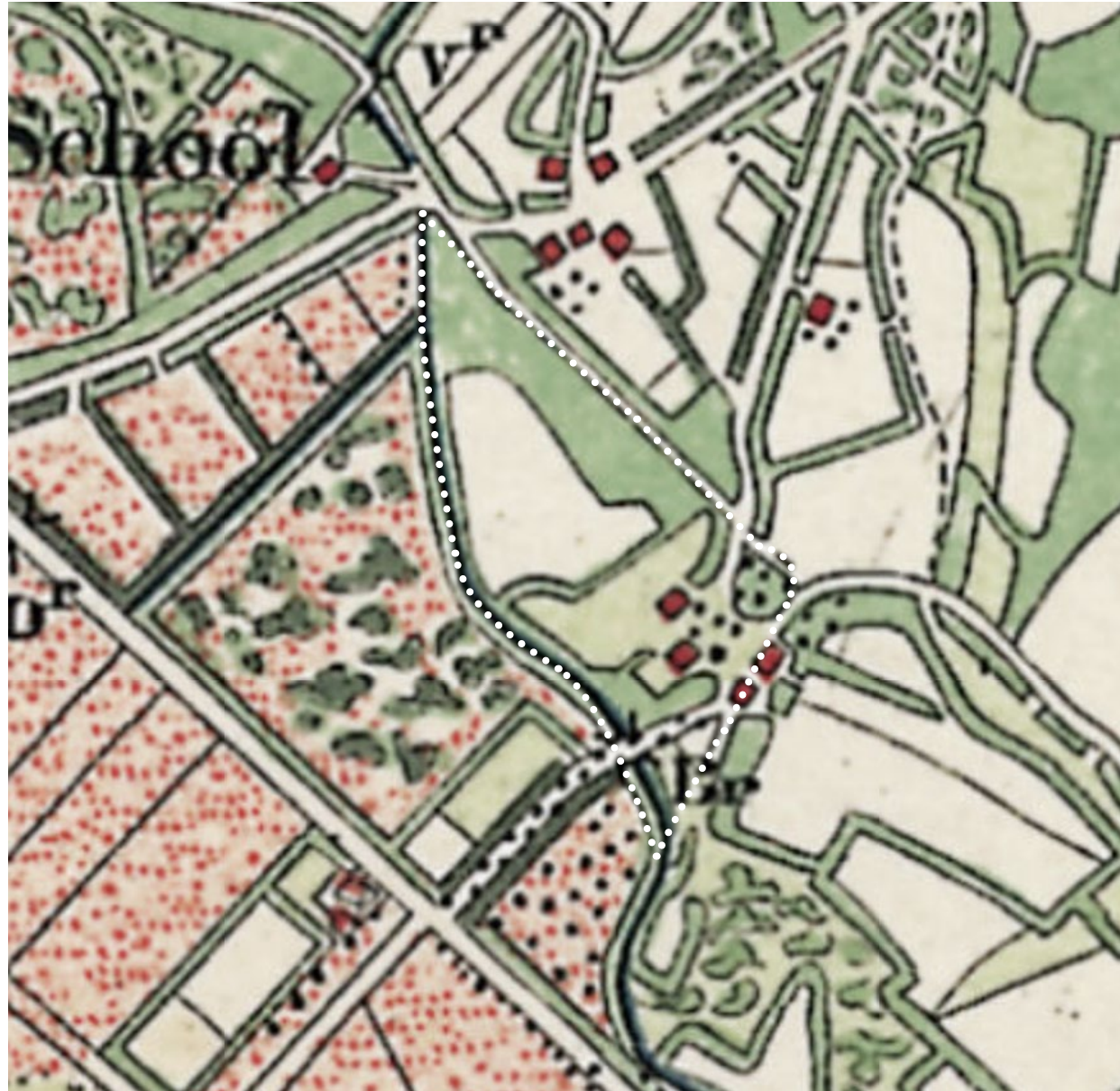
Historische kaart omstreeks 1900

Op de historische kaart is te zien hoe aan de rand van het heide gebied een eenmans lag; een open veld met rondom groenstructuren en de bijbehorende boerderij(en). Het terugbrengen, behouden en versterken van de kleinschaligheid en groenstructuren is een belangrijk uitgangspunt bij de nieuwe ontwikkeling, waarbij het historische landschap als uitgangspunt dient.