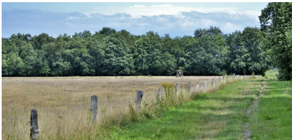
Impressies van kleinschalige landschappen met sterke groenstructuren en open velden.