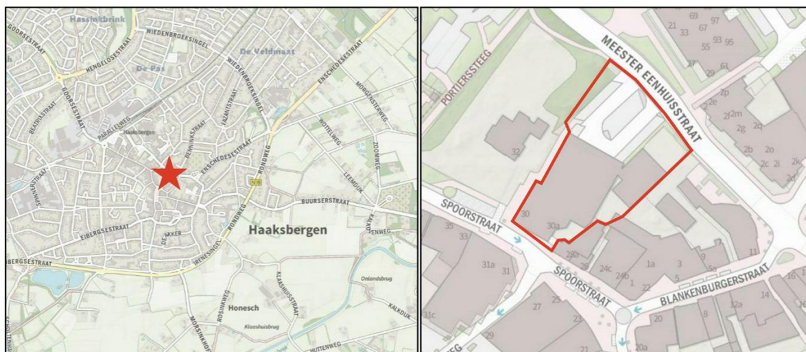
Afbeelding 1.1 Ligging van het plangebied ten opzichte van de kern Haaksbergen

Het plangebied ligt aan de Spoorstraat 30-32 in het centrum van Haaksbergen. In afbeelding 1.1 is de ligging van het plangebied ten opzichte van Haaksbergen en de directe omgeving weergegeven.