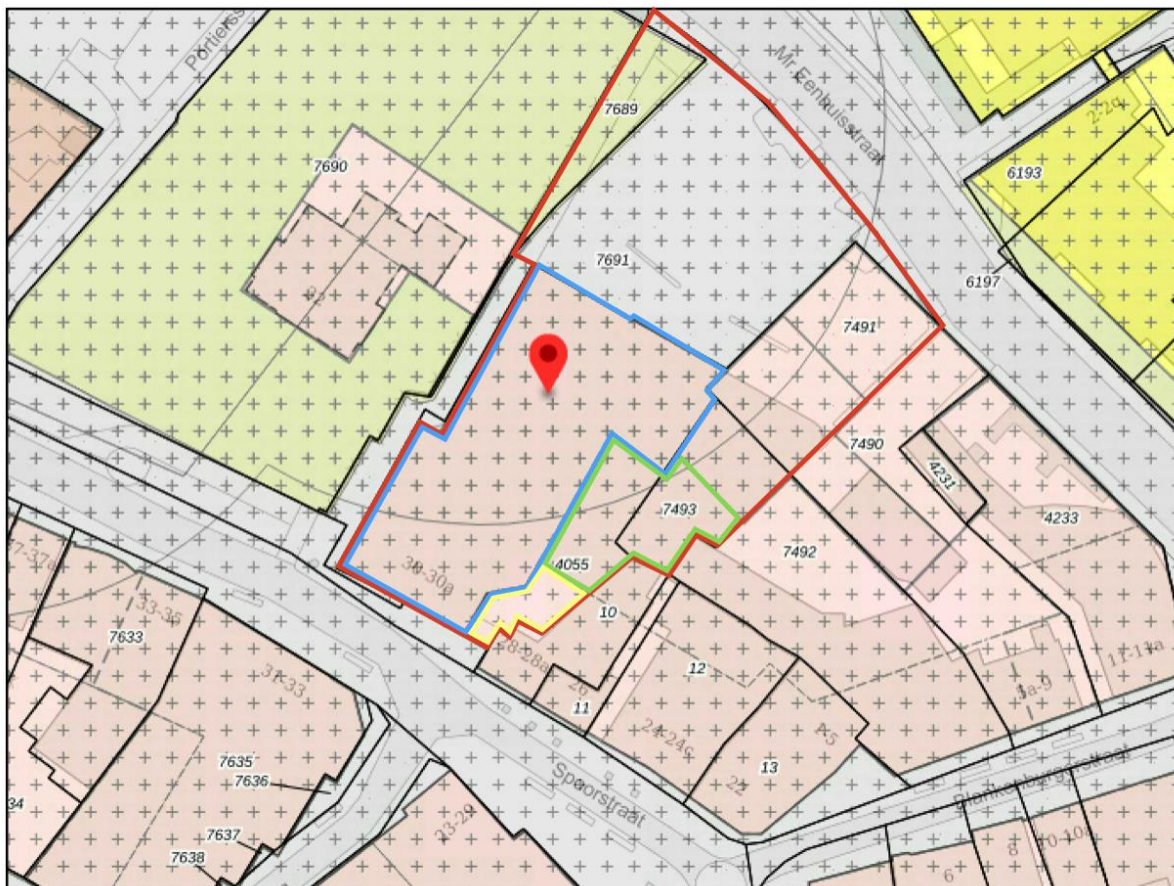
Afbeelding 1.2 Uitsneden vigerende bestemmingsplan

Het plangebied is gelegen binnen de begrenzing van bestemmingsplan "Centrum Haaksbergen". Dit bestemmingsplan is op 3 juni 2013 vastgesteld door de gemeenteraad van Haaksbergen. In afbeelding 1.2 is een uitsnede van de verbeelding van dit bestemmingsplan opgenomen, waarin het plangebied indicatief met rode lijn is weergegeven.