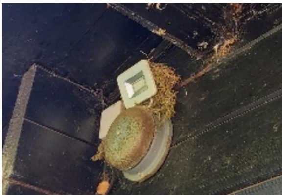
Bezet nest van grauwe vliegenvangers op een lamp aan de buitenzijde van de recreatiewoning.

Het plangebied behoort tot functioneel leefgebied van verschillende vogelsoorten. Vogels benutten het plangebied als foerageergebied en mogelijk nestelen er jaarlijks vogels in het plangebied. Vogels kunnen een nestlocatie bezetten in bomen, nestkasten in en toegankelijke gebouwen zoals de schuur. Er is tijdens het veldbezoek een bezet nest van grauwe vliegenvangers waargenomen. Andere vogels die mogelijk in het plangebied nestelen zijn gekraagde roodstaart, roodborst, winterkoning, witte kwikstaart, houtduif, merel, zwartkop, tjiftjaf, koolmees, pimpelmees, grote bonte specht, boomkruiper en vink. Het plangebied vormt een ongeschikte habitat voor huismussen. Er zijn tijdens het bezoek geen oude of potentiële nesten van roofvogels of uilen in de bebouwing of in beplanting in de directe omgeving van het plangebied waargenomen. Deze nesten zijn doorgaans gemakkelijk te vinden aan de hand van schijtsporen en braakballen.