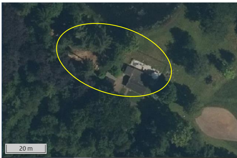
Luchtfoto van het plangebied; deze wordt met de gele ovaal aangeduid.

Het plangebied vormt een deel van een landgoed en bestaat uit bebouwing, erfverharding en tuin met gazon en enkele bomen. In het plangebied staan een vakantiewoning, schuur met aanbouw, container en houten schuurtje. De vakantiewoning beschikt over houten wanden en is gedekt met bitumen dakleer. Ook het houten schuurtje beschikt over houten wanden en is gedekt met zinken dakplaten. Het schuurtje beschikt niet over geïsoleerde wanden of dak. Ten westen van de vakantiewoning staat een houten schuur met aanbouw. Deze schuur heeft gepotdekselde houten wanden zonder wandisolatie en is gedekt met damwandplaten. Aan deze schuur is een overkapping gebouwd. Op onderstaande afbeelding wordt de begrenzing van het plangebied weergegeven. Voor een verbeelding van de huidige situatie wordt verwezen naar de fotobijlage.