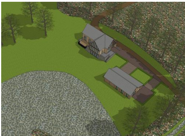
3-D impressie van het wenselijke eindbeeld.

De volgende activiteiten worden getoetst op relevantie t.a.v. de Wet natuurbescherming: