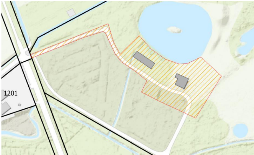
Voorstel voor onttrekking van NNN (op basis van ambtelijk overleg met de provincie).