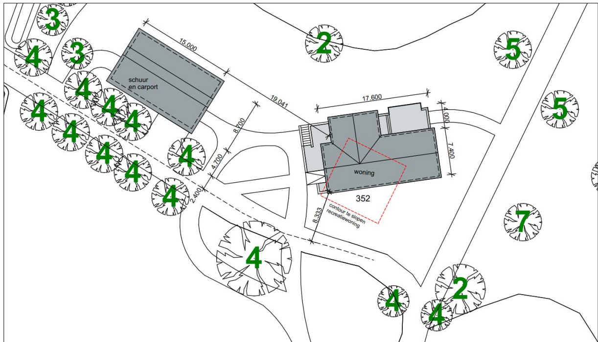
Plattegrond van het wenselijke eindbeeld.

Het voornemen bestaat een nieuwe woning en schuur te bouwen. Om dit mogelijk te maken dienen de aanwezige gebouwen in het plangebied geamoveerd te worden en dienen enkele bomen gerood te worden. Op onderstaande afbeelding wordt een plattegrond van het wenselijke eindbeeld weergegeven.