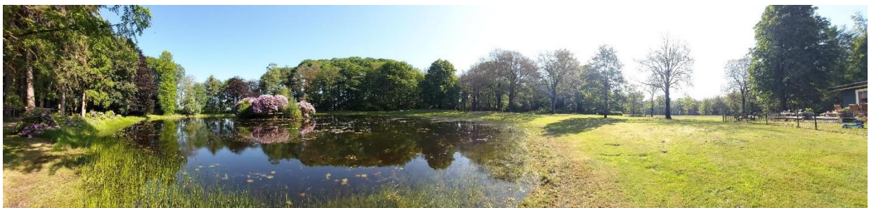
De poel vormt een geschikt voortplantingsbiotoop voor amfibieën. Rechts is de te slopen recreatiewoning zichtbaar.

Amfibieën die de vijver benutten als voortplantingslocatie, overwinteren hoofdzakelijk op landbiotoop, zoals in toegankelijke gebouwen en onder rommel en opgeslagen spullen, zoals aanwezig in het plangebied.