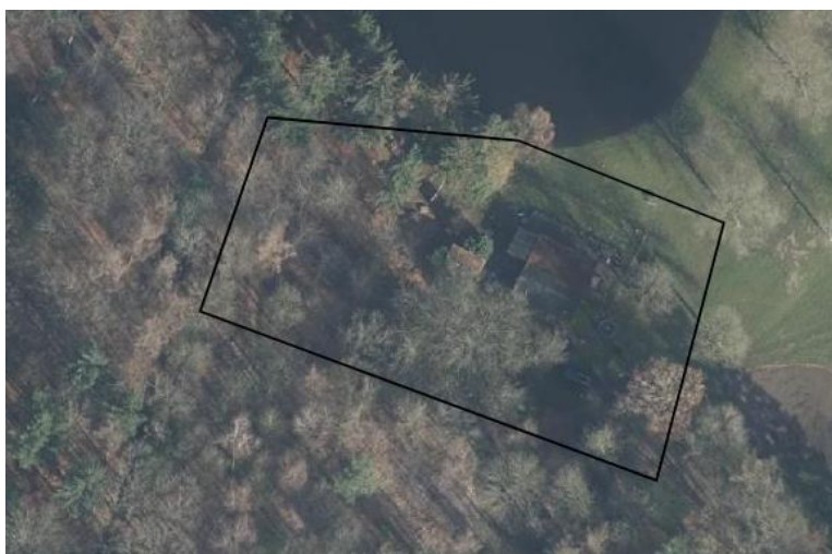
Verspreiding van alle bekende records (groene stip) in het plangebied.

Op 5 juni 2023 is de NDFF geraadpleegd en is gekeken of waarnemingen van beschermde planten en dieren aanwezig zijn in de databank in de periode 2018-2023. Er zijn in de NDFF geen flora- of faunawaarnemingen opgenomen die betrekking hebben op het plangebied en de directe omgeving. Op onderstaande luchtfoto wordt het zoekgebied, waarbinnen gekeken is naar waarnemingen, weergegeven.