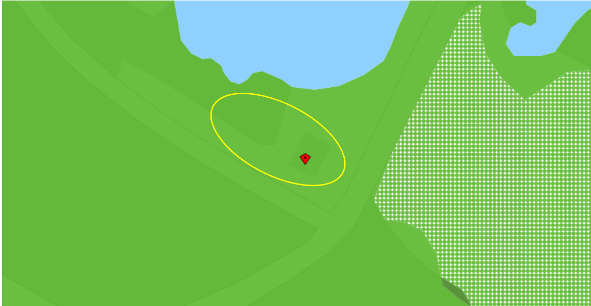
Ligging van Natuurnetwerk Nederland in de omgeving van het plangebied. De ligging van het plangebied wordt met de gele ovaal aangeduid. Gronden die tot Natuurnetwerk Nederland behoren worden met de groene kleur en de blauwe kleur op de kaart aangeduid.