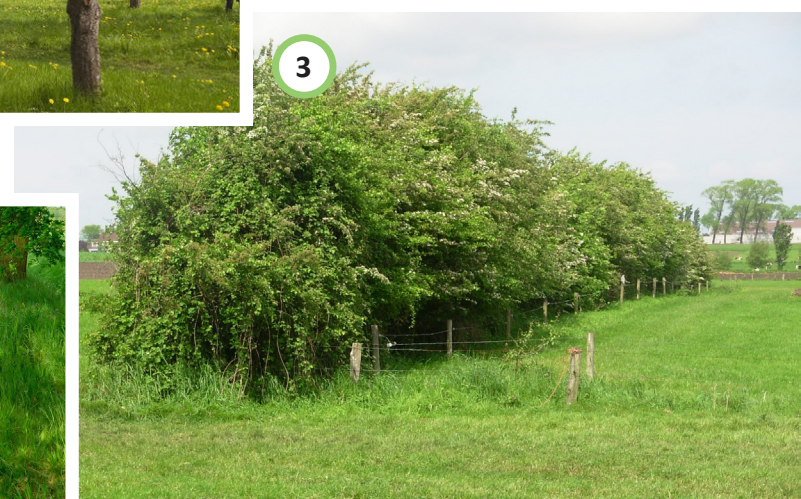
Landschappelijke haag zorgt voor afscherming pompstation.