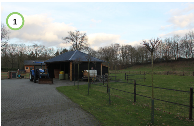
Bestaande erf met schuur handhaven.