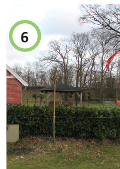
Bestaand prieeltje verwijderen.