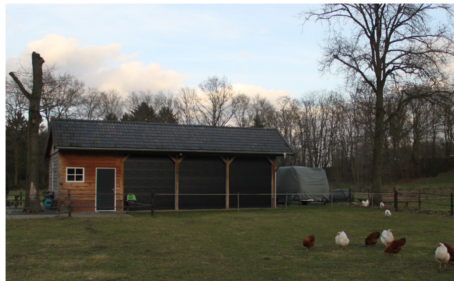
Afbeelding 3. Te behouden schuur met B&B.

De gemeente heeft als eis gesteld dat de zuidelijke schuur, evenals het prieeltje in de tuin, gesloopt dienen te worden. Hierdoor komen we op een totaal aantal van 160 m2 te slopen bijgebouwen. Naast de te slopen bebouwing wordt het verharde oppervlak ook aanzienlijk verminderd. De oprit naar de B&B wordt verwijderd en daarnaast zal ook een deel van de bestating bij de te slopen schuur verwijderd worden.