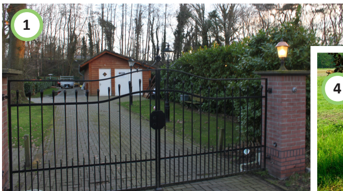
Bestaande inrit handhaven. Verharding bij af te breken schuur verwijderen.