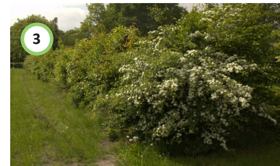
Landschappelijke haag met inheemse soorten.