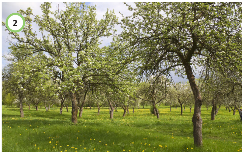
Hoogstam fruitboomgaard als verbindend element tussen erf en schuur.