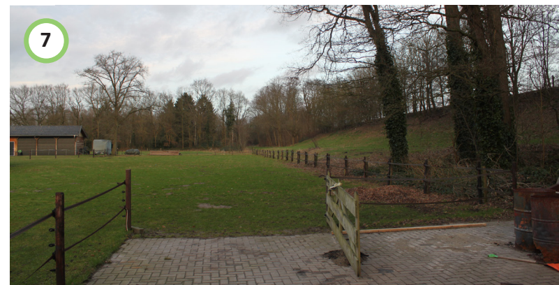
Bestaande weide behouden voor hobbymatig gebruik.