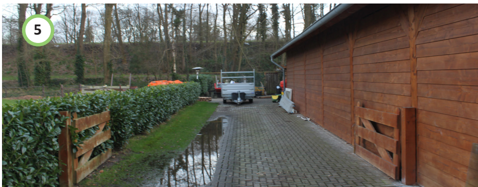
Bestaande schuur met bestrating verwijderen.