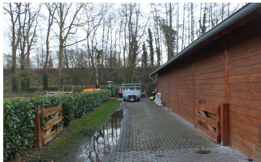
Afbeelding 4. Te slooplocatie langs de zuidoostelijke kavelgrens.