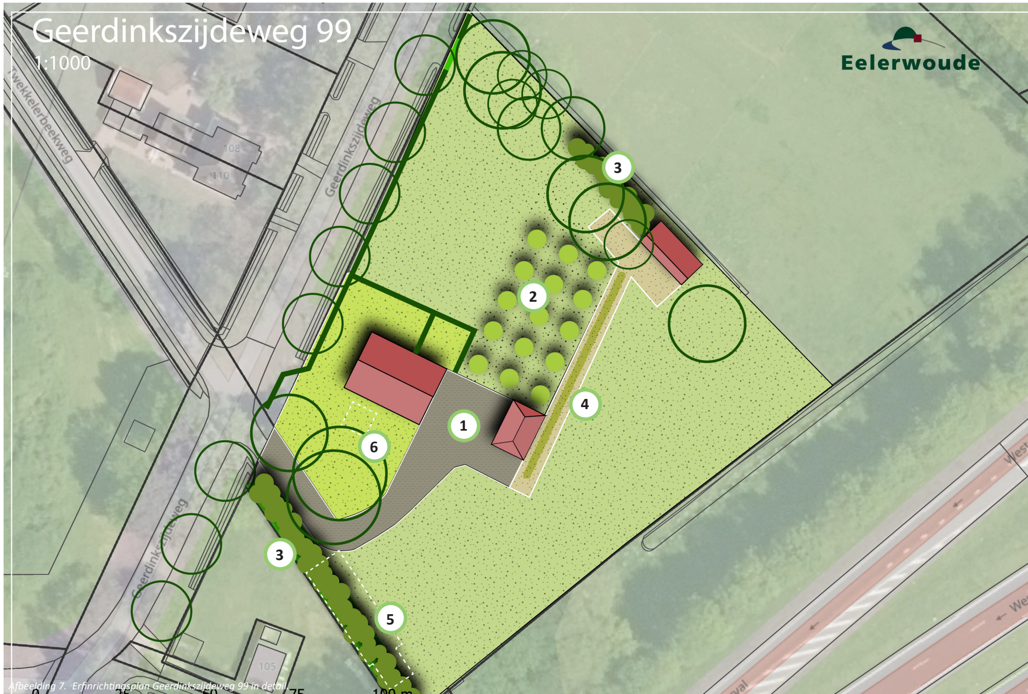
Afbeelding 7. Erfinrichtingsplan Geerdinkszijdeweg 99 in detail.