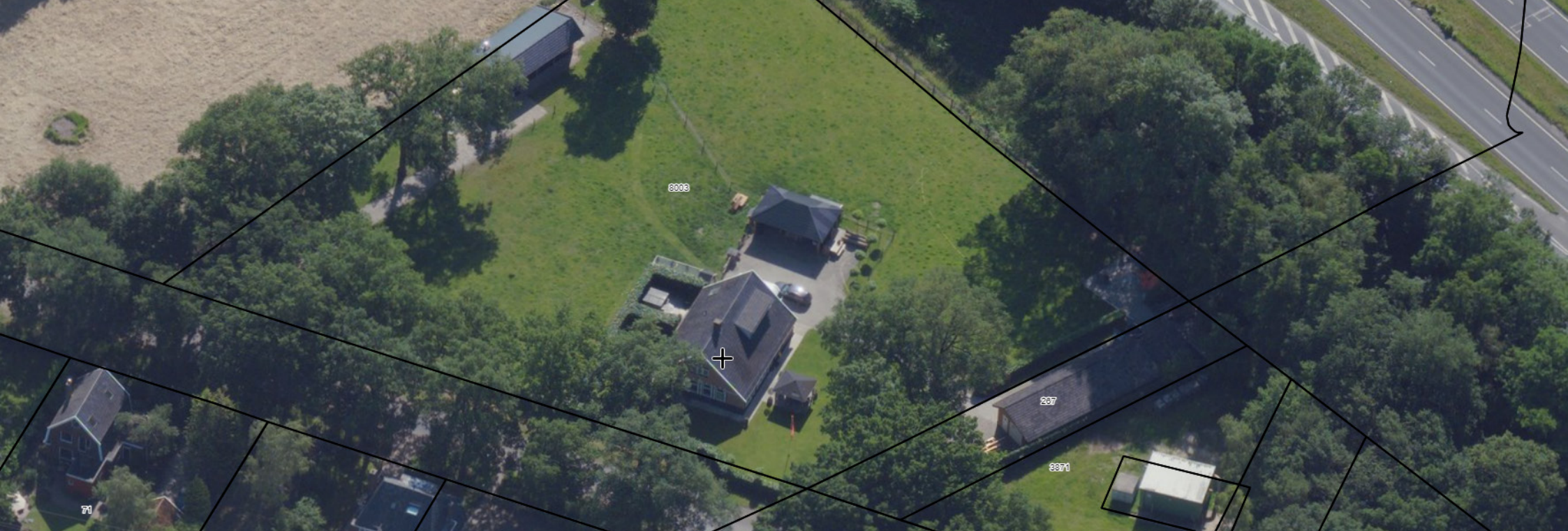
Afbeelding 6. Vogelvlichtbeeld van het erf aan de Geerdinkszijdeweg 99.