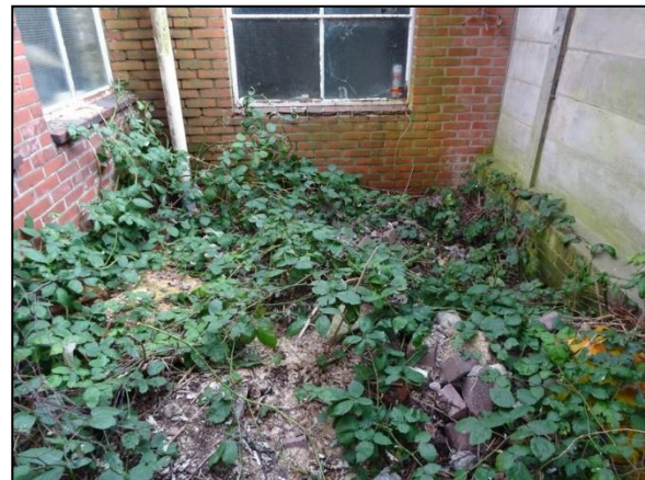
Figuur 21. Ondergroei tussen bedrijfspand en schuur.

Enkele stukken begroeiing op de onderzoekslocatie vormt geschikt habitat voor een aantal soorten grondgebonden zoogdieren (figuur 5, 6 en 15). Het gaat daarbij om algemene soorten zoals de rosse woelmuis. Door de voorgenomen werkzaamheden bestaat de kans dat dieren verwond of gedood worden (zie hoofdstuk 6).