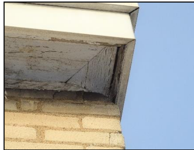
Figuur 19. Ruimte tussen dakrand en gevel zuidzijde bedrijfspand.