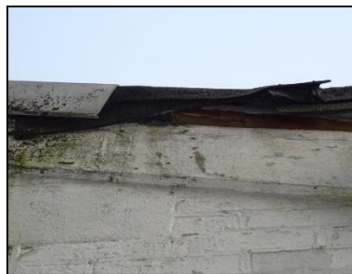
Figuur 16. Opening onder dakrand westzijde bedrijfspand.