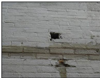
Figuur 15. Opening in muur westzijde bedrijfspand.