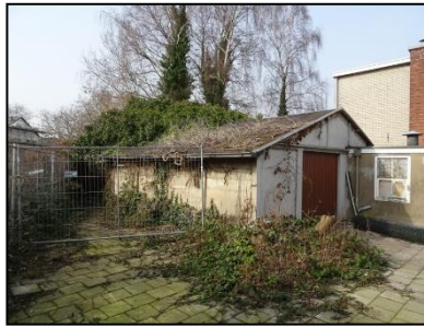
Figuur 6. Overwoekerde schuur ten zuiden van bedrijfspand.