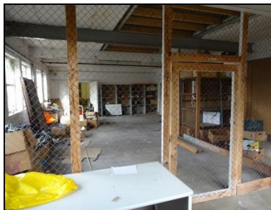
Figuur 10. Opslagruimte op de begane grond.