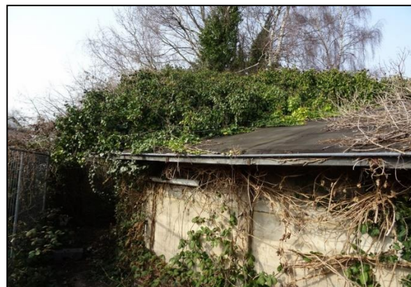
Figuur 14. Overwoekerde schuur.