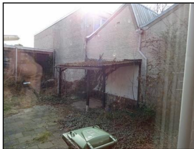
Figuur 9. Oostzijde onderzoekslocatie.