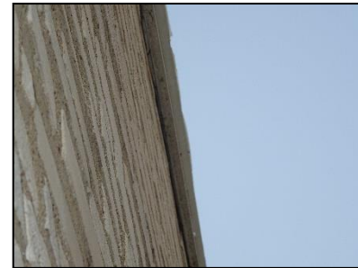
Figuur 20. Ruimtes tussen windveer en gevel oostzijde bedrijfspand.