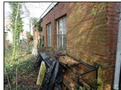
Figuur 5. Rommelhoek aan de westzijde van de onderzoekslocatie, kijkend in noordelijke richting. Links de tuin van de naastgelegen woning.