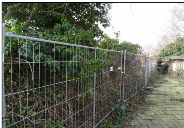
Figuur 13. Groenstrook ten zuiden van de onderzoekslocatie.

De beplanting op de onderzoekslocatie kan nestgelegenheid bieden aan broedvogelsoorten zoals merel, roodborst en winterkoning. Aan de zuidzijde van de onderzoekslocatie langs het fietspad is een groenstrook die geschikt kan zijn als nestlocatie voor algemene broedvogels (figuur 13). De verschillende struiken en beplanting op en rond de schuur zijn eveneens geschikt (figuur 14). De nesten van deze soorten zijn alleen beschermd op het moment dat ze als zodanig in gebruik zijn. Overtredingen van verbodsbepalingen uit de Wet natuurbescherming zijn te voorkomen (zie hoofdstuk 6).