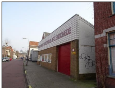
Figuur 3. Hoofdingang van het bedrijfspand aan de noordzijde van de onderzoekslocatie.