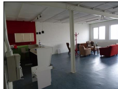
Figuur 11. Voormalig leslokaal in bedrijfspand.