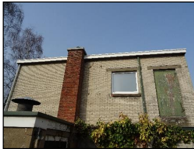
Figuur 18. Zuidelijk deel eerste verdieping bedrijfspand.