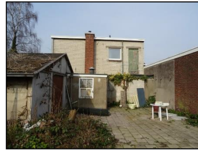
Figuur 8. Bedrijfspand en schuren, kijkend in noordelijke richting.