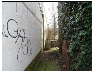
Figuur 4. Steeg naar tuin aan de westzijde van de onderzoekslocatie.