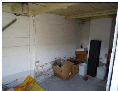
Figuur 12. Binnenkant schuur.