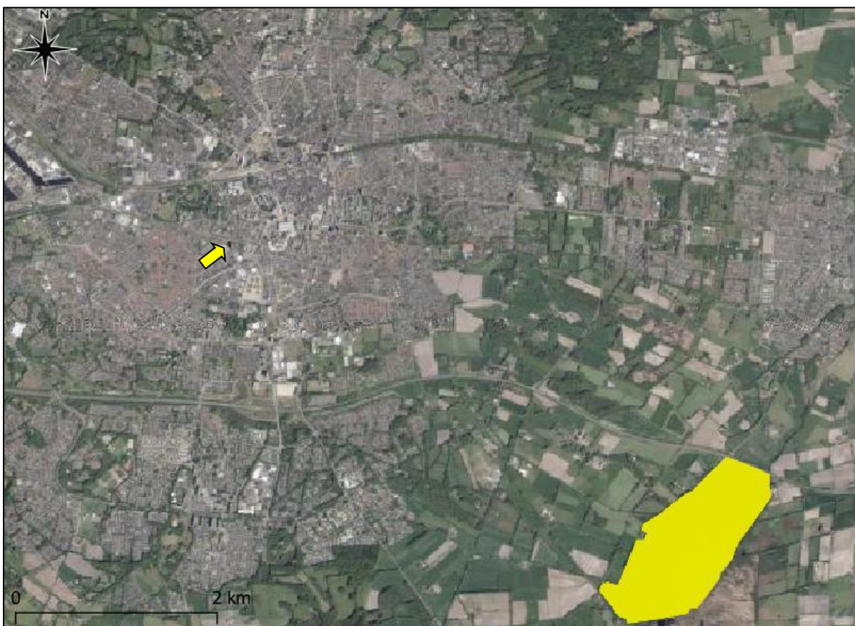
Figuur 22. Ligging onderzoekslocatie ten opzichte van Natura 2000.

De onderzoekslocatie is niet gelegen binnen de grenzen, of in de directe nabijheid van een gebied dat aangewezen is als Natura 2000. Het meest nabijgelegen Natura 2000-gebied, Aamsveen, bevindt zich op circa 5 kilometer afstand ten noordoosten van de onderzoekslocatie (zie figuur 22).