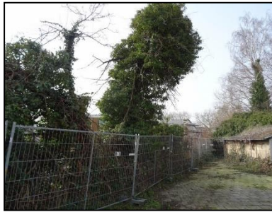
Figuur 7. Groenstrook ten zuiden van de onderzoekslocatie.