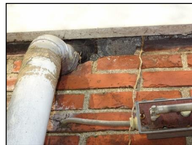
Figuur 17. Opening onder dakrand zuidzijde bedrijfspand.