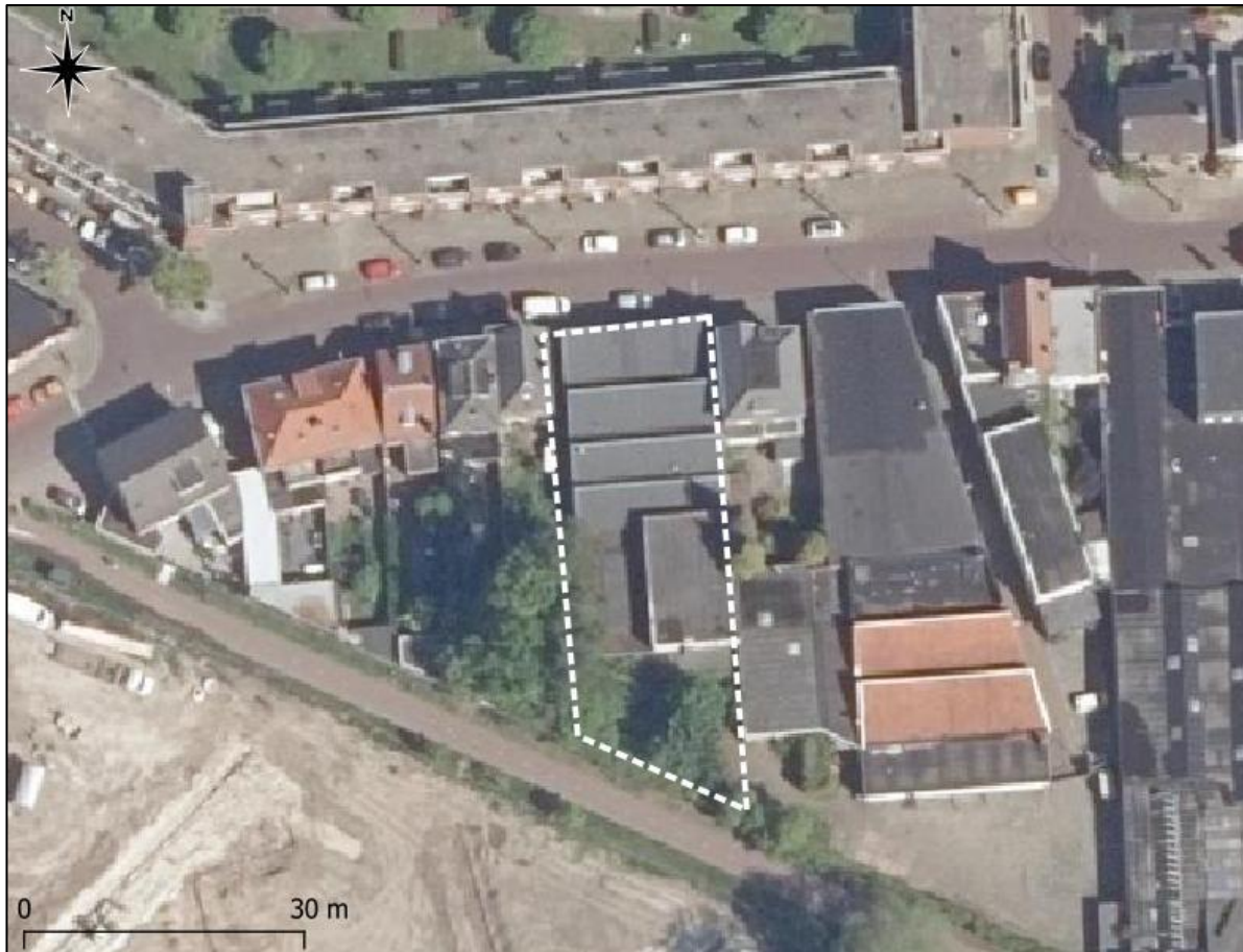
Figuur 2. Luchtfoto onderzoekslocatie en directe omgeving.

In figuur 2 is een luchtfoto van de onderzoekslocatie en de directe omgeving weergegeven. De figuren 3 t/m 11 geven een impressie van de onderzoekslocatie, middels foto's die zijn genomen tijdens het veldbezoek.