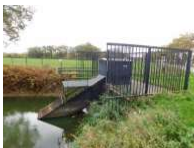
Figuur 2.4 Het gemaal in de zuidwest hoek van de visvijver.