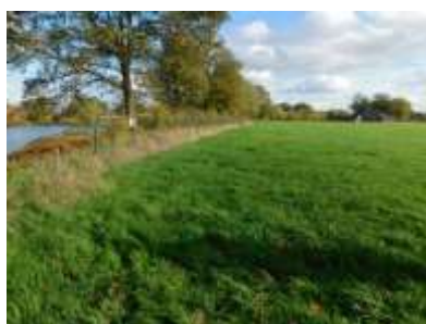
Figuur 2.3 Het begraasde weiland met het vervallen hek en houtwal aan de noordzijde van de onderzoekslocatie.