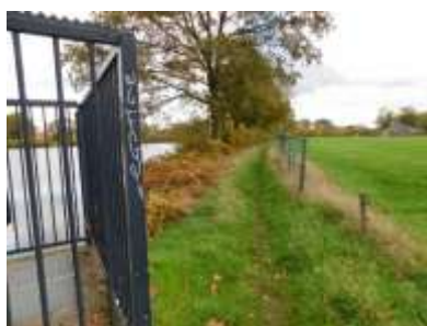
Figuur 2.7 Het wandelpad tussen de houtwal en het vervallen hek.