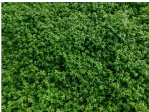
Figuur 5.3 Het begraasde weiland bestaat voornamelijk uit gras en vogelmuur.

Aangezien de locatie geheel bestaat uit begraasd weiland is het niet te verwachten dat er beschermde of zeldzame plantensoorten op de locatie te vinden zijn. De aanwezigheid van water, de zuurgraad van de bodem, de beschikbare hoeveelheid voedingsstoffen, de hoeveelheid zonlicht en de antropogene beïnvloeding bepalen in hoeverre een groeiplaats voor een bepaalde plant geschikt is. Vanwege de specifieke eisen die de meeste beschermde soorten stellen aan de groeiomstandigheden zijn beschermde plantensoorten op het plangebied niet te verwachten. Tijdens de quickscan is grotendeels vogelmuur en dauwbraam aangetroffen zoals is weergegeven in figuur 5.3 en 5.4.