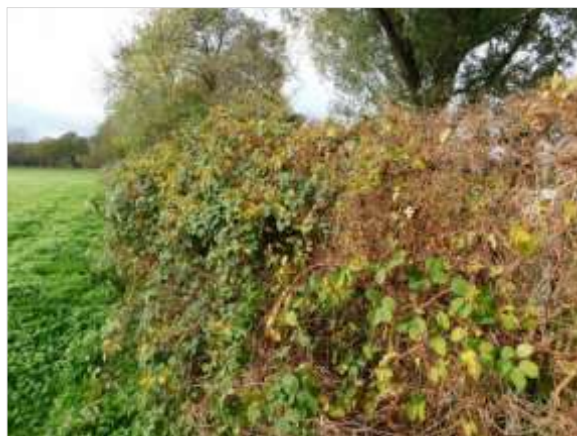
Figuur 5.4 Bramenstruweel begroeiing over het vervallen hek aan de noordkant op het plangebied.