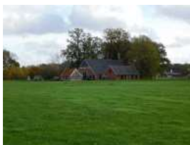
Figuur 2.6 Boerderij ten zuidoosten van de onderzoekslocatie.