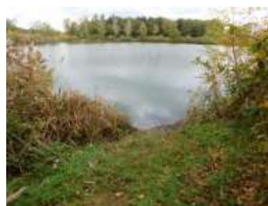
Figuur 2.8 Opening tussen de begroeiing van de houtwal voor toegang tot de visvijver.