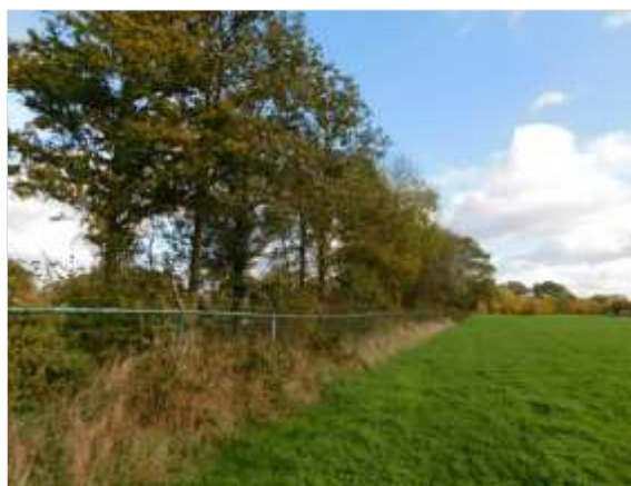
Figuur 5.2 Houtwal ten noorden van het plangebied.

De broedvogels waarvan het nest in uitzonderlijke gevallen eveneens jaarrond is beschermd, zijn voornamelijk holenbroeders, zoals spechten en mezen, of makers van grote nesten.