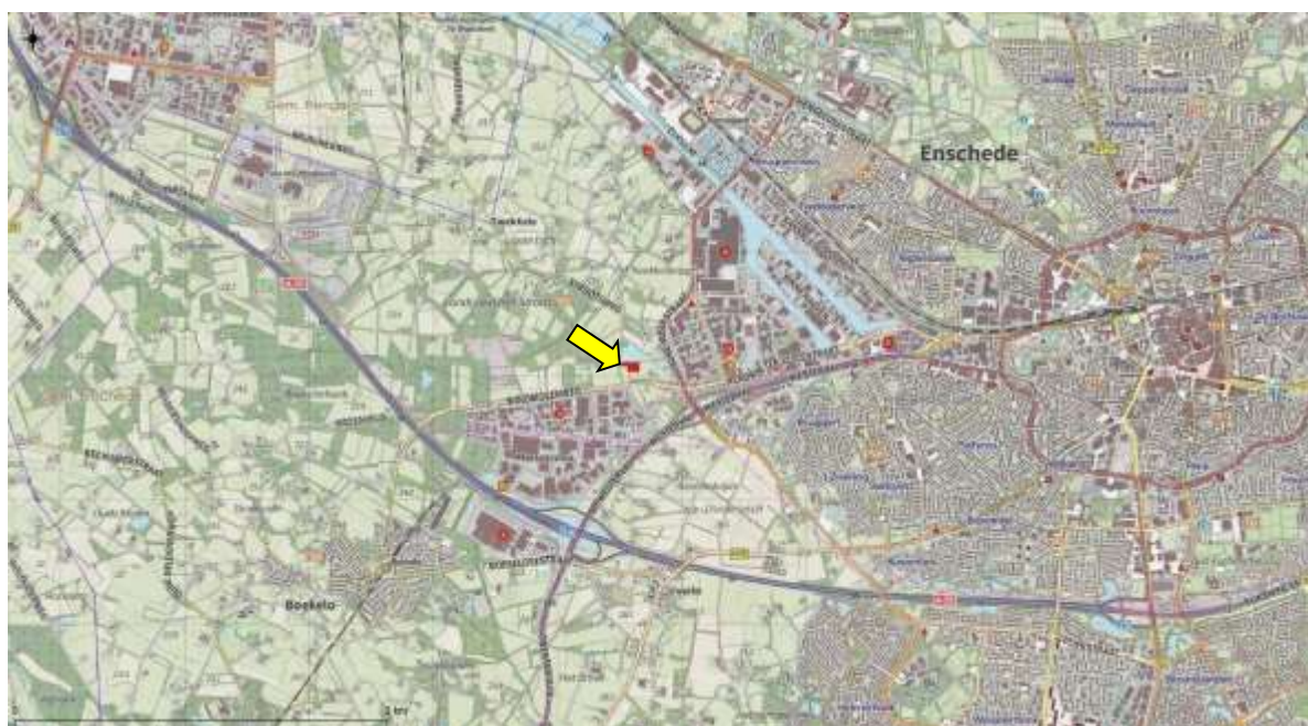
Figuur 2.1 Topografische ligging van het plangebied.

De plangebied ( \pm 7.200 \text{ m}^2 ) ligt aan de Tweekelerbeekweg, te Enschede. In figuur 2.1 is de ligging van de plangebied weergegeven.