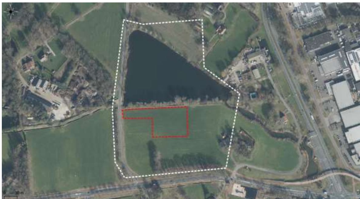
Figuur 2.2 Luchtfoto onderzoekslocatie (wit) met plangebied (rood) en directe omgeving.