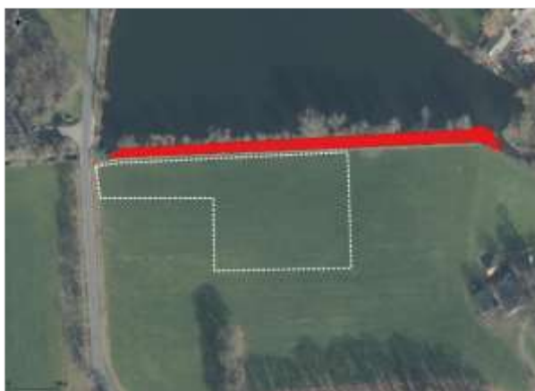
Figuur 5.1 Locatie van de houtwal is weergegeven in het rood.

Van de door de provincie aangewezen vogelsoorten waarvan het nest jaarrond beschermd is kunnen volgens de verspreidingskaarten van de NDFF de oehoe, kerkuil, steenuil, ooievaar, huiszwaluw en boerenzwaluw mogelijk in de buurt van de onderzoekslocatie voorkomen. Binnen de contouren van het plangebied is geen bebouwing aanwezig voor geschikte nestlocaties van gebouwbewonende vogel soorten. Daarnaast zijn er geen grote nesten op de onderzoekslocatie aangetroffen. De ingreep veroorzaakt alleen mogelijk afname in foerageergebied voor mogelijke nestlocaties in gebouwen op of rond de onderzoekslocatie. Echter is er op de onderzoekslocatie voldoende foerageergebied aanwezig en zijn de negatieve effecten op foerageergebied als gevolg van de ingreep uit te sluiten.