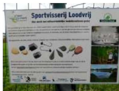
Figuur 2.5 Bord van de visserij over de visvijver bevestigd aan het vervallen hek.