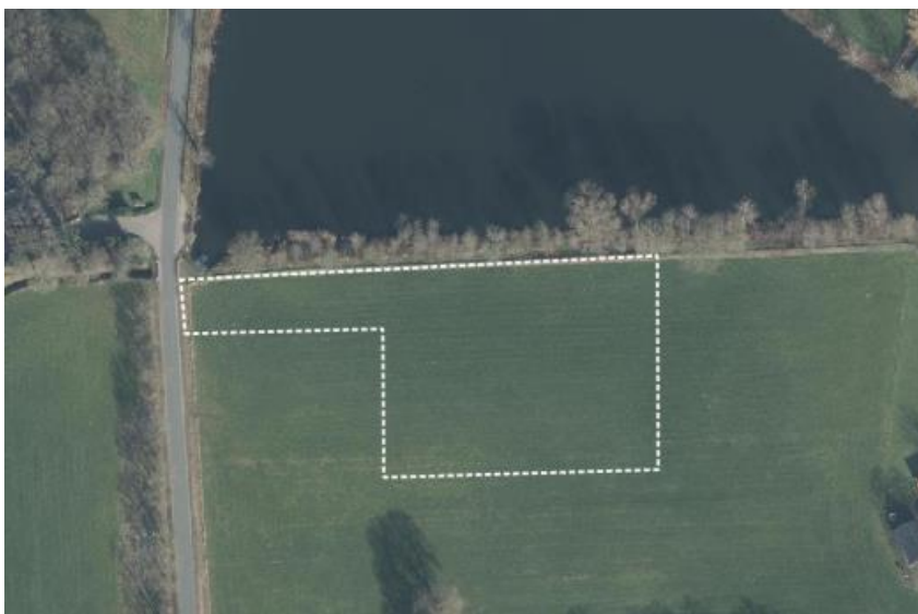
Begrenzing van het onderzoeksgebied.

De onderzoekslocatie betreft een perceel agrarisch cultuurland aan de westkant van Enschede. Direct ten noorden van de onderzoekslocatie ligt een visvijver die rond 1980 is aangelegd. Tussen de onderzoekslocatie en de visvijver ligt een houtwal met bebossing die functioneert als toegang tot de visvijver. Het pad langs de houtwal is tevens afgeschermd van de onderzoekslocatie door middel van een vervallen hek met prikkeldraad. Ten oosten van het gebied ligt een boerderij op 90 meter afstand. Ten westen ligt de weg die toegang verleent tot het gebied.