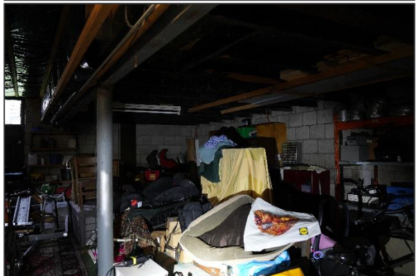
Afbeelding 3: Impressie van de grote ruimte van de schuur.