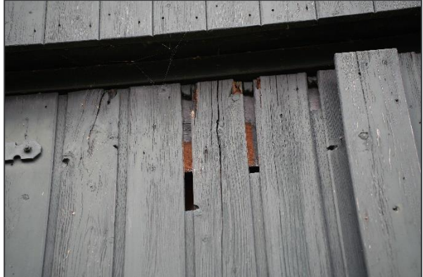
Afbeelding 2: Impressie van de schuur van buitenaf 15-11-2023.