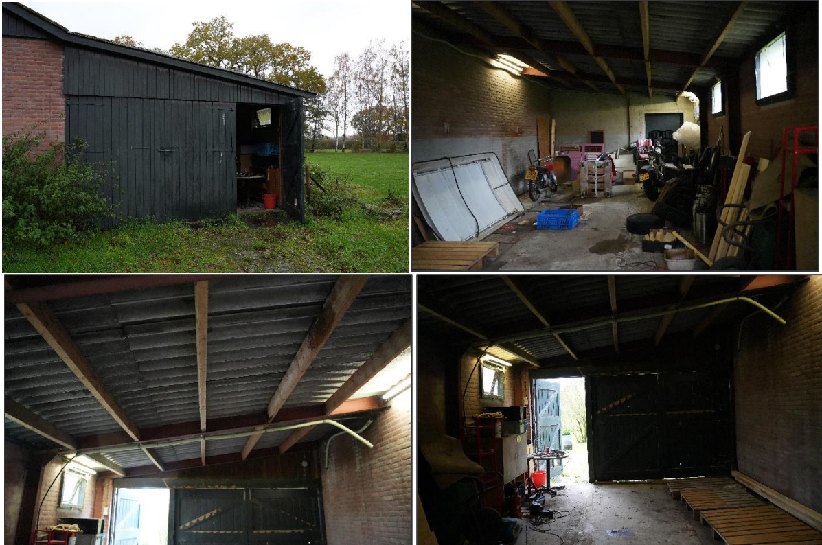
Afbeelding 4: Impressie van de kleine ruimte van de schuur.