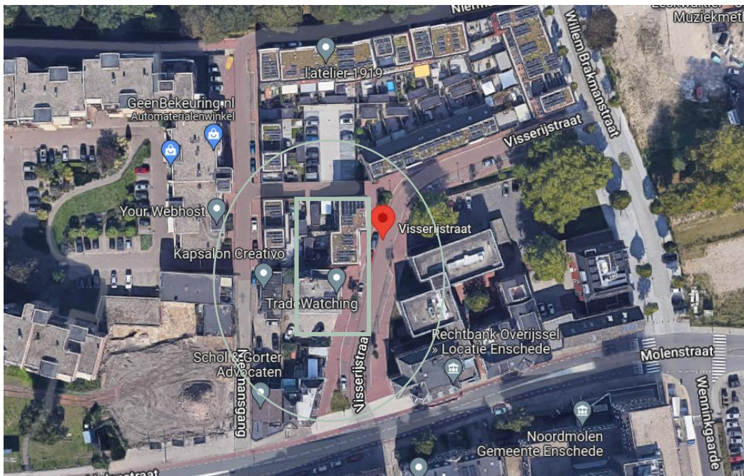
Figuur 1 – planlocatie en onderzoeksgebied

Enschede is een stad en gemeente in Twente, in het oosten van de Nederlandse provincie Overijssel. Onder de gemeente Enschede vallen, naast de stad Enschede, de dorpen Lonneker, Boekelo, Usselo, Glanerbrug en de buurtschap Tweekelo, die voor de adressering van brieven allemaal onder de woonplaats Enschede vallen.