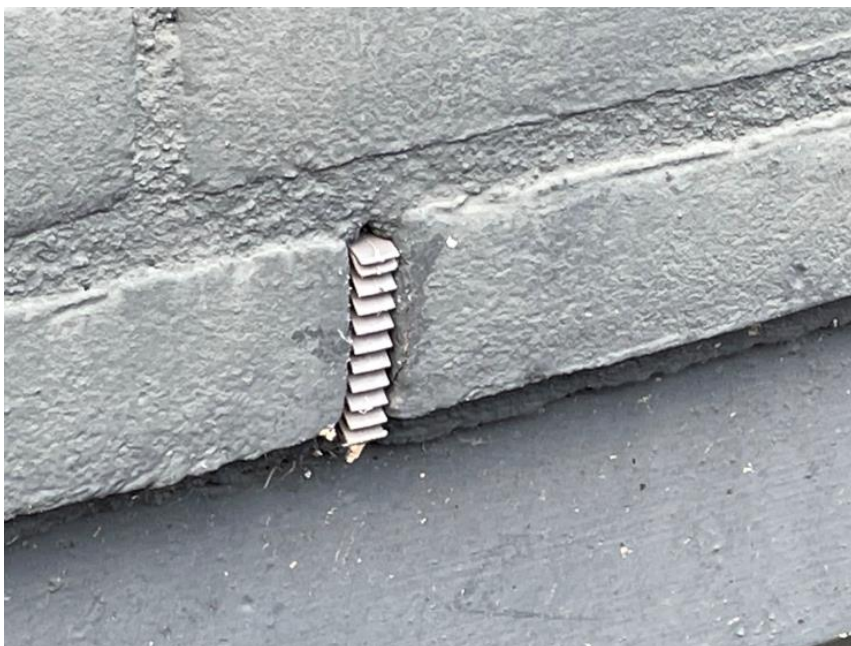
Bijenbekjes in de stootvoegen

Nader onderzoek gebouwbewonende vleermuizen wordt niet geadviseerd.