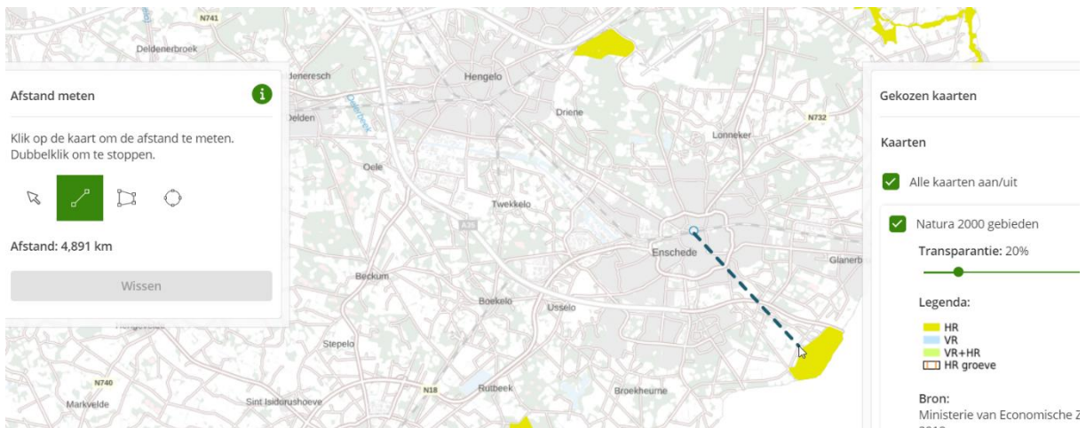
Figuur 2 – Natura2000 gebied Aamsveen

Dit geldt ook voor projecten die fysiek buiten het Natura 2000-gebied gelegen zijn maar wel een effect kunnen hebben op het gebied (externe werking).