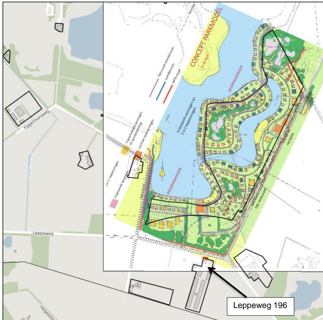
Figuur 4.1: Ligging plangebied en relevante veehouderij