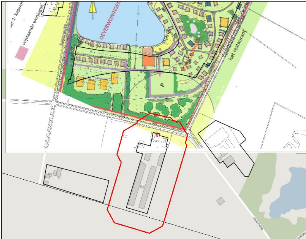
Figuur 4.3 Planologische geurcontour VA-dieren (50 meter, rood kader) rondom de veehouderij aan de Leppeweg 196 en de ligging plangebied