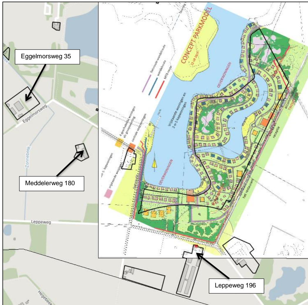
Figuur 4.2 Ligging plangebied, veehouderij Leppeweg 196 en omliggende geurgevoelige objecten

In figuur 4.3 is de maximaal planologische geurcontour van 50 meter voor de vaste afstand rondom het bouwblok weergegeven.