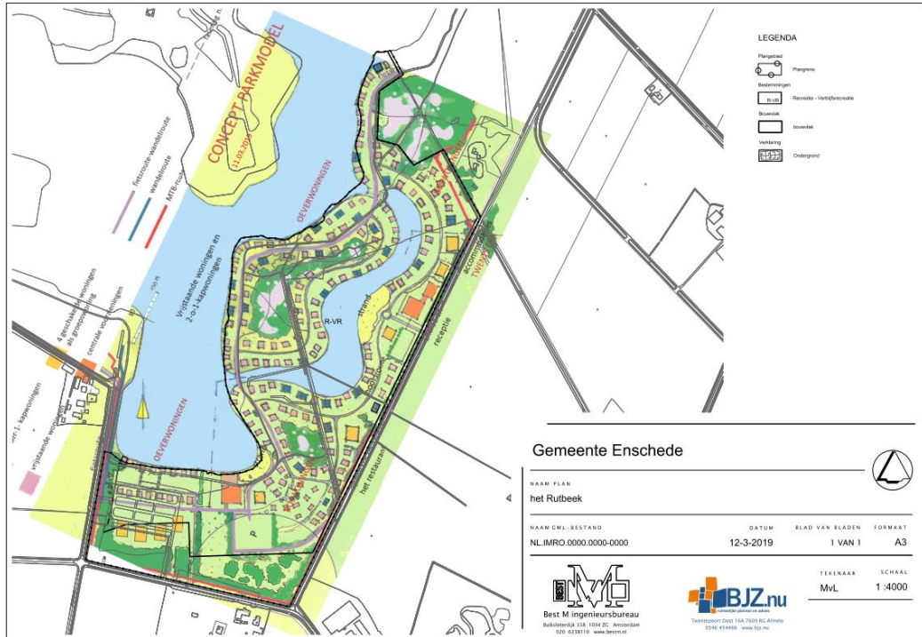
Figuur 2.2: indeling plangebied