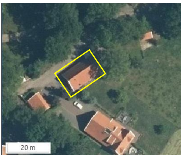
Begrenzing van het plangebied wordt met de gele lijn aangeduid.

Het plangebied bestaat uit bebouwing, erfverharding en gazon. De bebouwing in het plangebied bestaat uit een schuur en een kleine berging die tegen de schuur aan staat. De schuur is gebouwd van bakstenen en beschikt over een met dakpannen gedekt zadeldak. De schuur beschikt niet over een (holle) spouwmuur en een beschoten kap ontbreekt. De berging die naast de schuur staat is gebouwd van hout en damwandplaten en is bedekt met golfplaten. Rondom de bebouwing ligt erfverharding en gazon. Open water ontbreekt in het plangebied. Op onderstaande afbeelding wordt de begrenzing van het plangebied weergegeven. Voor een verbeelding van de huidige situatie wordt verwezen naar de fotobijlage.