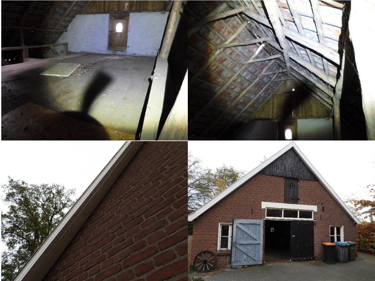
Bijlage 4. Geraadpleegde bronnen: