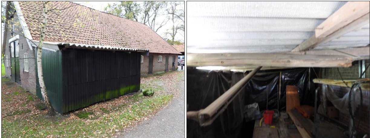
Vogels kunnen nestelen in de berging naast de schuur

Het plangebied behoort tot functioneel leefgebied van verschillende vogelsoorten. Vogels benutten het plangebied als foerageergebied en vermoedelijk nestelen er jaarlijks vogels in het plangebied. Vogels kunnen een nestlocatie bezetten in de berging. De schuur zelf is niet toegankelijk voor vogels. Vogelsoorten die mogelijk in het plangebied nestelen zijn merel, roodborst en winterkoning. Er zijn tijdens het veldbezoek geen huismussen waargenomen in het plangebied en de bebouwing wordt niet als een geschikte nestlocatie voor deze soort beschouwd: de schuur beschikt niet over een beschoten kap. Hetzelfde geldt voor gierzwaluwen, welke de voorkeur hebben voor (sub)urbane gebieden, waarbij de locatie buiten de stad niet als geschikt beschouwd wordt. Er zijn geen (oude) nesten van huiszwaluwen en boerenzwaluwen aan de gevels van de schuur of in de berging aangetroffen. Ook zijn er geen oude of potentiële nesten van roofvogels of uilen in of rondom het plangebied waargenomen. Deze nesten zijn doorgaans gemakkelijk te vinden aan de hand van schijfsporen en braakballen. Het plangebied valt binnen het verspreidingsgebied van de steenuil en ransuil maar er zijn geen waarnemingen van deze soorten vastgesteld (NDFP, 2022).