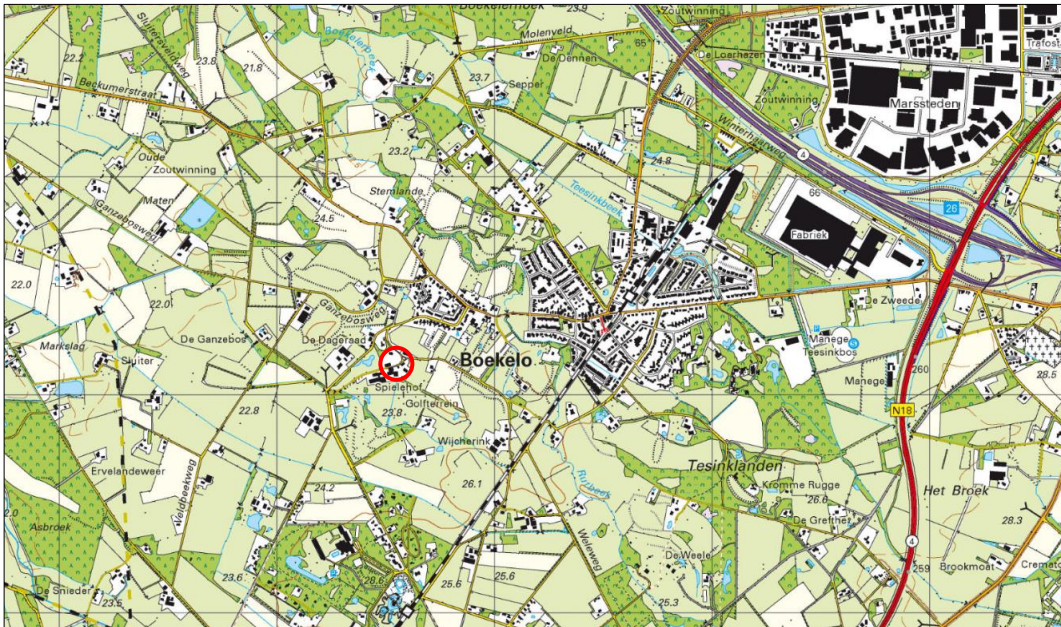
Globale ligging van het plangebied. De ligging van het plangebied wordt met de rode cirkel aangeduid.

Het plangebied is gesitueerd aan de Spieleweg 26A te Enschede, gemeente Enschede. Het ligt in het buitengebied, op circa 600 meter ten westen van de woonkern Boekelo en wordt omgeven door landelijk gebied. Op onderstaande afbeelding wordt de globale ligging van het plangebied weergegeven op een topografische kaart.