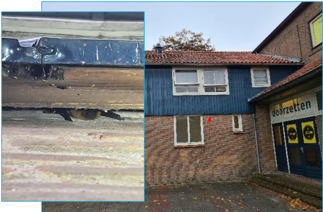
Afbeelding 2: Dwergvleermuis achter gevelbetimmering.

In de NDFP zijn geen waarnemingen gevonden die specifiek voor het plangebied gelden. Tijdens de quickscan van het plangebied in oktober 2021 is een dwergvleermuis achter gevelbetimmering aangetroffen.