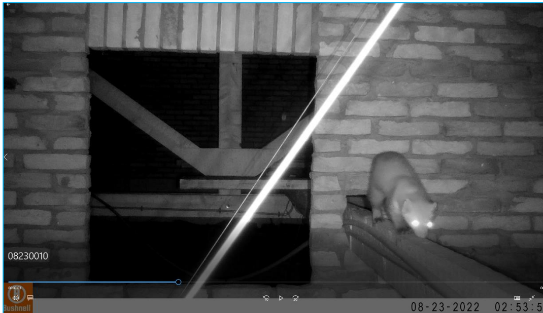
Screenshot film: Steenmarter vastgelegd op de cameraval op de zolder.

Op de cameraval op de zolder is gedurende de maanden mei, juni, juli en augustus enkele keren per maand een solitair exemplaar vastgelegd. Er zijn geen jongen waargenomen. Bij het ophalen van de camera lagen er ook verse latrines op zolder. Het betreft hier een dagrustplaats van een steenmarter.