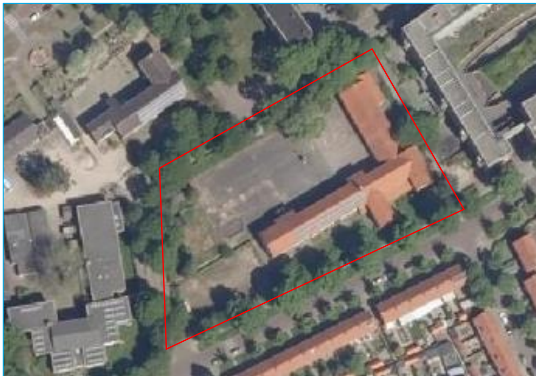
Afbeelding 1: Situering plangebied.

Het plangebied is gelegen in de bebouwde kom van Deventer en betreft een voormalige school met schoolplein, een voormalige hondenspeelplaats en groenstructuren. Het schoolgebouw wordt in de huidige situatie gebruikt door diverse bedrijven en heeft een pannendak met dakbeschot, een spouw en een kelder. De spouw is na-geïsoleerd met korrels. Het elektriciteitshuisje op het terrein is geen onderdeel van het plangebied.