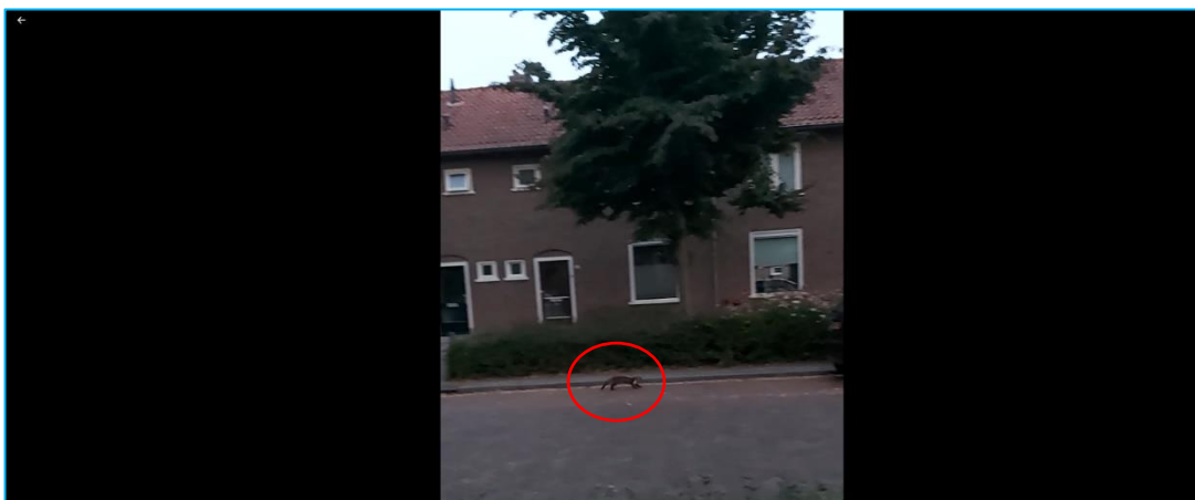
Screenshot film: Steenmarter rennende door de Van Heetenstraat.

Een steenmarter is tijdens meerdere veldbezoeken foeragerend waargenomen in het plangebied en rennend langs de Van Heetenstraat.