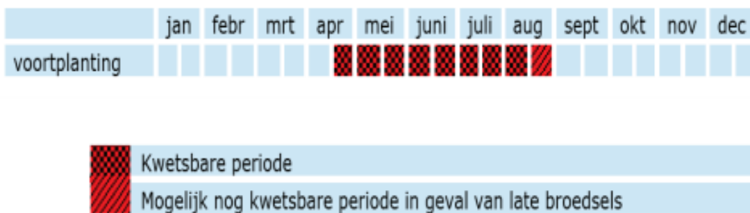
Figuur 7: Op hoofdlijnen weergegeven de kwetsbare perioden van de gierzwaluw.