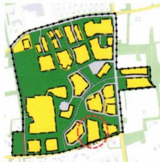
Afbeelding 1.2: Uitsnede geldend bestemmingsplan

Note: De rode cirkel geeft het betreffende perceel aan.