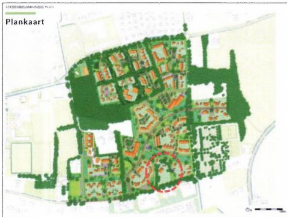
Afbeelding 2.4: Stedenbouwkundig plan Oosterdalfsen Noord

Huidig bestemmingsplan (hoofdstuk 1.4 in Toelichting)