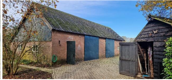
Afbeelding 5. Schuur