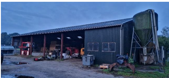
Afbeelding 8. Open kapschuur