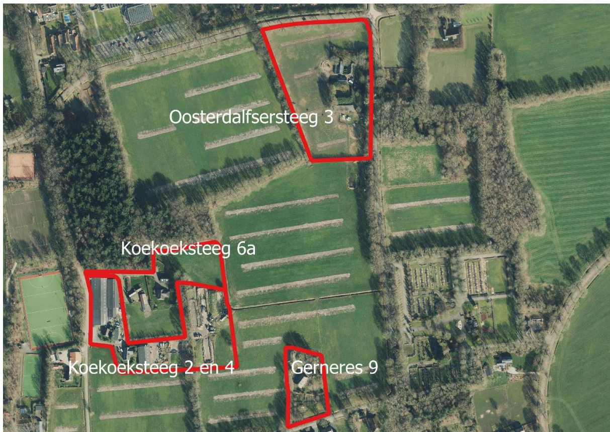
Afbeelding 1. Overzichtskaart met de onderzoeksgebieden

Binnen het plangebied liggen vier erven waarbinnen het onderzoek is uitgevoerd. Het ligt ten oosten van Dalfsen aan de wegen Gernerres, Koekoeksteeg, Haersolteweg en Oosterdalfsersteeg (zie afbeelding 1). Hieronder is per erf een beschrijving gegeven van de huidige situatie en welke maatregelen worden uitgevoerd. Voor alle erven geldt dat de maatregelen buiten het broedseizoen worden uitgevoerd en dat alleen beplanting direct rondom de te slopen gebouwen wordt verwijderd.