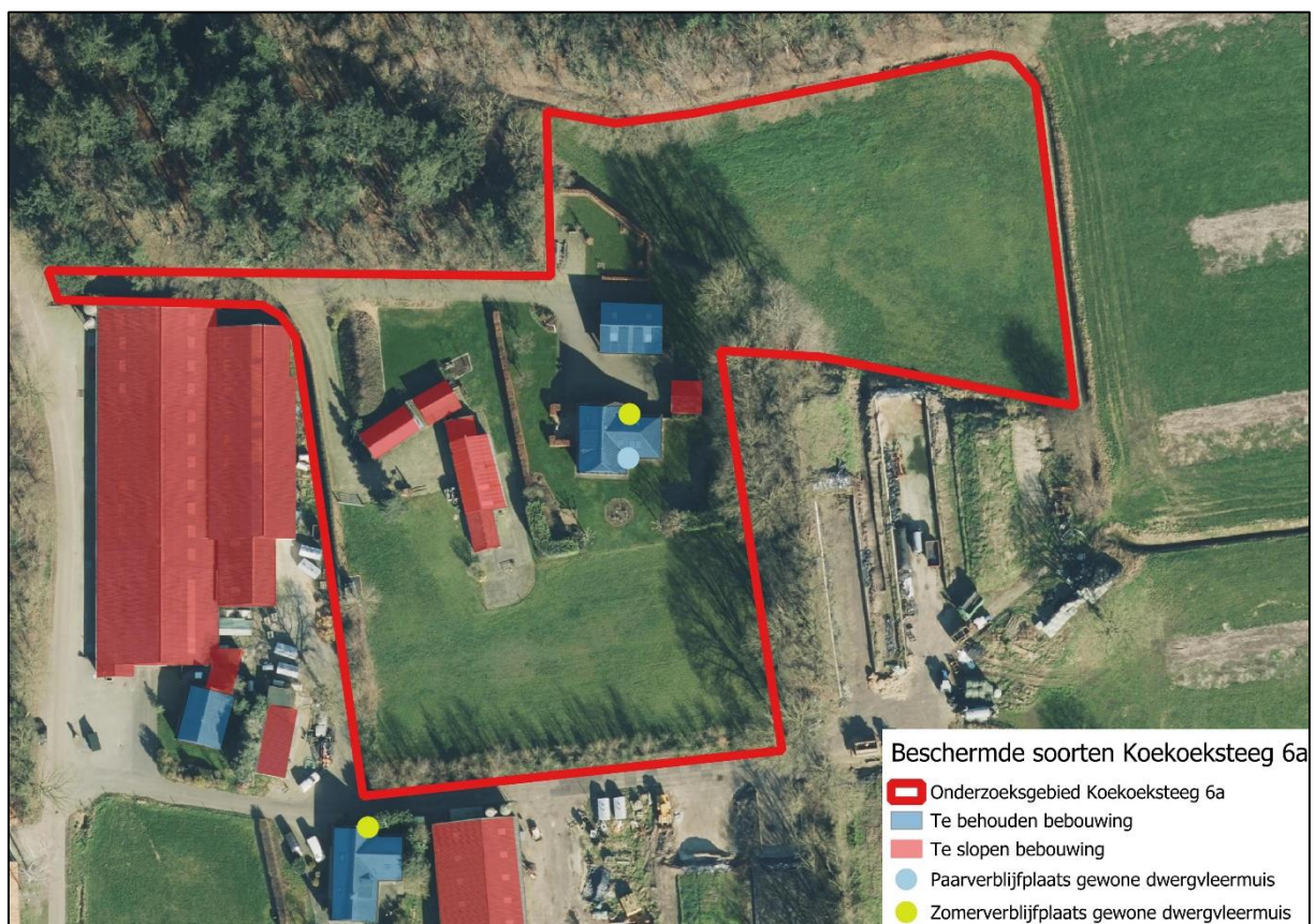
Afbeelding 23. Maatregelen en aangetroffen beschermde soorten op het erf aan Koekoeksteeg 6a.

In figuur 23 is weergegeven welke beschermde soorten zijn aangetroffen in de bebouwing op het erf aan de Koekoekstaag 6A.