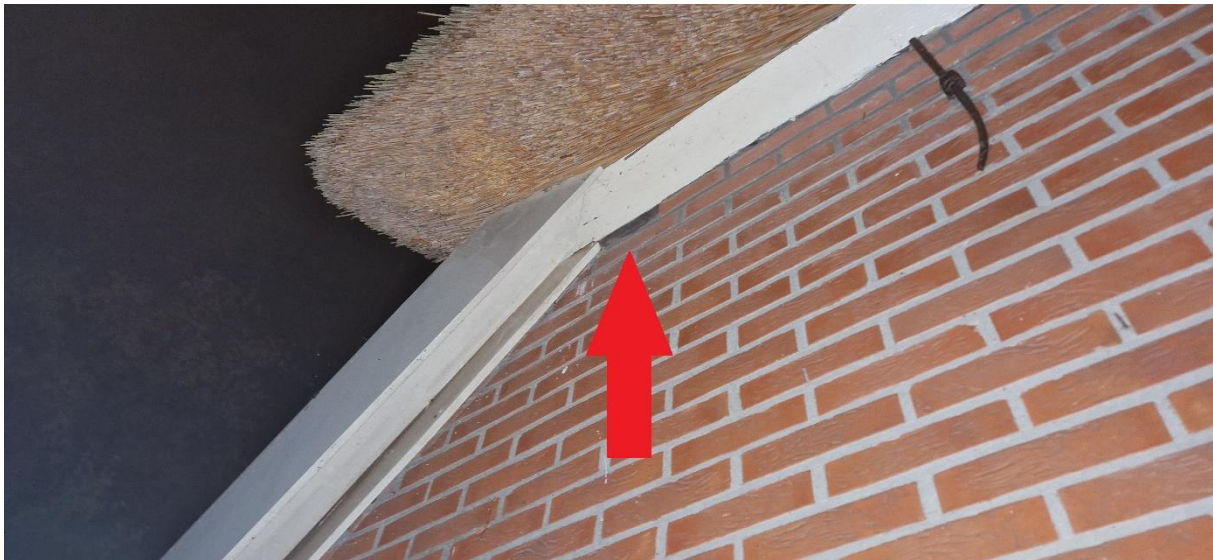
Afbeelding 20. Invliegopening gewone dwergvleermuis.

In het woonhuis is één paarverblijfplaats van de gewone dwergvleermuis vastgesteld. Op 20 september 2023 vloog een gewone dwergvleermuis uit de opening en ging voor de woning baltsend vliegen. De uitvliegopening bevindt zich tussen de muur en de houten dak oversteek. Zie voor de locatie afbeelding 19 en voor opening afbeelding 20. Op de zolder van het woonhuis zijn geen vleermuiskeutels aangetroffen.