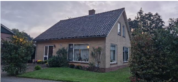
Afbeelding 7. Woonhuis met nummer 4