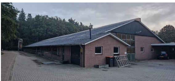
Afbeelding 10. De koeienstal