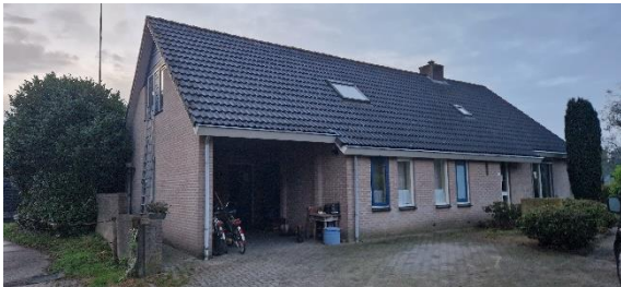
Afbeelding 6. Woonhuis met nummer 2

Op afbeelding 21 zijn de locaties van het woonhuis en de schuren te zien. De bebouwing op het erf van Koekoeksteeg 2 en 4 bestaat uit twee woonhuizen, diverse schuren en een koeienstal. Het woonhuis op het perceel van Koekoeksteeg 2 heeft aan de noordzijde een spouwmuur met open stootvoegen. Het woonhuis op het perceel van Koekoeksteeg 4 heeft geen open stootvoegen. Rondom de bebouwing is beplanting aanwezig zoals hagen en blad houdende sierheesters. Op het erf lopen ongeveer 20 katten. Er is geen oppervlaktewater aanwezig. Het woonhuis met nummer 2 blijft behouden. De schuren en het woonhuis met nummer 4 worden gesloopt.