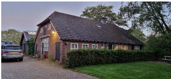
Afbeelding 14. Woonhuis

Op afbeelding 26 zijn de locaties van het woonhuis en de schuren te zien. Het erf van Oosterdalfsersteeg heeft een woonhuis, een paardenstal en drie schuren. De schuren worden dagelijks als opslag voor verkoop van paarden attributen gebruikt. Het woonhuis heeft geen open stootvoegen. Er is geen oppervlaktewater aanwezig. Het woonhuis blijft behouden. De paardenstal en de vier schuren worden gesloopt.