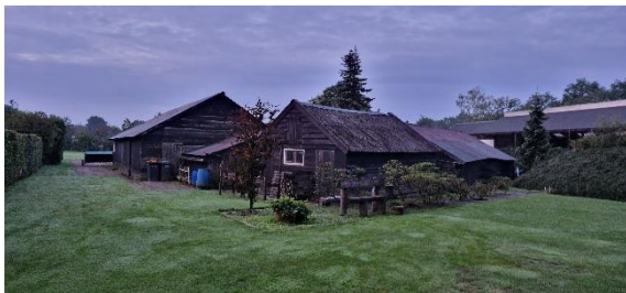
Afbeelding 13. Kleine schuren