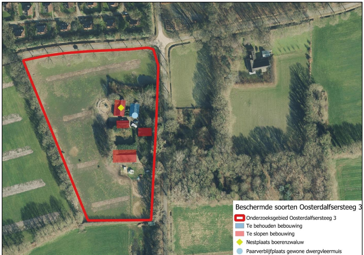
Afbeelding 26. Onderzoeksgebied met gevonden beschermde soorten.