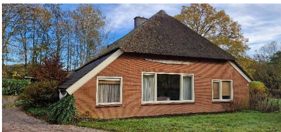
Afbeelding 2. Woonhuis

Op afbeelding 19 zijn de locaties van het woonhuis en de schuren te zien. De bebouwing op het erf van Gernerres 9 bestaat uit een woonhuis met een rieten dak, enkele schuren en een ingerichte tuin met bomen, sierheesters en sierplanten. Het rieten dak is niet van binnen geïsoleerd. Er zijn geen open stootvoegen aanwezig. Er is geen oppervlaktewater op het erf aanwezig. Alleen de schuren worden gesloopt, het woonhuis blijft behouden.