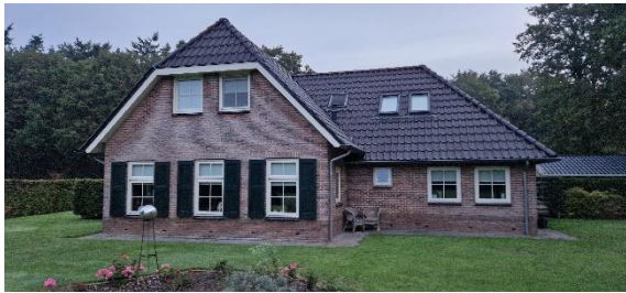
Afbeelding 11. Woonhuis

openingen. Er is geen oppervlaktewater aanwezig. Het woonhuis, het bijgebouw en de beplanting blijven behouden. De kleine schuren worden gesloopt