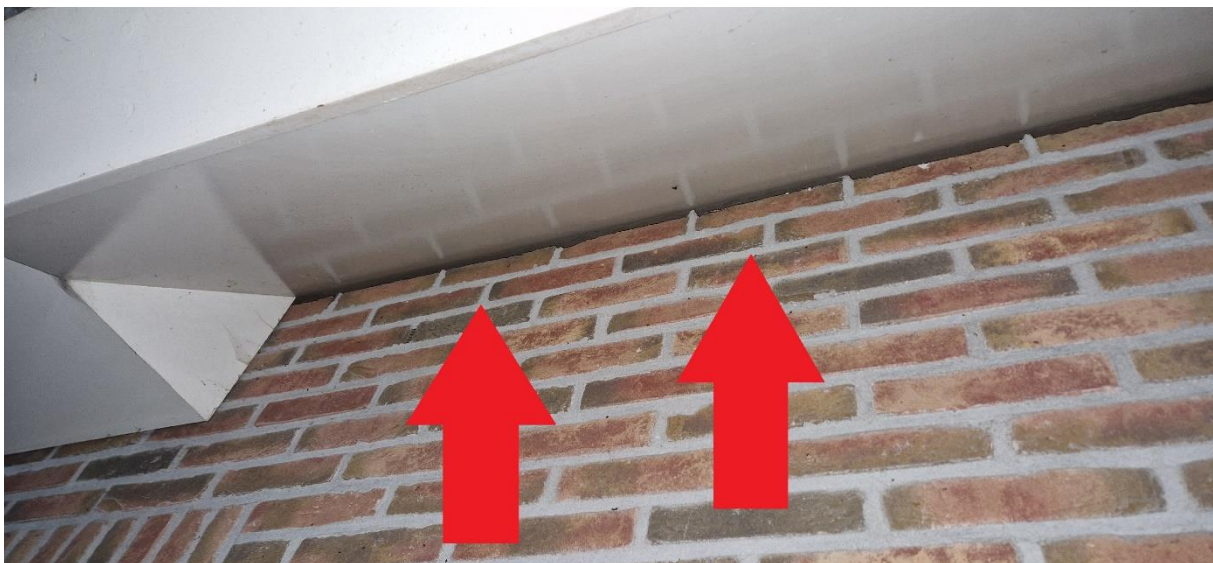
Afbeelding 24. Invliegopening naar zomerverblijfplaats gewone dwergvleermuis noordzijde woonhuis.

In het woonhuis is een zomer- en een paarverblijfplaats van gewone dwergvleermuis vastgesteld. Op 29 juni 2023 zijn twee uitvliegende gewone dwergvleermuizen waargenomen aan de noordzijde. Deze verlieten direct het plangebied in noordelijke richting. Aan de zuidzijde van het pand zijn op 31 mei 2023 twee uitvliegende gewone dwergvleermuizen gezien en op 11 juli vloog op dezelfde locatie één exemplaar gewone dwergvleermuis rond. Deze vloog bij zonsopgang in de verblijfplaats. De twee invliegopeningen bevonden zich tussen de muur en de houten dak oversteeek (zie afbeeldingen 24 en 25). De verblijfplaatsen werden nooit tijdens een vleermuisonderzoek gelijktijdig gebruikt. In de houten schuurtjes zijn geen sporen als vleermuiskeutels of afgebeten nachtvlindervleugels aangetroffen.