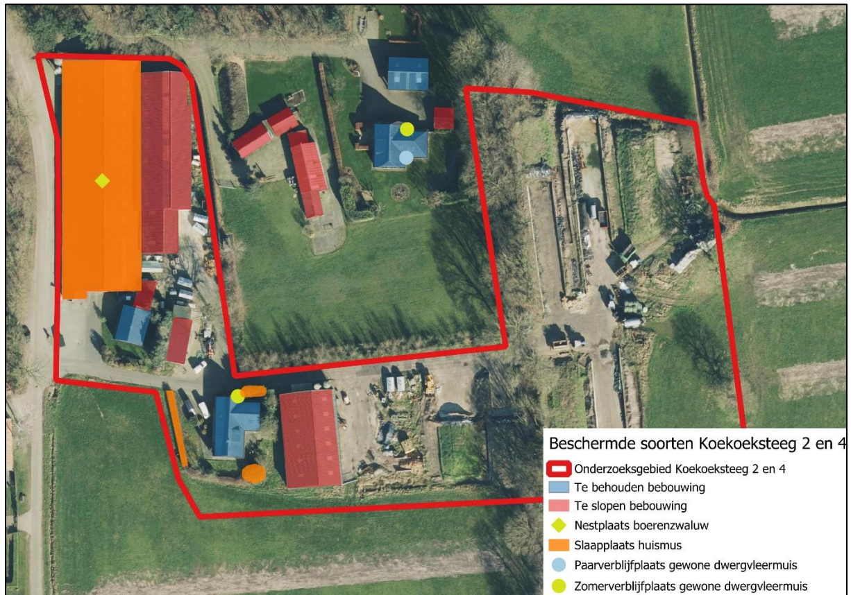
Afbeelding 21. Maatregelen en aangetroffen beschermde soorten op het erf aan de Koekoeksteeg 2 en 4.

In figuur 21 is weergegeven welke beschermde soorten zijn aangetroffen