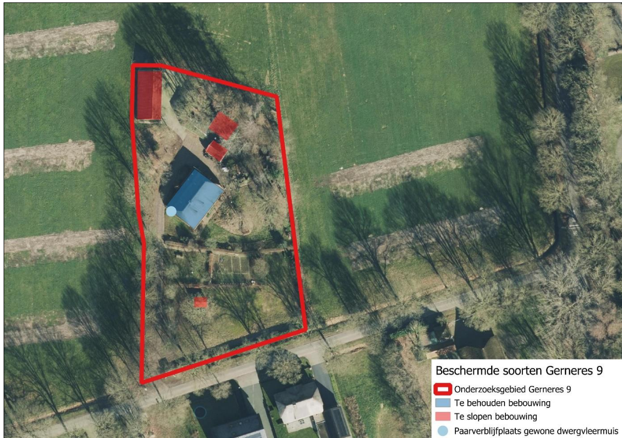
Afbeelding 19. Maatregelen en aangetroffen beschermde soorten op het erf aan de Gernerres 9

In figuur 19 is weergegeven welke beschermde soorten zijn aangetroffen.