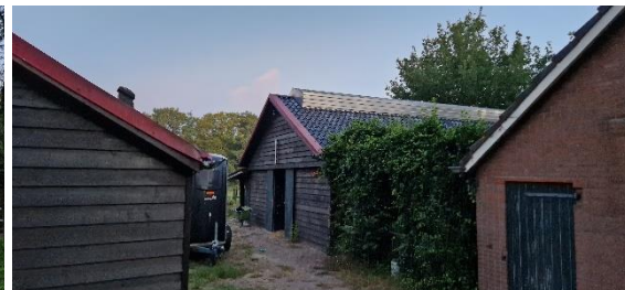
Afbeelding 15. Paardenstal