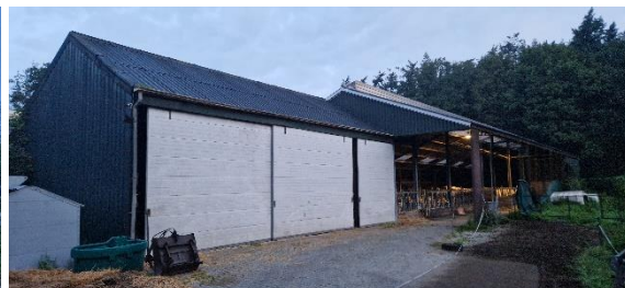
Afbeelding 9. Dichte schuur met open koeienstal