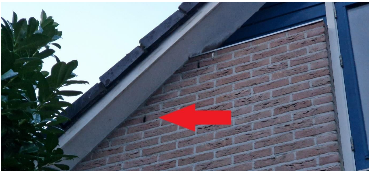
Afbeelding 22. Invliegopening gewone dwergvleermuis.

In het woonhuis nummer 2 is één zomerverblijfplaats van de gewone dwergvleermuis vastgesteld (zie afbeelding 22). Op 25 mei 2023 vloog één exemplaar van de gewone dwergvleermuis via een open stootvoeg het pand uit en verliet direct het plangebied. De verblijfplaats bevindt zich naar alle waarschijnlijkheid in de spouwmuur.