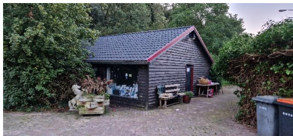
Afbeelding 18. Opslag winkel schuur 2