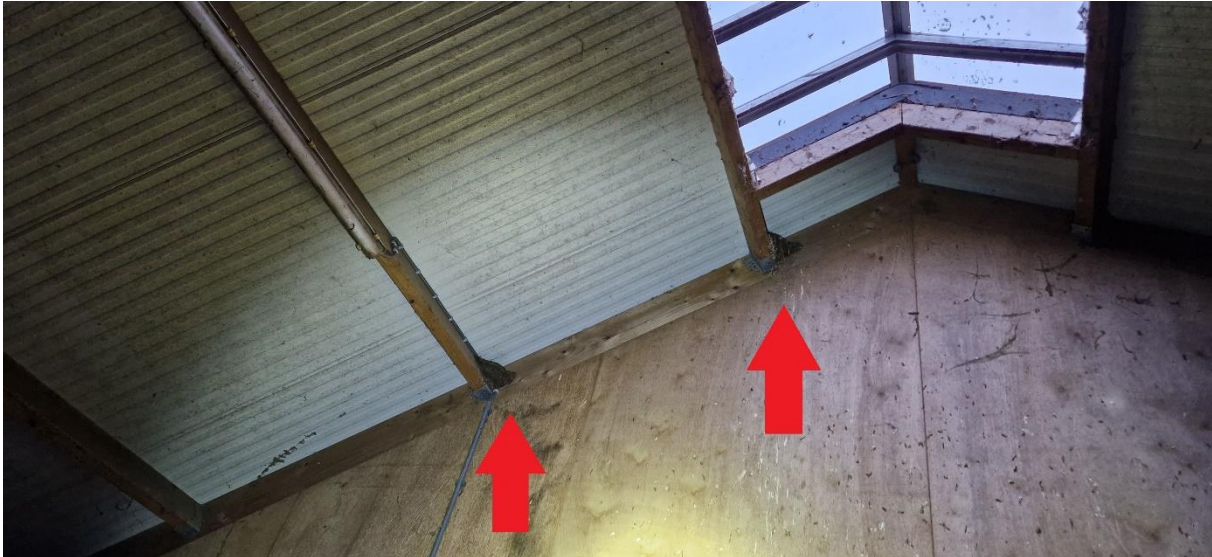
Afbeelding 27. Twee van de acht boerenzwaluwnesten in de paardenstal.