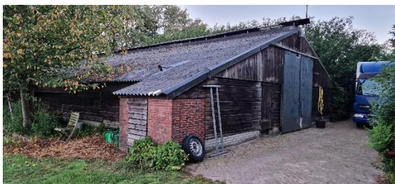
Afbeelding 16. Opslag schuur