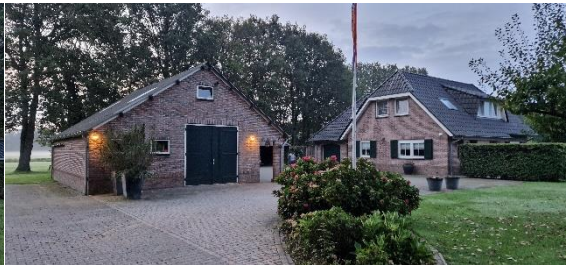
Afbeelding 12. Bijgebouw