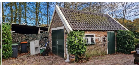
Afbeelding 3. Schuur