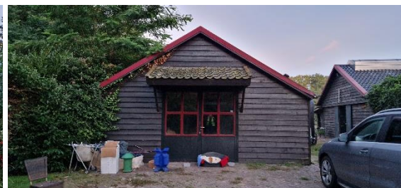
Afbeelding 17. Opslag winkel schuur 1