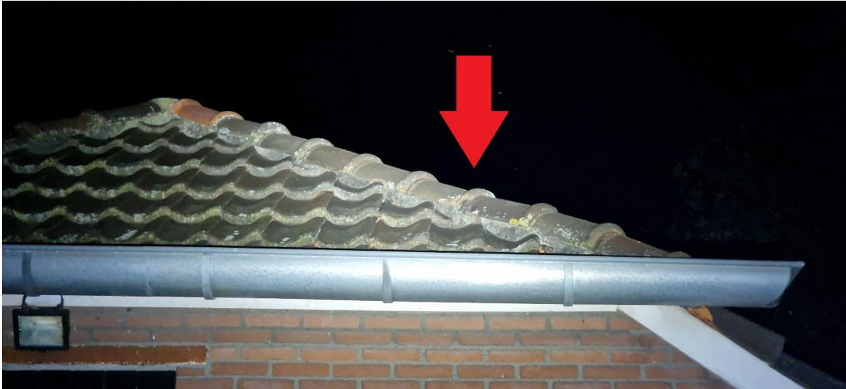
Afbeelding 28. Invliegopening gewone dwergvleermuis.