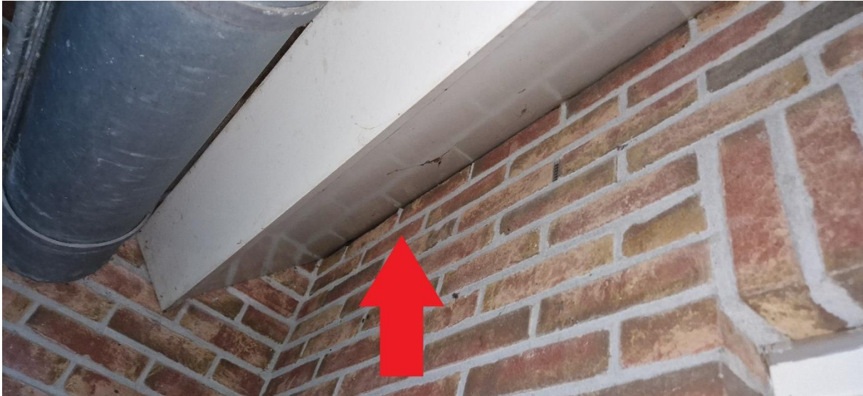
Afbeelding 25. Invliegopening naar paarverblijfplaats gewone dwergvleermuis zuidzijde woonhuis.