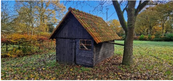
Afbeelding 4. Schuur