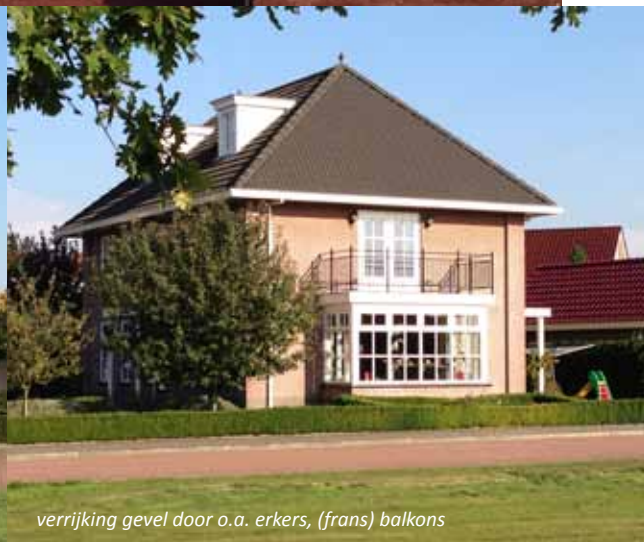
verrijking gevel door o.a. erkers, (frans) balkons