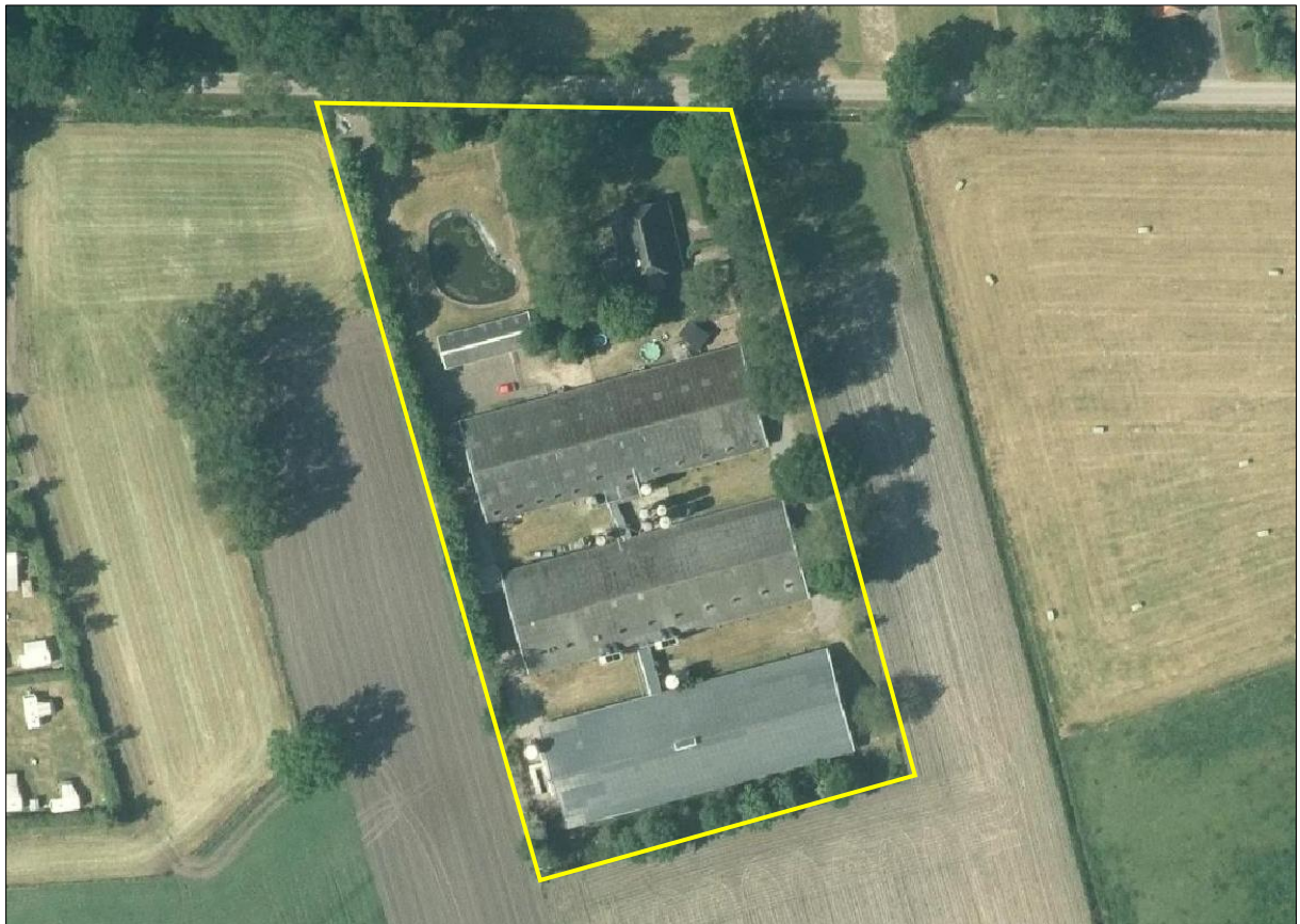
Luchtfoto en begrenzing van het plangebied (gele lijn).

Het plangebied bestaat uit een varkenshouderij met drie stallen, een kapschuur en een woning. De drie stallen hebben dezelfde grootte en een vergelijkbare bouwstijl. De varkenstallen hebben een steens buitenmuur met luchtsponw en een dak van golfplaten. De stal achter op het erf heeft een dakschild van damwandplaten. Ook de tussenleden tussen de stallen zijn gebouwd van damwandplaten. De dakoverstekken van de stallen sluiten nauw aan op de gevels en de stallen zijn wind- en waterdicht. Rondom de stallen is erfverharding aanwezig waar spullen en materialen liggen opgeslagen. Daarnaast staan er bij de stallen meerdere voedersilo's. Tegen de stallen zijn op sommige plekken struiken aangeplant. De kapschuur op het erf heeft gevels van damwandplaten en een dak van golfplaten. Aan de kant van de Rekvelweg staat aan de oostkant het woonhuis en aan de westkant ligt een vijver. De vijver is aangelegd op een kaal grasveld zonder bomen. Rondom de woning staan meerdere eiken. Het gehele erf wordt omzoomd door een gemengde houtwal met onder andere eiken, els, braam en heesters.