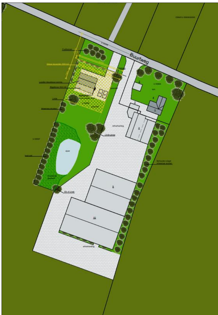
Plattegrond van het wenselijk eindbeeld.

Het voornemen bestaat om een extra woning met bijgebouw in het plangebied te realiseren. Om deze nieuwbouw te realiseren dient een deel van de aanwezige beplanting en de aanwezige fundering van een gesloopte schuur verwijderd te worden. Tevens wordt de bestaande vijver vergroot en wordt het erf d.m.v. een nieuw aan te leggen verharde inrit in verbinding gebracht met de zuidelijk gelegen Strenkhaarsweg. Daarnaast wordt de bestaande inrit op het erf vervangen door een nieuwe verharde inrit. Aangenomen wordt dat een deel van de bestaande erfverharding wordt verwijderd en vervangen en dat er nieuwe erfverharding wordt aangelegd. Het plangebied wordt nadien landschappelijk ingepast, middels aanplant van erfbeplanting, kruidenrijk grasland, fruitbomen, houtsingels, hagen en loofbomen. Op onderstaande afbeelding is een plattegrond van het wenselijk eindbeeld weergegeven.