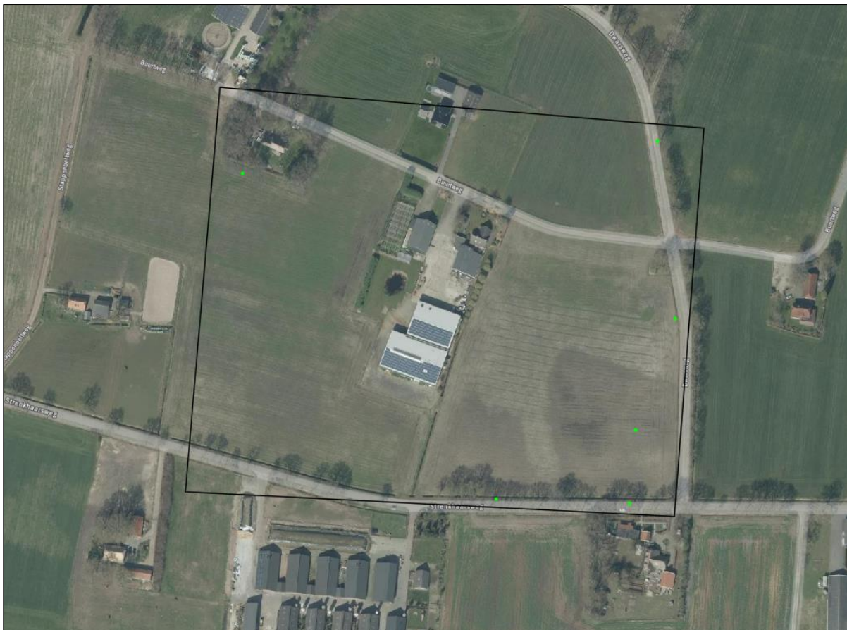
Verspreiding van alle bekende records in het plangebied.

Op 2 augustus 2023 is de NDFF geraadpleegd en is gekeken of waarnemingen van beschermde planten en dieren aanwezig zijn in de databank. In een ruime begrenzing van het zoekgebied rondom het plangebied, zijn 6 verschillende waarnemingen bekend in de NDFF. Voor de verspreiding van de waarnemingen, zie luchtfoto onder.