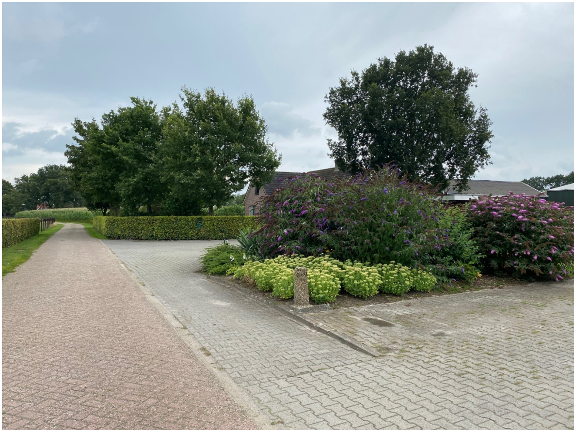
Erffperceel Buurtweg 4, Lemelerveld, Dalfsen

Datum : 23 augustus 2021 Kader : advies ontwikkeling Sloop voor Kansen (agrarisch naar wonen) Fase : initiatief