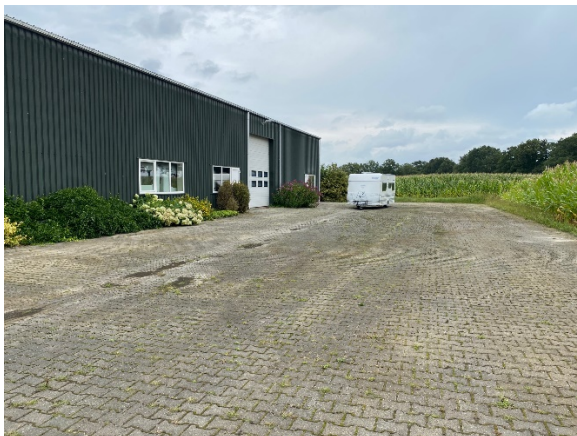
De opzet van het terrein met de verharding rond de bebouwing.