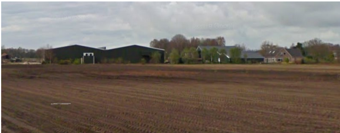
De grote loods gezien vanuit het oosten.