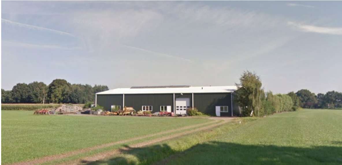
De grote loods gezien vanuit het zuiden met aan de rechterzijde de huidige singel. De witte tinten vallen op in het landschap.